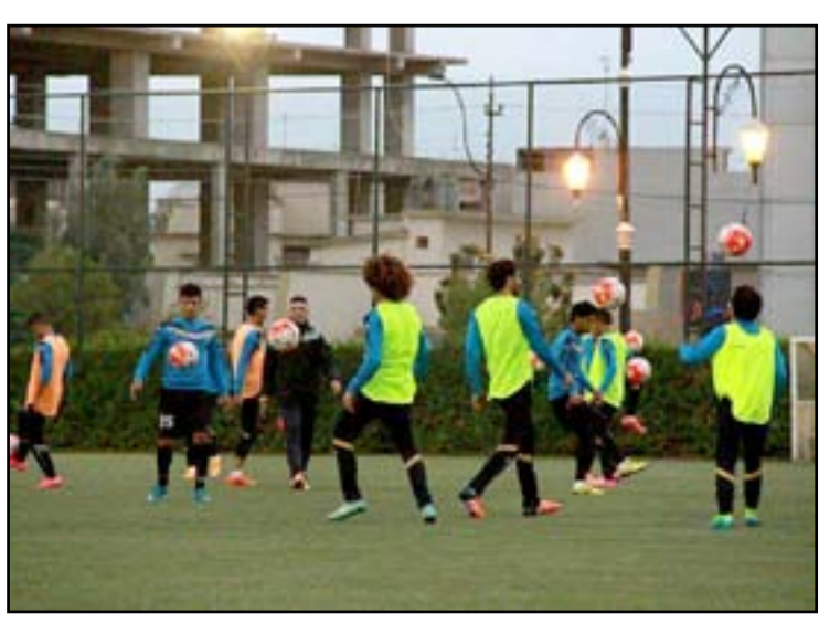
تطبيق المفردات التكتيكية التي تعطي لهم . وأشار أن المنتخب الاولمبي لكرة القدم لن يخوض مباراة تدريبية مع المنتخب الوطني لكرة القدم هناك لاسيما إن المدرب السلوفيني ستريشكو كاتانيتش غرض النظر عن اللقاء الودي الثالث الذي كان من المقرر إجراؤه يوم الثاني من شهر كانون الثاني المقبل واكتفى بدياراتي الصين التي

نتيجة لدخول المنتخب القطري في معسكر تدريبي ضمن برنامج النهائي قبل خوض منافسات بطولة كأس آسيا لكرة القدم حيث سيتمكن الملك التدريبي بقيادة المدرب غني شهيد من التعرف على المننويات الحقيقية لجميع اللاعبين الذين تم اختيارهم من قبله سواء كانوا محليين ومغربيين وزيادة الانسجام والتفاهم فيما بينهم الى جانب