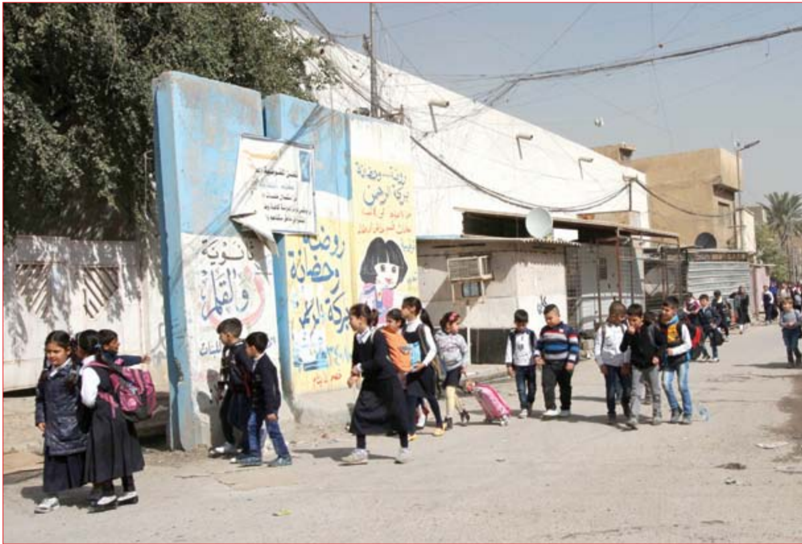
المدارس تستأنف الدوام بعد تنفيذ ضربات جوية.....

الدوري المحلي عطل ماكنة هجوم المنتخب 15 عاماً