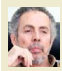
منذ الخمسينيات ونحن نسمع دور النشر تهفت: مبيعنا تنافس رهن سوق الكتب في العراق. الناس تقرأ في العراق، منذ الخمسينيات. ونحن العراقيين نفخر بذلك. ولكن أحدا يحتاج أن يرتقي التل ويتعبد عن المشهد، ليرى بوضوح ما الذي فعلته الكتب بنا، جيلاً بعد جيل.

أمل أن يتسنى لي الوقت لعرض بعض من هذه الكتب.