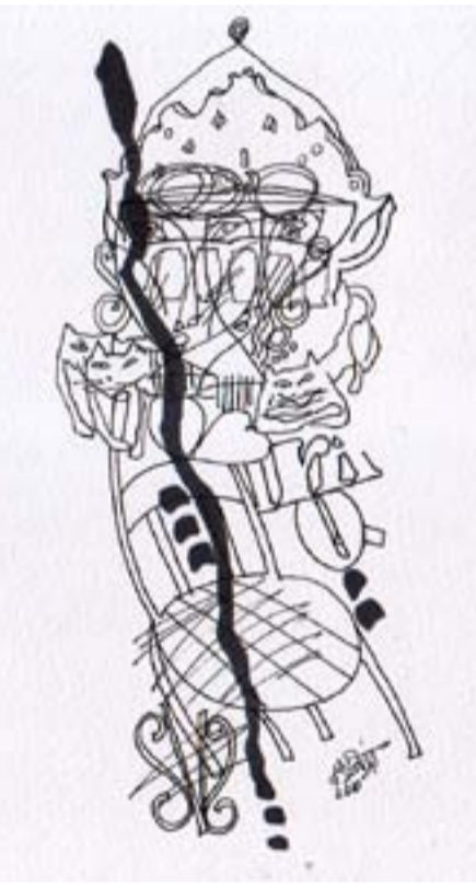
إيقاعُ خيوطِ رطبة. تغدقُ هذيانها الراقصِ بأكوارِ قشرةِ رقيقة. من سلاله أفواه مطعونة بضبابِ برآقٍ. تقوده