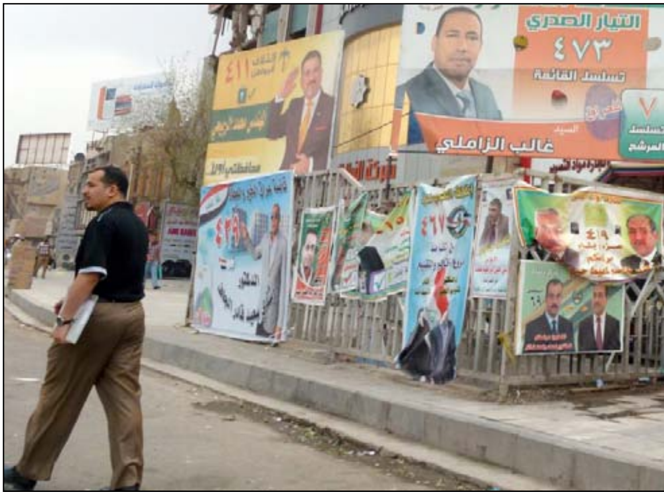
لافئات انتخابية أثناء مجالس المحافظات الأخيرة. اشراف

قبل أسابيع شهد مجلس محافظة بغداد أحداثاً دراماتيكية، انتخب المجلس فاضل الشويبي عضو تحالف "سائرون" محافظاً لبغداد خلفاً للمحافظ السابق عطاوان العطاوي عضو "اتلاف دولة القانون". بعدها، أجرى المجلس نفسه انتخابات ثانية واختار فلاح الجزائري محافظاً لبغداد في صراع جديد بين كتلتين "الإصلاح والإعمار" المدعومة من مقتدى الصدر، و"البناء" المدعومة من هادي العامري، إلا أن رئيس الجمهورية رفض المصادقة على انتخاب أي محافظ وقرر توجيه القضية إلى القضاء لحسمها.