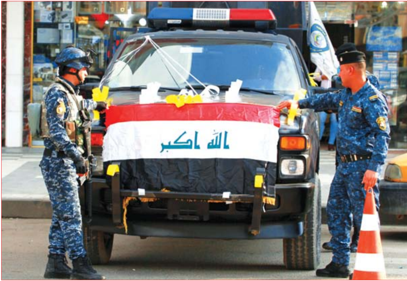
أفراد الشرطة يحتفلون بعيدهم ..... عسة: محمود رؤوف

دولة القانون والنصر يتبادلان الاتهامات بشأن إعادة قوات التحالف