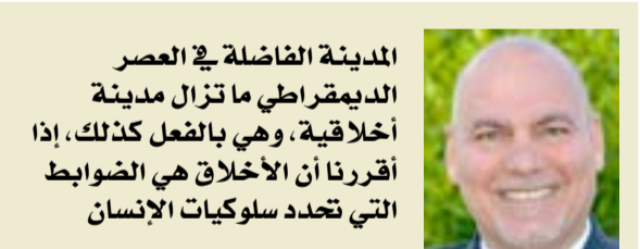
المدينة الفاضلة في العصر الديمقراطي ما تزال مدينة أخلاقية، وهي بالفعل كذلك، إذا أقرنا أن الأخلاق هي الضوابط التي تحدد سلوكيات الإنسان

وفي العراق، اليوم، في عصر ما قبل الدولة (الجاهلية المعاصرة) لا ضوابط موظفي الدولة (وشتان بين الوظيفة والعمل) بما يعني أن الدولة العراقية بلا أخلاق، وأن البرلمان العراقي بلا أخلاق، حتى يتم انتخاب هذه اللجنة أسوة بلجان التعليم، والمالية، والأمن والدفاع... فالعراق يحتاج إلى ضبط السلوكيات والأخلاق قبل حاجته إلى الأمن وإلى لقمة العيش والماء الصالح للشرب، لأن الأخلاق هي الضوابط التي تصنع عبرها "الدولة الكريمة" قبل قيام "دولة الخلافة" أو "دولة الإمام المهدي" ع.ج.