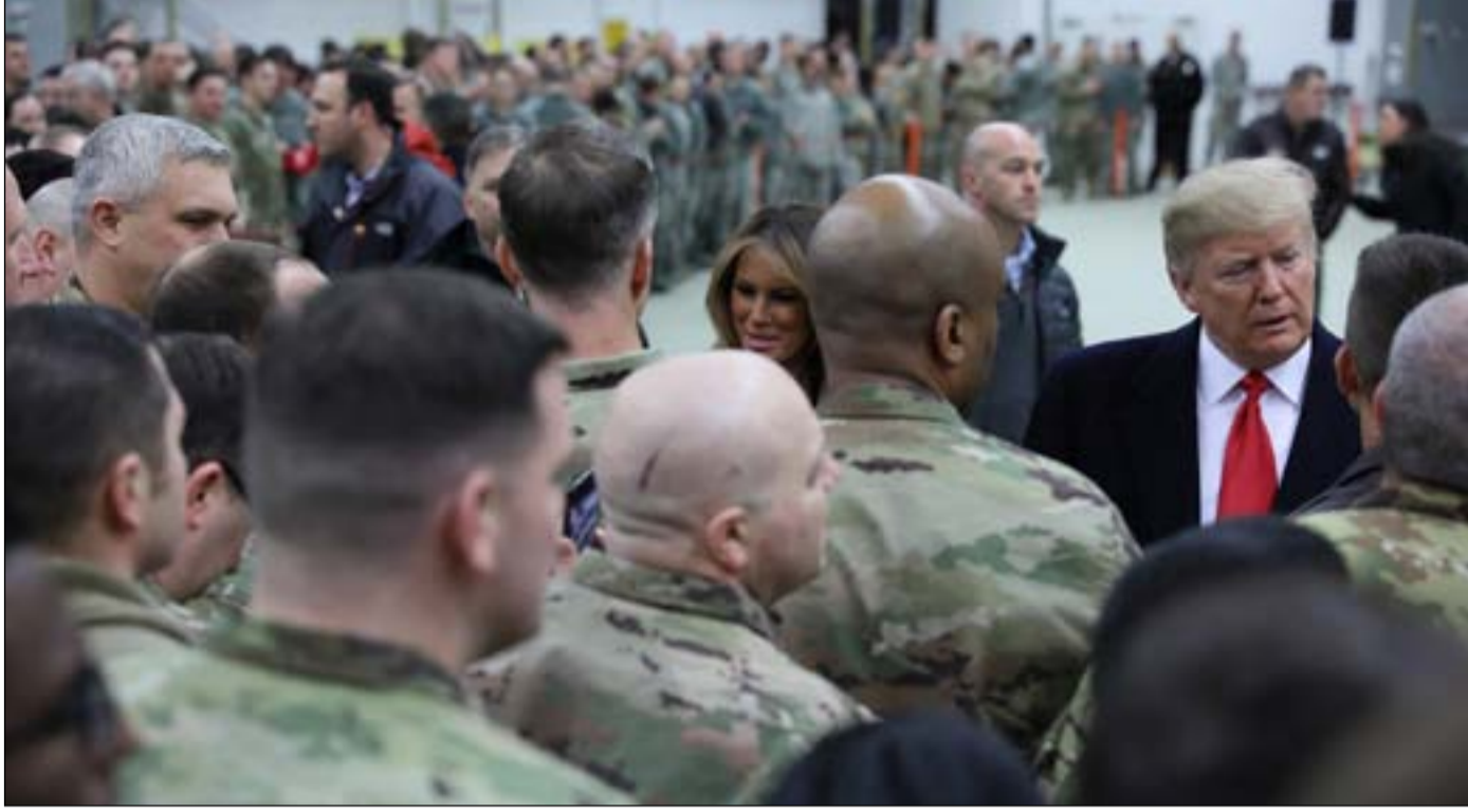
ترامب مع جنود أميركان في قاعدة الأسد.

أميركا ترسل يومياً 30 آليّة عسكريّة و15 طائرة محمّلة بالجنود إلى "عين الأسد"