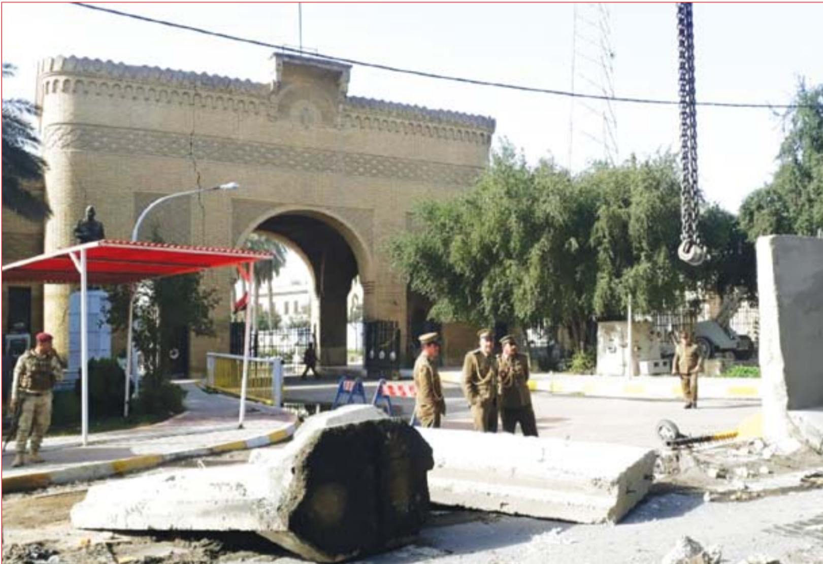
الأمانة تواصل رفع الكتل الكونكريتية من شوارع بغداد.....