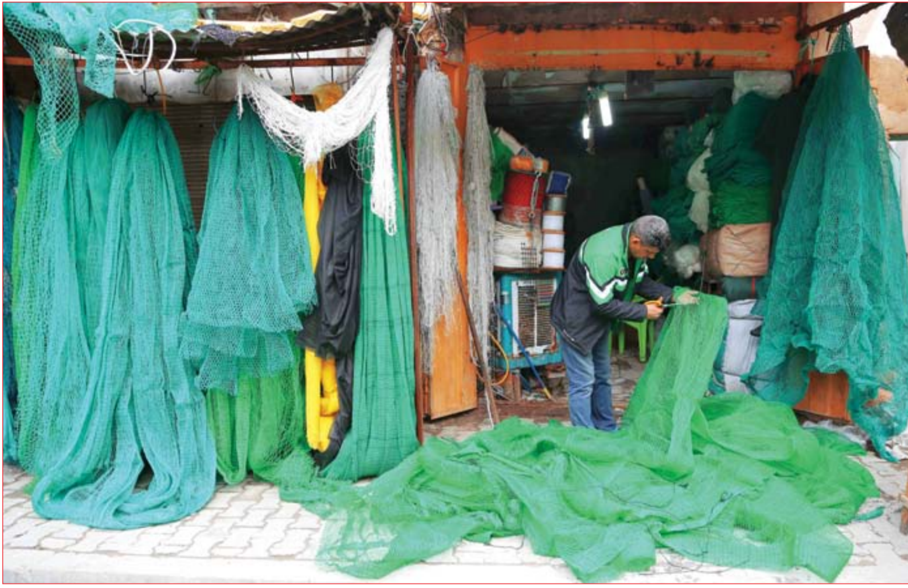
محل بيع شبك صيد الاسماك تشكو الكساد..... عسة: محمود رؤوف

وزار الرئيس العراقي برهم صالح، الأردن، في تشرين الثاني، وفي كانون الاول التقى رئيس الوزراء الأردني عمر الرزاز نظيره العراقي في بغداد. وتناقش بغداد وعمان حدوداً مشتركة مهمة ونقاط تجارية، ووقع البلدان مؤخراً مذكرة تفاهم في مجال الكهرباء