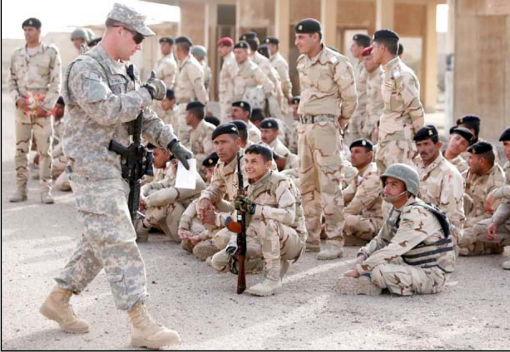
مستشار أمريكي يدرب جنوداً عراقيين.

وتوات بعد ذلك عمليات إدخال الأليات، بمعدل ٢٠ آلية يومياً بأرتال طويلة، فيما شهدت حركة الطيران العسكري منذ ذلك اليوم نشاطاً ملحوظاً، حيث