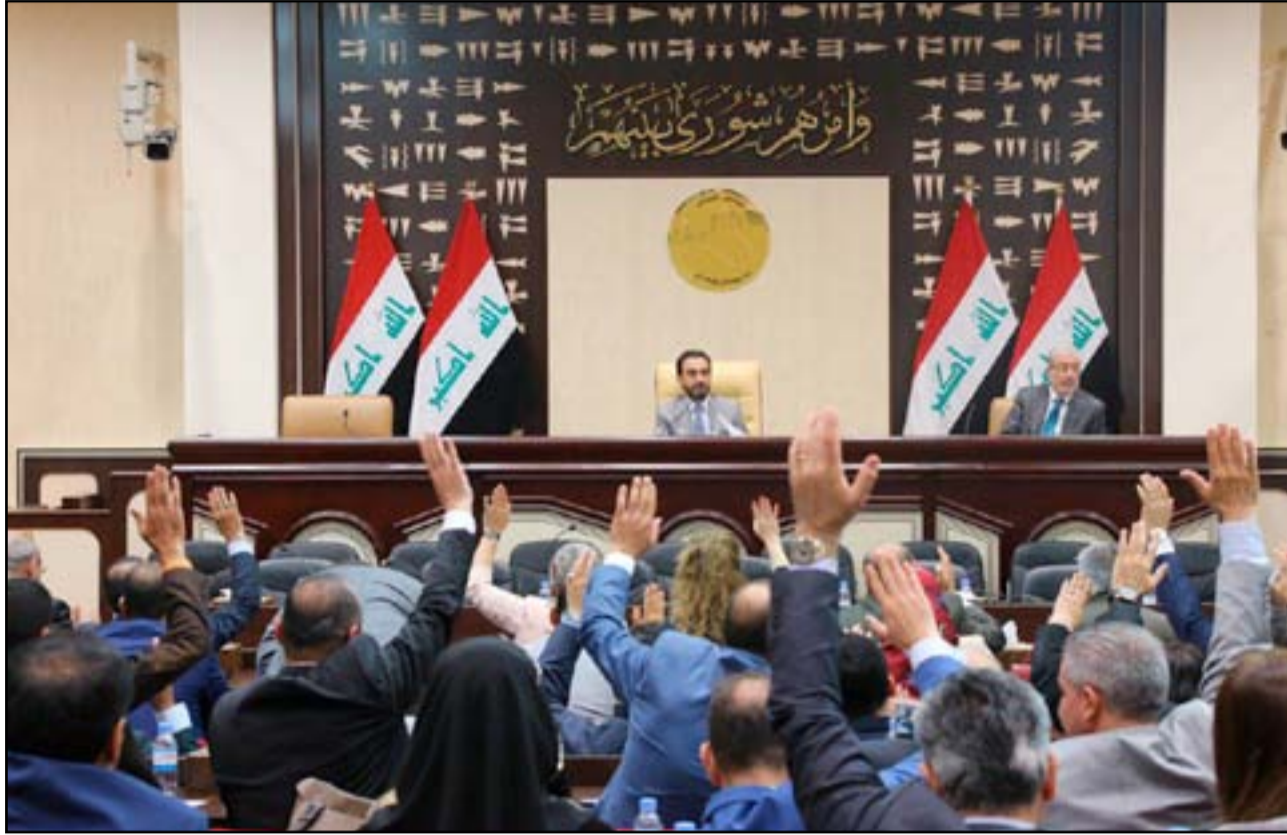
جلسة سابقة لمجلس النواب.. اشراف

ويوضح رئيس كتلة الاتحاد الإسلامي الكردستاني أن "إعادة الصياغات تتضمن إجراء المناقشات في أبواب صرف الموازنة من وزارة إلى أخرى بما يضمن التخفيض، معتقداً أن "المالية النيابية تحتاج إلى فترة أسبوع تقريباً لانتهاء من إعداد قانون الموازنة".