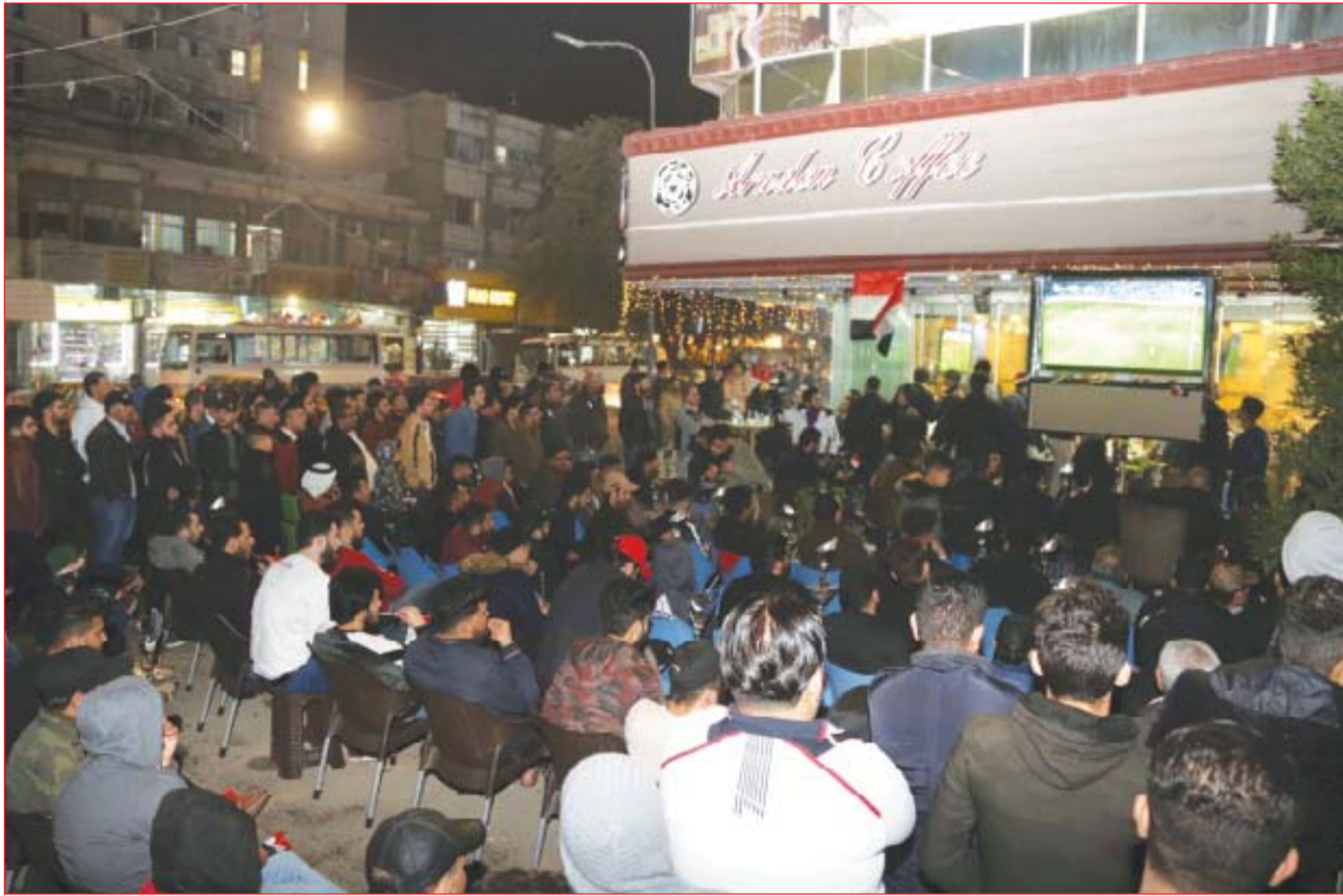
مقامي بغداد تخص بمشجعي المنتخب العراقي..... عدسة: محمود رؤوف