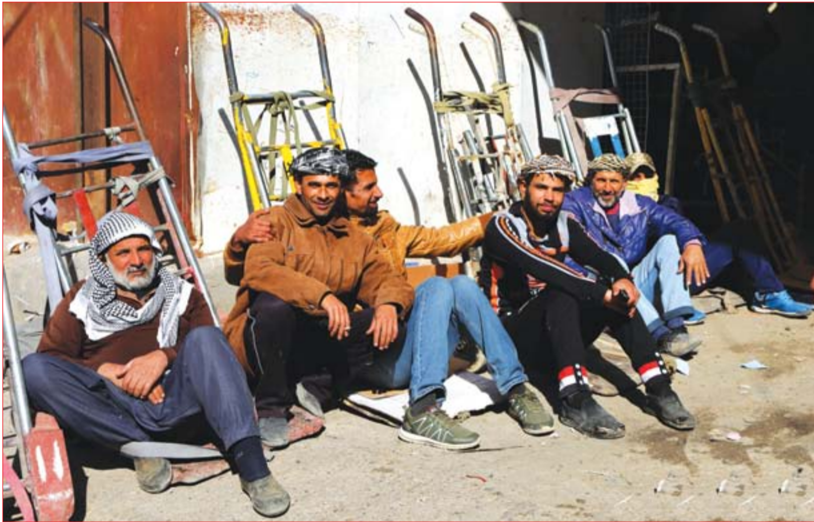
عمال يشكون تقادم البطالة ..... عسة: محمود رؤوف