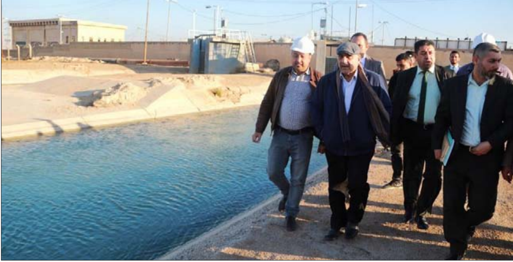
عبد المهدي يتفقد مشاريع في البصرة

وقال عبد المهدي بعد تفقده عدداً من المشاريع الخدمية في البصرة انه "إذا استطعنا أن نحرك نصف المشاريع المتلكئة فالعراق بخير". وكشف علي الفارس أن هناك ٣٧٠ مشروعاً متلكئاً في البصرة من عام ٢٠١٤ والسنوات اللاحقة، بنسب إنجاز متفاوتة. في المقابل قال كاظم السهلاني إن سكان البصرة "لم يجدوا حتى الآن خطة واضحة للمحافظة في إدارة المشاريع التي خصصت لها الأموال بتعب المتظاهرين وإصرارهم". وتابع قائلا: "ربما هذه الفوضىّة مقصودة حتى لا نستطيع مراقبتهم وكشف فسادهم".