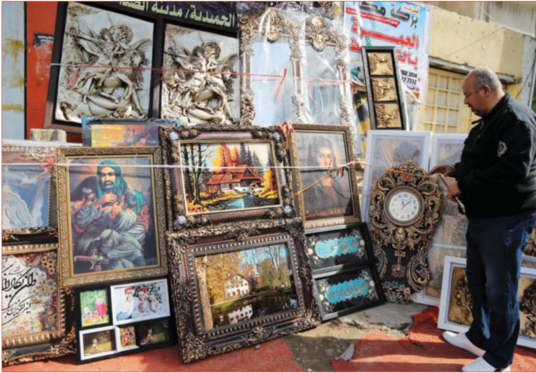
محل لبيع اللوحات وسط بغداد ..... عدسة: محمود رؤوف