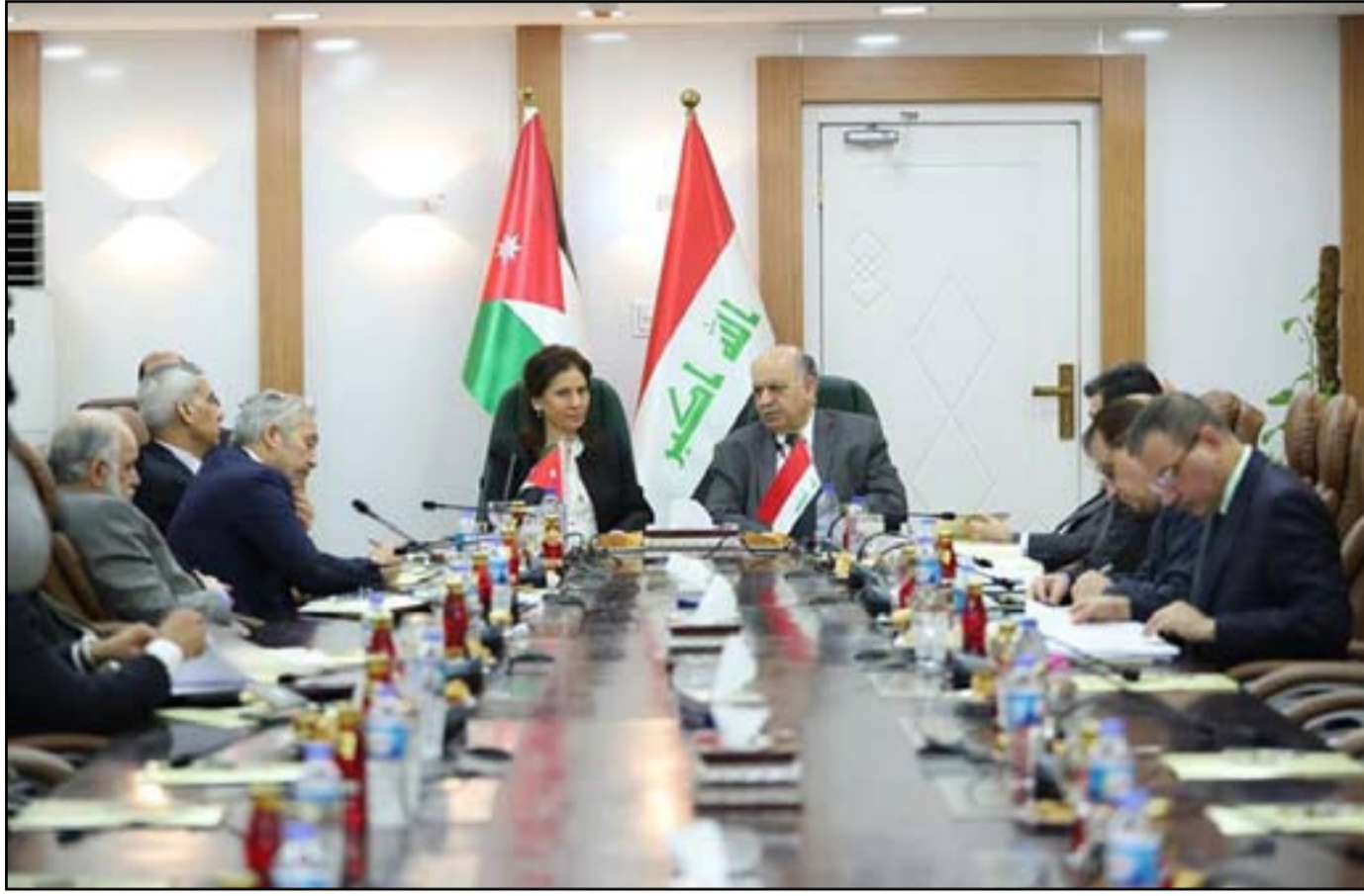
بغداد / وائل نعمة

لجنة الطاقة البرلمانية تقر استضافة وزير النفط رغم تمتعها بالعطلة التشريعية