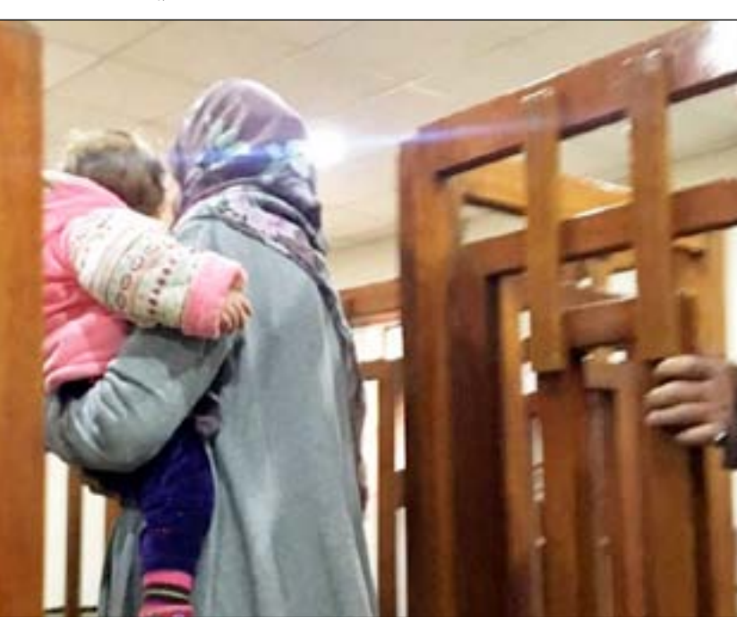
داعشية روسية خلال التحقيق

كشف عضو مفوضية حقوق الإنسان علي البياتي، أمس الأربعاء، عن إحصائية تضمنت عدد النساء والأطفال الروس في سجون البلاد. وبين البياتي في تصريح صحفي أن نحو 70 امرأة، و124 طفلا من مواطني روسيا في سجون العراق بتهمة الانتماء إلى تنظيم "داعش" الإرهابي.