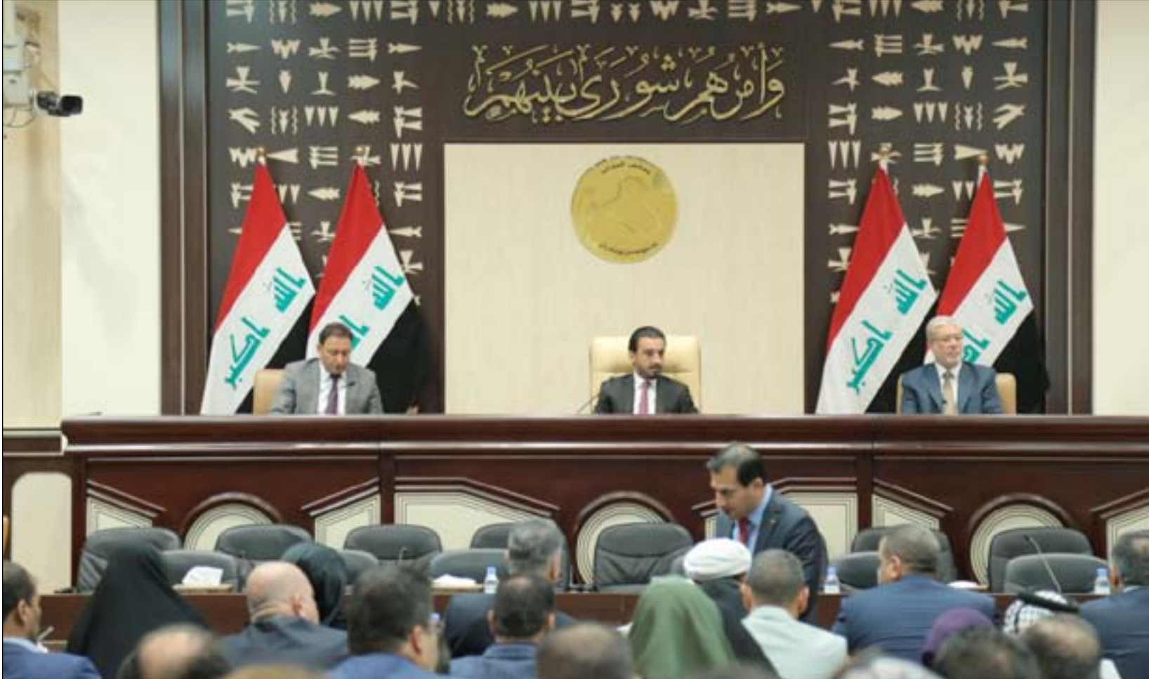
جلسة سابقة لمجلس النواب...