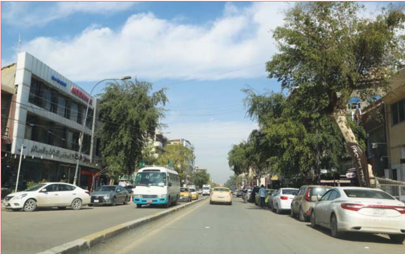
الحركة تعود الى الكراة بعد يومين من افتتاح شوارعها..... عسة: محمود رؤوف

□ بغداد / محمد صباح يقول قبدي في تحالف الإصلاح إن كتلة سائرون طالبت بـ 18% من الدرجات الخاصة والمواقع الأمنية والعسكرية بالتزامن مع بدء تحرك سياسي لإنهاء ملف التعيين بالوكالة في هذه المواقع. في المقابل تؤكد أطراف برلمانية أن حزب الدعوة يسيطر الآن على ما يقارب 80% من مجموع هذه المواقع والمناصب، وهو أمر تريد الكتل السياسية إنهاءه بعد تراجع مقاعد حزب الدعوة في البرلمان. وما يستدعي الانتباه هو المساعي