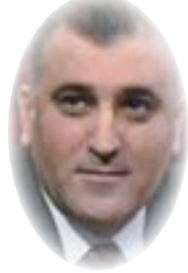
عدالت عبدالله ×

البلدان التي شهدت هذه الازل السياسية فضلاً عن تدهورها وتقهقرها إقتصادياً كما هو الحال في كل من تونس و مصر و ليبيا و اليمن و سوريا و من قبلهم العراق، مما أدى كل ذلك، في النهاية، الى تفشي ظواهر مجتمعية خطيرة ربما أسوأها هو ترك بعض الأجيال للمدارس والمعاهد والجامعات لأسباب أمنية أو معيشية، تماماً مثل ما هو قائم حالياً في كل تلك الدول فضلاً عن فلسطين وأماكن أخرى في منطقتنا، وخاصة بسبب الحروب والصراعات السياسية الداخلية والفتن والإرهاب والفساد وتدني المستوى المعيشي للمواطنين. بمعنى آخر، إذا كانت - كما يقال - التنمية البشرية مبنية في المقام الأول على إتاحة الفرصة للمواطن بأن يعيش نوع الحياة الذي يختارها ومزاولة العمل المناسب لهم وعلى تزويدهم بالأدوات المناسبة والفرص المواتية للوصول إلى تلك الخيارات، فإن مجمل هذه الفرص باتت اليوم شبه معدومة، أو أنها ليست بمستوى الطموح أو ما نتطلع إليها شعوب هذه الدول، و مرد ذلك الحالة الإستثنائية التي تواجهها هذه الدول والمراحل الإنتقالية التي تمر بها والتي لها - دون شك - مخاضها وأزماتها الخاصة بها، وعليه لا يمكن التوقع بسهولة أن يطرأ أي جديد على أوضاع هذه الدول في الأجل القريب القادم، الأمر الذي سينعكس سلباً على برامج التعليم أيضاً، أو إصلاح هذا الحقل أو تغييره وتحديثه بهدف تحقيق الشروط اللازمة للتنمية البشرية. • كاتب و أكاديمي - كرستان العراق