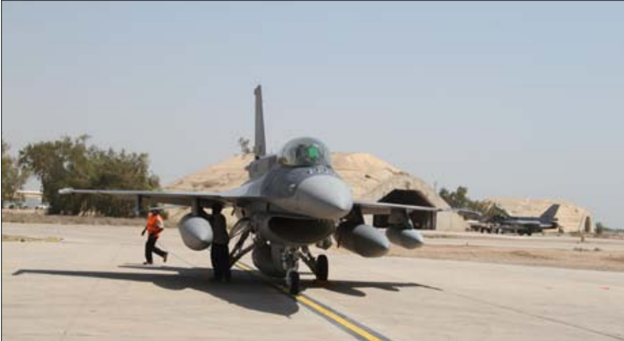
مقاتلة عراقية في قاعدة بلد الجوية.. ارشيف

وتدير شركة، ساليبورت منشآت عسكرية في مناطق مختلفة من الشرق الاوسط وآسيا الوسطى ولكن جوهره نجاح الشركة تقع في قاعدة بلد الجوية، وهي قاعدة شمال بغداد تضم طائرات أف-١٦ يتم تمويلها من الحكومة الاميركية. في كانون الثاني عام ٢٠١٤ حصلت شركة ساليبورت على عقد من القوة الجوية لتوفير خدمات دعم وتدريب وحماية أمنية للقاعدة وبضمنها خدمات ذات ضرورة مثل توفير طعام وطاقة كهربائية في القاعدة. تلقت شركة ساليبورت مبلغاً قدره ١,١ مليار دولار مقابل خدماتها في قاعدة بلد. وتتوقع أن تكسب ٨٠٠