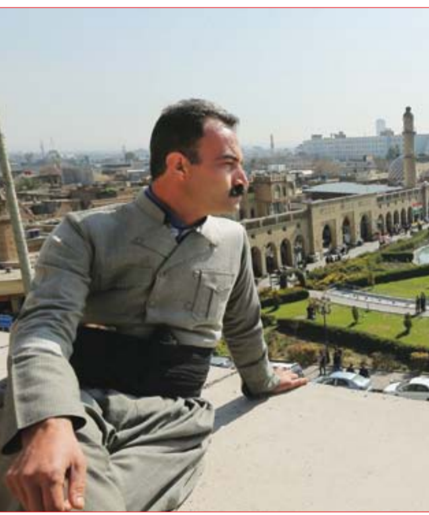
تحسن الطقس ينعش الحركة السياحية في أربيل..... عسدة: محمود رؤوف