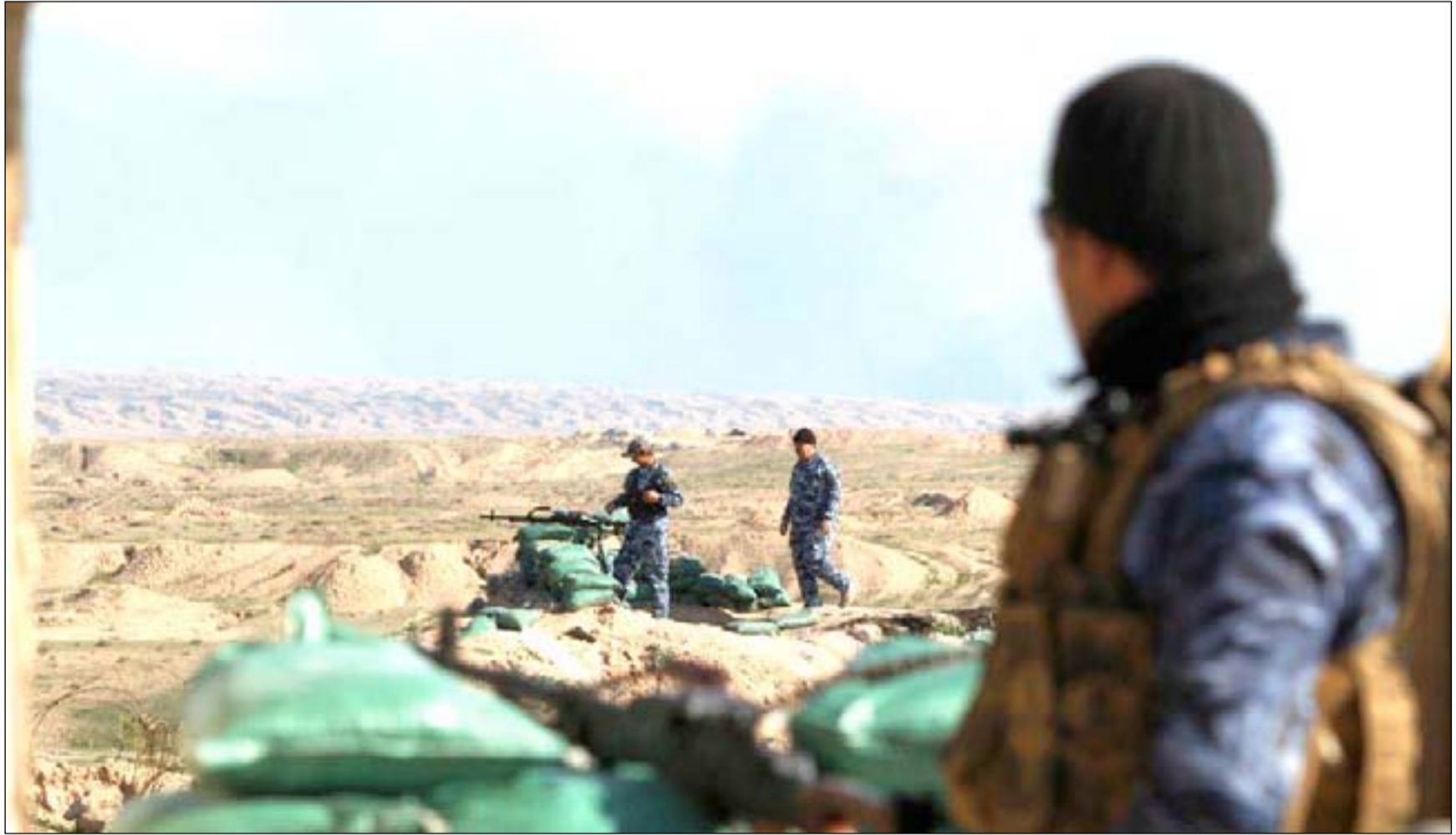
مقاتلو الشرطة الاتحادية قرب قرية النمل.

وخلال الهجوم أفرغ السكان كل مخازن العتاد التي يملكونها، حيث لا يملك أفضلهم سوى بندقية نوع "كلاشينكوف" ومخزن فيه 30 رصاصة، ويقول المسؤول المحلي: "يجب ان تكون هناك قوات إضافية وبدونها فإن الهجمات ستتكرر". وما يزال هناك نحو 5 آلاف شرطي مفصول في المحافظة ولم يعد إلى عمله حتى الآن، حيث تسبب نقص الشرطة في إغلاق عدة مراكز بالمحافظة، وفوج في الشرقاط كان قريباً من القرية التي تعرضت للهجوم الأخير، كما ألغت المحافظة عدداً من نقاط التفتيش بسبب عدم وجود عناصر أمنية كافية. ويعتقد عضو مجلس محافظة صلاح الدين، أنه لا يمكن السيطرة على مكحول، مالم يتم تنفيذ ما وعدت به الحكومة قبل أكثر من عام، وهو "تطهير المنطقة بشكل تام ومسكها بقوات كافية".