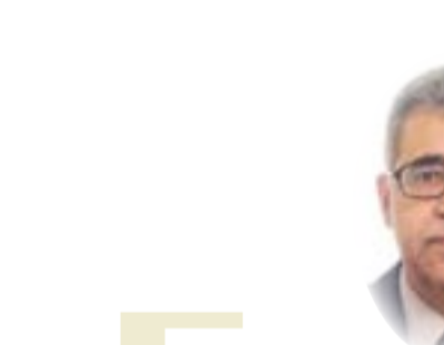
د. فالح الجمراني

القوات الأميركية على الصمود بتواجدها في العراق. معبدا إلى الأذهان إلى أنه ومنذ عام 2014 ، لم يرق أي من ساسة ما بعد 2003 في العراق، باستثناء ، ربما، السيد مقتدى الصدر، بمعالجة هذا الموضوع بأبعد من البيانات السياسية ذات الطبيعة الشعبية. وهذه المرة، لا ينوي "سائرون" الاكتفاء بالبيانات العمومية، وأنه مصمم بحزم التعامل مع الوجود الأمريكي في البلاد. وحسب تقديرات التقرير إن هذا بالطبع ، لا يعني أن الولايات المتحدة ستستسلم لضغوط البرلمان المحلي ، أو سوف تبدأ على الفور الصدامات المباشرة مع الميليشيات الموالية لها، ولكن "سائرون" يرى إنه وفي حالات التقاوم المحتملة، من الأفضل موقع الميليشيات في حال لو إن وزير الداخلية يدعمها ويتخذ موقفاً معادياً للغاية لأمريكا. وفي نهاية المطاف إن "سائرون" يريد "جس النبط" ، لا البدء في حرب لتحرير العراق من المحتلين ، فالوقت لم يحن بعد لهذا الأمر ، ويتحسب "سائرون" أيضاً لدعم القوى التي تفت وراء الميليشيا الشيعية التي أعلنت مراراً استعدادها لبدء نزاع مسلح مع الأميركيين، لتعيين فالح فياض لهذا المنصب الحساس.