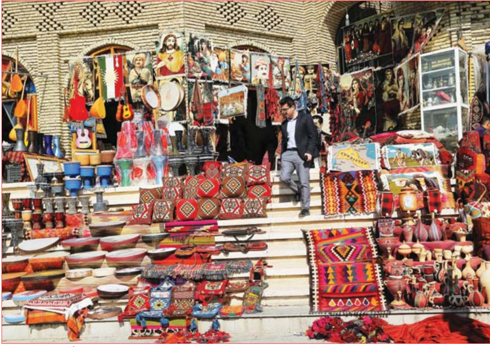
بازار للسجاد في قلعة أربيل