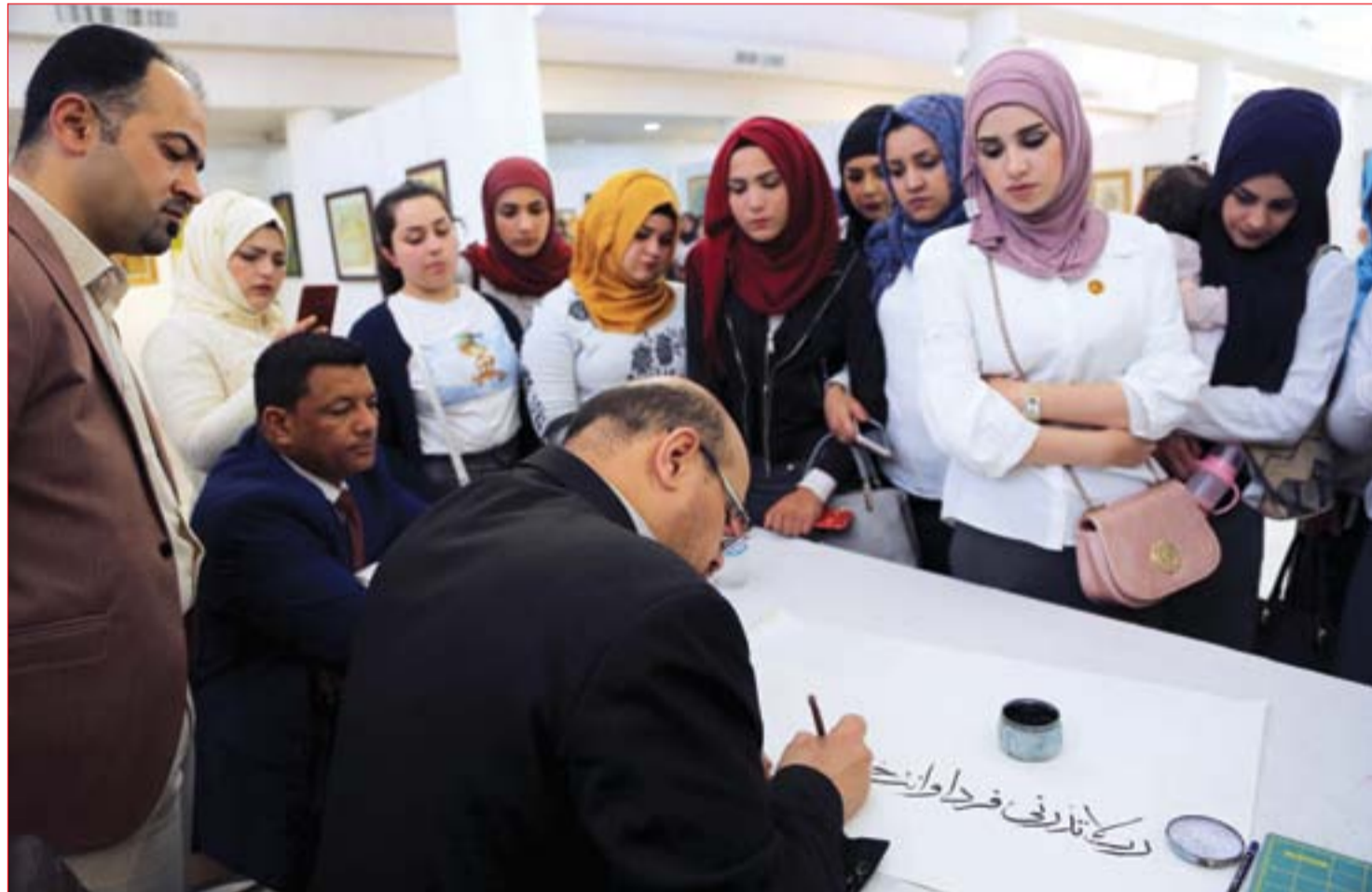
الفتيات أبرز رواد ملتقى الخطاطين الذي اختتم أعماله أمس في بغداد.....