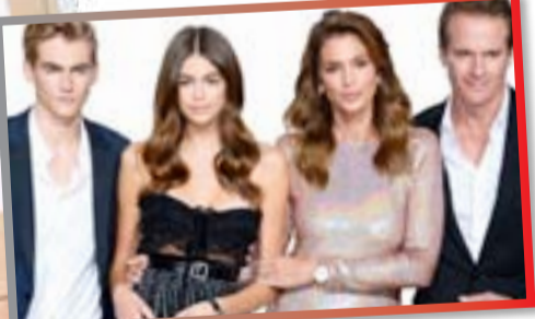
صورهما في ٢٠١٩ يكاد لا يصدق، لا شيء تغير في ملامحهما سوى بعض آثار تغير السن والنمو. انتقلت كل من شيفر وكروفورد إلى زمن ترسيخ الاسم باعتباره علامة عالمية مسجلة شديدة الثقة، وعلى رغم تأثير "السوشيل ميديا" في كل أنحاء العالم، إلا أنهما مازالتا محافظتين على هوية نجوميتهما باعتبارهما عارضتي أزياء قويتين الاسم والمكانة.

في السبعينيات والثمانينيات تصدرت كل من سيندي كروفورد (من مواليد ١٩٦٦)، والألمانية كلوديا شيفر (من مواليد ١٩٧٠)، اهتمام الجمهور العالمي، إذ وقتها على أكبر وأهم منصات الأزياء العالمية، وباتت حياتهما مشار فضول الجماهير في مختلف أنحاء العالم. ومع مرور الزمن كان هناك رهان كبير على ظهور أسماء جديدة في الساحة من شأنها كسر قاعدة احتكار أسماء معينة، إلا أن هاتين الفتاتين تربعتا في ذهن الجمهور حتى اليوم. ومن يتابع حياتهما عن قرب سيعرف أن النجومية تعدت مرحلة الجسد النحيل والساقين النحيلتين، وإن الأمر كما يبدو أبعد من ذلك بكثير. ظلت كل منهما محافظة على نظام غذائي وجسدي منذ انطلاقتها وحتى اليوم، وساهم اشتراكهما في هواية الرياضة، وبناء أجسام تلققت منهما أهمية العناية في الرشاقة والغذاء الصحي، فمن يرى