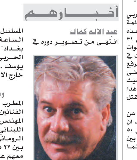
عبد الله كمال انتهى من تصوير دوره في

وقد اكد الفنان سمير صبري ان "سعاد حسني قتلت بدافع السرقة" معددا اسباباً كثيرة لتأكيد منها "اختفاء مبلغ ٤٥ الف جنيه استرليني كانت في حوزة الفنانة الراحلة". ورغم ان حديث الفنان كان يتجه الى اتهام صديقة الفنانة نادية يسري التي كانت سعاد حسني تقيم معها في شقتها بمعرفة القاتل او قيامها هي نفسها بالسرقة الا انه نضى لوكالة فرانس برس ان "يكون حديته يعني توجيه اتهام بالقتل او السرقة ليسري". وتفرد الحامي والفنان عاصم قنديل بالإشارة الى "امكانية وجود اسباب سياسية وراء مقتل السندريلا خصوصا بعدما تسرب خبر كتابتها لذكراتها التي احتفت ولم يعثر عليها". وقال قنديل "ان قائد الحرس الجمهوري السابق اللواء الليثي ناصر وعالم النزة المصري يحيى المشد قتلا بنفس الطريقة في العمارة نفسها بما حمله موتهما في حينه من تساؤلات.. ما يؤكد انه قد يكون وراء الاكمة ما وراءها ونحن من حقنا ان نعرف الحقيقة في حوادث مقتل هؤلاء المشاهير بنفس الطريقة وفي نفس العمارة". وكان الامين العام للاتحاد العربي لمنظمات المجتمع المدني اوضح في كلمة القاها خلال الاجتماع على ان هذه "العمارة شهدت مقتل اكثر من ٣١ شخصا خلال اقل من عشر سنوات واطلق عليها اسم عمارة الموت وامرت في حينها السلطات البريطانية برفع الحاجز السلكي الصلب المقام على الشرفات الى ارتفاع ١٧٥ سم بحيث يصعب وقوع اي شخص من فوقها وهذا يشير الى الاحتمالات الكبيرة لمقتل الفنانة الراحلة. يذكر ان الفنانة سعاد حسني رحلت عن عالمنا في ٢١ يونيو/حزيران ٢٠٠١ بعد ان اثر الحياة الفنية العربية باكثر من ٥٠ فيلماً بينها ثمانية افلام اعتبرت من بين افضل مئة فيلم في تاريخ السينما المصرية.