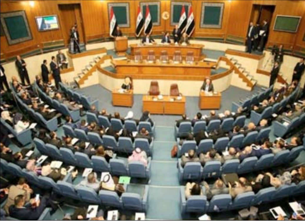
جلسة مجلس النواب.

وكانت (المدى) قد كشفت الأسبوع الماضي أن المفاوضات القائمة بين تحالفى سائرون والفتح حسمت