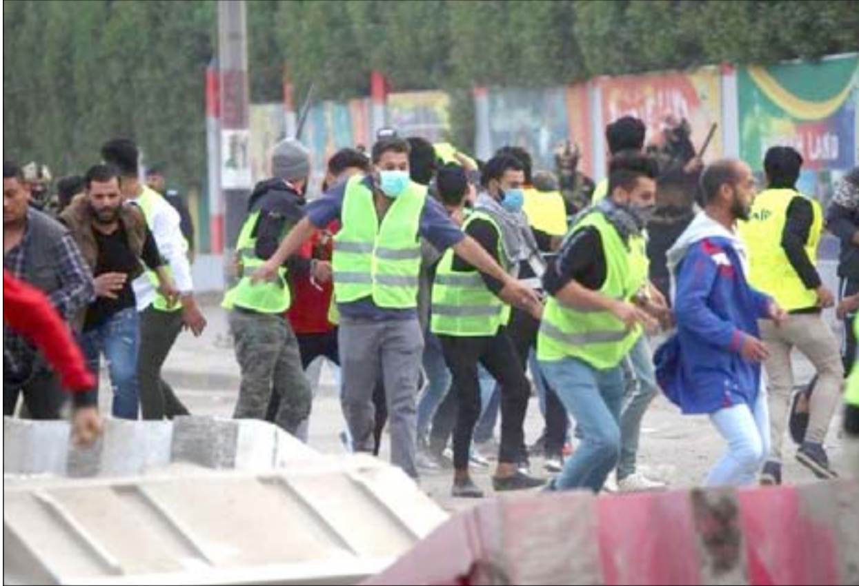
محتجون في البصرة الصيف الماضي

المحافظة. يقول وهب: "ما زالت المبالغ في أرصدة البنوك (...) والمشاريع التي تم تنفيذها لا تكفي لسد حاجة منطقة واحدة". وخصص مجلس المحافظة قبل أشهر ٢٥ دونماً في قضاء يطل على شط العرب لإنشاء محطة تحلية، لكن المجلس يقول إن المحطة التي نفذت في أبو الخصيب، نضج يومياً ٣ آلاف لتر مكعب، وهو لا يكفي لسد حاجة سكان القضاء. وكان العبداني، وهو نائب فائز في الانتخابات التشريعية الأخيرة لكنه يرفض حتى الآن الجلوس على كرسيه في البرلمان، قد حصل على استثناءات من حكومي العبادي وبعده عبد المهدي، للفرز بواقع البصرة واجتياز الروتين.