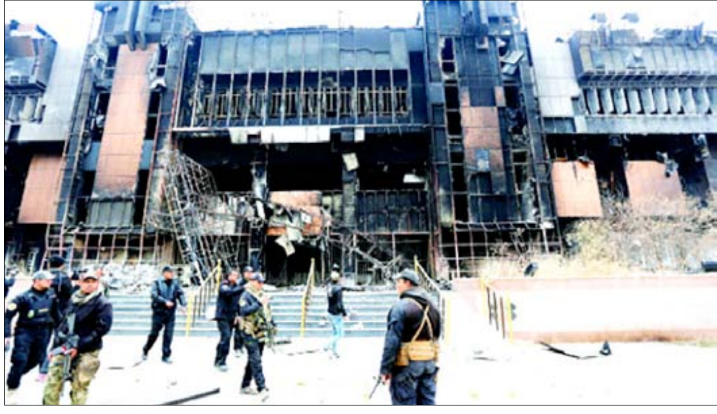
احد مختبرات داعش بعد احراقه في جامعة الموصل