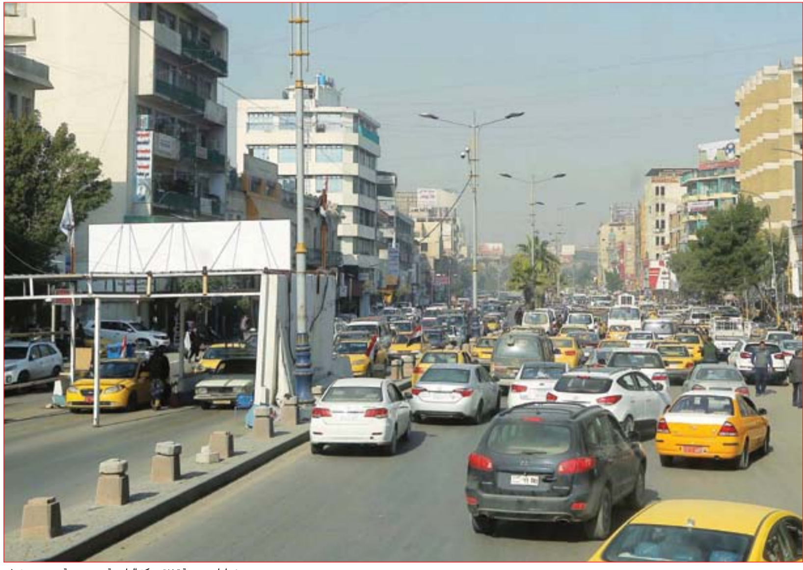
زحامات مرورية تخنق مركز العاصمة.....