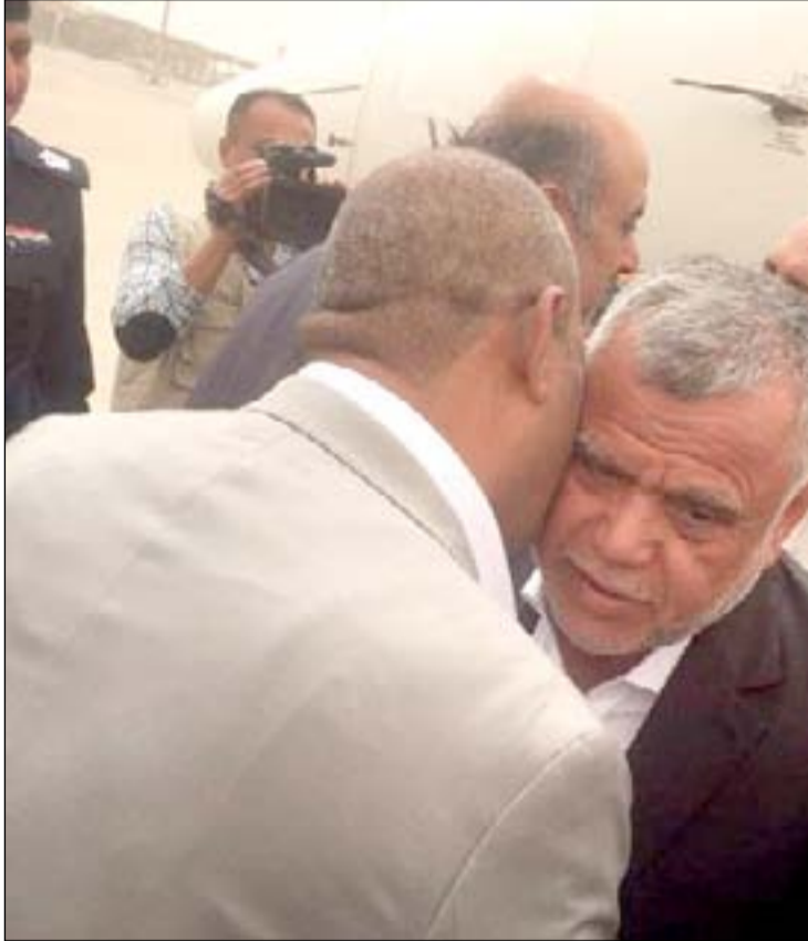
العامري في مطار البصرة ... أرشيف

من أحزاب وجهات شعبية بالغاء مجالس المحافظات، باعتبارها حلقة زائدة وتكليف الدولة ٢ مليار دينار سنوياً. ويرحب البصريون بـ "العامري" أو أي شخصية أخرى حتى لو كانت من خارج المحافظة، مادامها ستقدم خدمات للمدينة، لكن المهمة قد تكون شاقة جداً لـ "المحارب القديم" إذ ليس أمامه سوى أقل من ٣ أشهر لإقناع سكان الجنوب الغاضبين أن يؤجلوا تظاهرات هذا الصيف. ويتوقع ناشطون في البصرة، أن احتجاجات ستطلق من حزيران المقبل، وأنها ستمتد إلى بغداد، وسيسقط خلالها وزراء وربما الحكومة بأكملها. ويقترح بعض النشطاء أن تتجه بغداد للقبول بفكرة