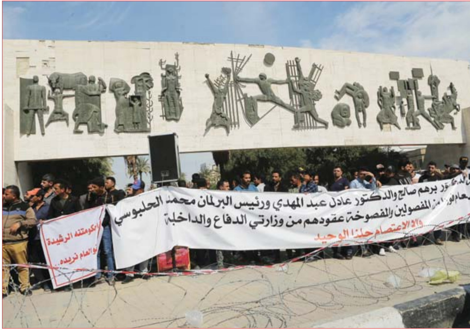
متسيون مفسوخة عقودهم يعترضون في ساحة التحرير ..... عدسة: محمود رؤوف