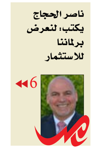
ناصر الحجاج يكتب: نعرض برلماننا للاستثمار

أعلنت هيئة الأنواء الجوية، أمس الأربعاء، عن قدوم منخفض جوي يسبب تساقط أمطار متوسطة وخفيفة في المناطق الشمالية والوسطى من البلاد. وقال رئيس منبئيين جويين أقدم محمود عبد اللطيف في حديث صحفي إن "منخفضاً جويًا ناتجاً من اندماج منخفضين جويين الأول من البحر المتوسط والثاني ضعيف من البحر الأحمر يسبب تساقط أمطار متوسطة إلى غزيرة في شمال البلاد وخفيفة إلى متوسطة في المنطقة الوسطى