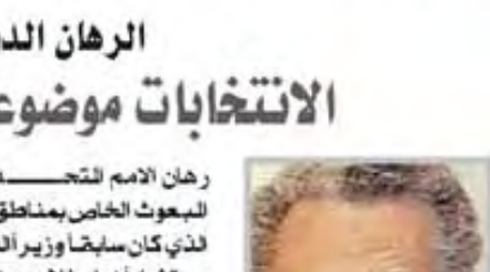
الرهان الدولي يتركز على الابراهيمي

رهان الامم المتحدة والادارة الأمريكية تركز على البحوث الخاص بمناطق الزمات الاخضر الابراهيمي، الذي كان سابقاً وزير للخارجية لجزائرية ويعمل الآن مستشاراً اعلى للامم العام للامم المتحدة، ومستشاره لخاص بالشؤون العربية. الابراهيمي معروف على النطاق الدولي باعتباره رجل الزمات الذي لعب دوراً هاماً أيام الحرب الأهلية اللبنانية، ودخل القضية العراقية خلال التسعينات وقد فرغ توأم من مهمة دامت سنتين في أفغانستان. وتقوم طريقته على زيارات مكوكية بين الفراء الذين يصعب اللقاء بينهم لتقريب