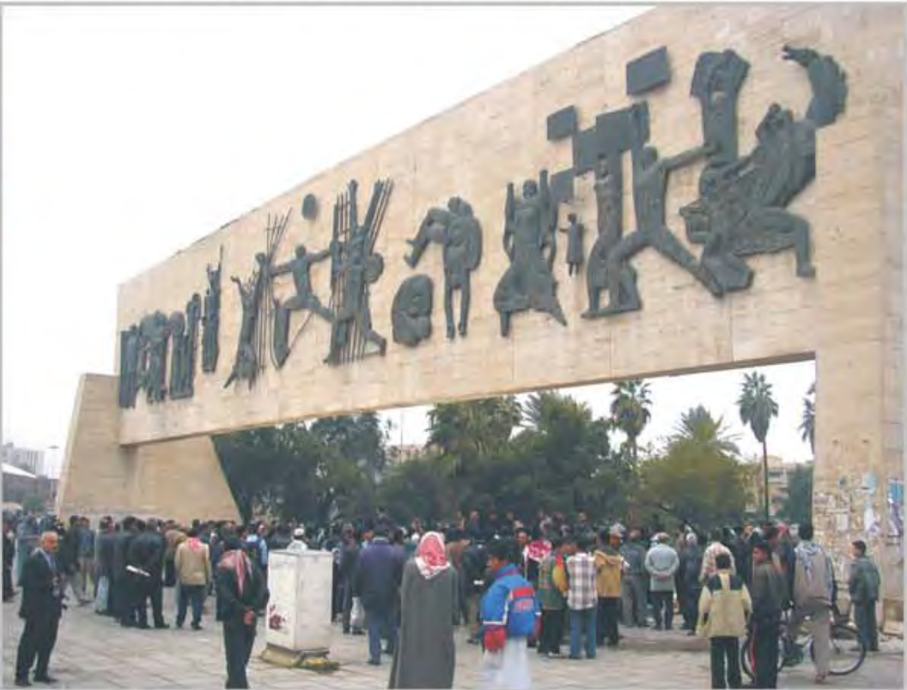
جملة تنظيف وتشجير ساحة التحرير ونصب الحرية في الذكرى 43 لوفاة الفنان الرائد جواد سليم.

البريطانيون يرون الانتخابات المبكرة أمراً سلباً