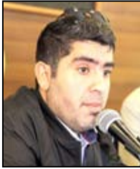
قطنان الفرج الله