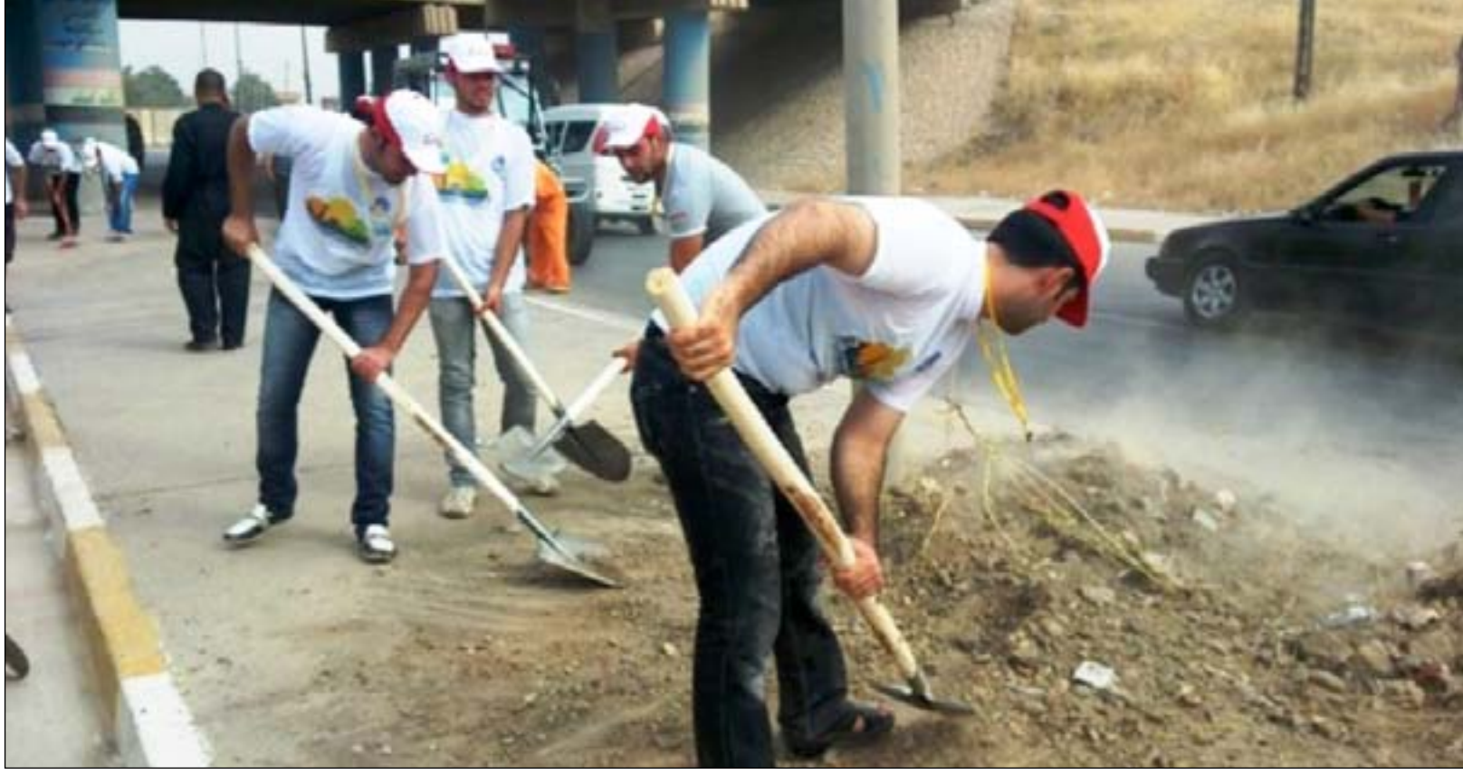
متطوعون خلال حملة لتنظيف الموصل أسس

لنعد عنها أيدي الإثم والفساد والظلم والاختطاف . وتقول الجبوري انه لا يمكن حل مشكلة الفساد في الموصل بإقالة المحافظ، وإن "الصدر" تصله تلك المعلومات بالتأكيد. ونضيف النائية إن مشاكل نينوى لا يمكن أن تحل عبر "خلية أزمة بدون صلاحيات واضحة"، مشيراً إلى أنه "غير معروف فيما لو كانت خلية الأزمة تملك صلاحيات دفع رواتب أو التوقيع على الصكوك". ونخشى الجبوري أن يدفع الفشل المستمر في المحافظة إلى "اقتناع السكان بفكرة الإقليم خصوصاً إن البصرة تضي بهذا الإجراء". وفي شباط الماضي فاجأت مجموعة موصلية تقول بأنها "مستقلة"، الجميع حين أعلنت أنها تمتلك نصف مليون توقيع من أبناء نينوى مؤيدين لإعلان الإقليم، لتعيد انتعاش الفكرة التي طرحت مرتين قبيل ذلك في عامي ٢٠٠٨ و ٢٠١٤ (قبيل ظهور داعش)، ولم تصل إلى مراحل متقدمة.