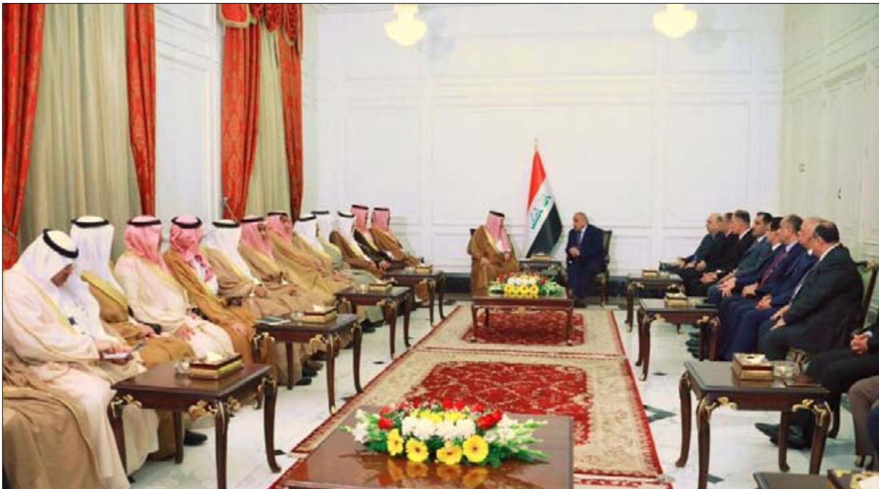
الوفد السعودي خلال لقائه عبد المهدي