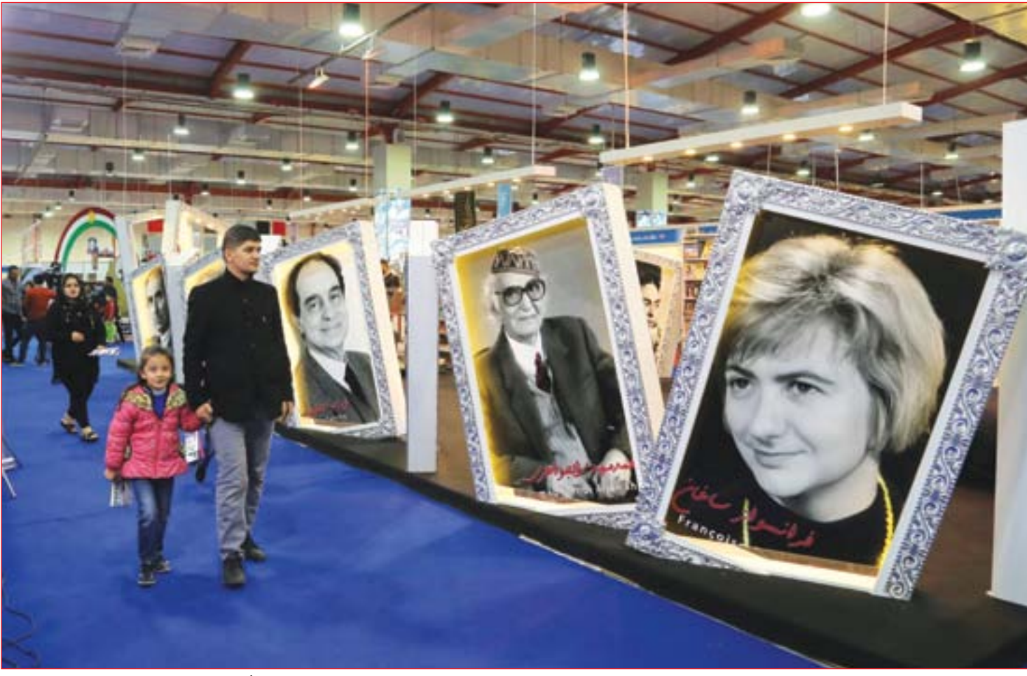
تواصل فعاليات معرض أربيل الدولي للكتاب.....