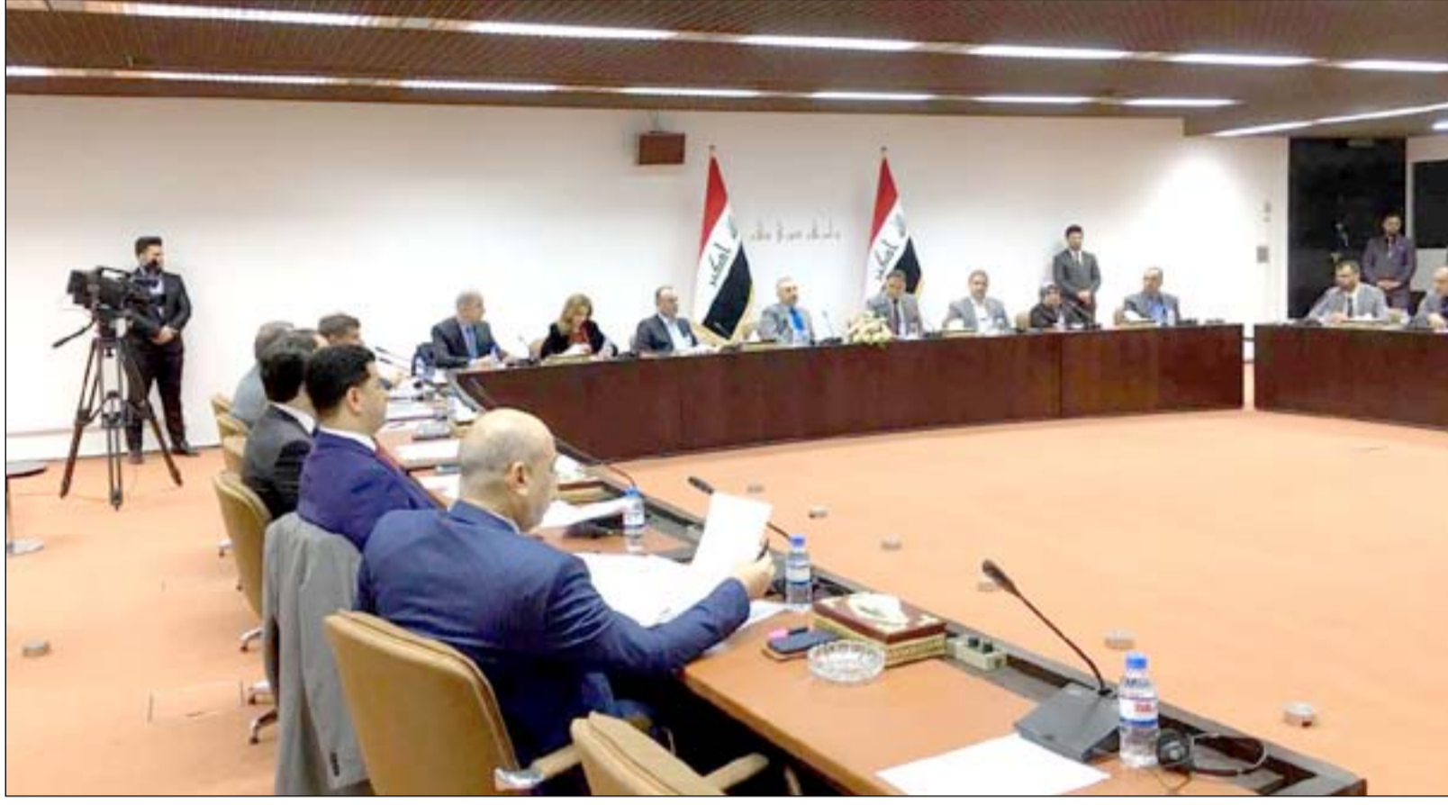
اجتماع بين رئاسة البرلمان ومفوضية الانتخابات.. أرسيف

ويتابع أن "التعديلات قلصت عدد المقاعد ما نسبته ٤٠ إلى ٥٠٪ أي أن العدد الأقصى لكل محافظة من المقاعد سيكون عشرة مقاعد ثم بعد ذلك يحسب لكل مقعد ألف ناخب مقعد واحد"، معتقداً أن "هذا التقليل سيؤثر على المحافظات التي عدد سكانها قليل في إكمال النصاب واتخاذ القرارات".