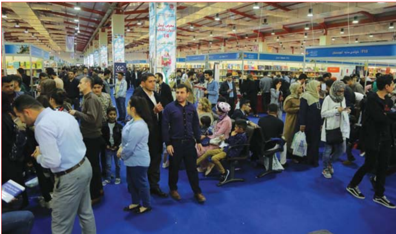
معرض أربيل الدولي للكتاب يحتل بالتضامين ..... عدا: محمود رؤوف