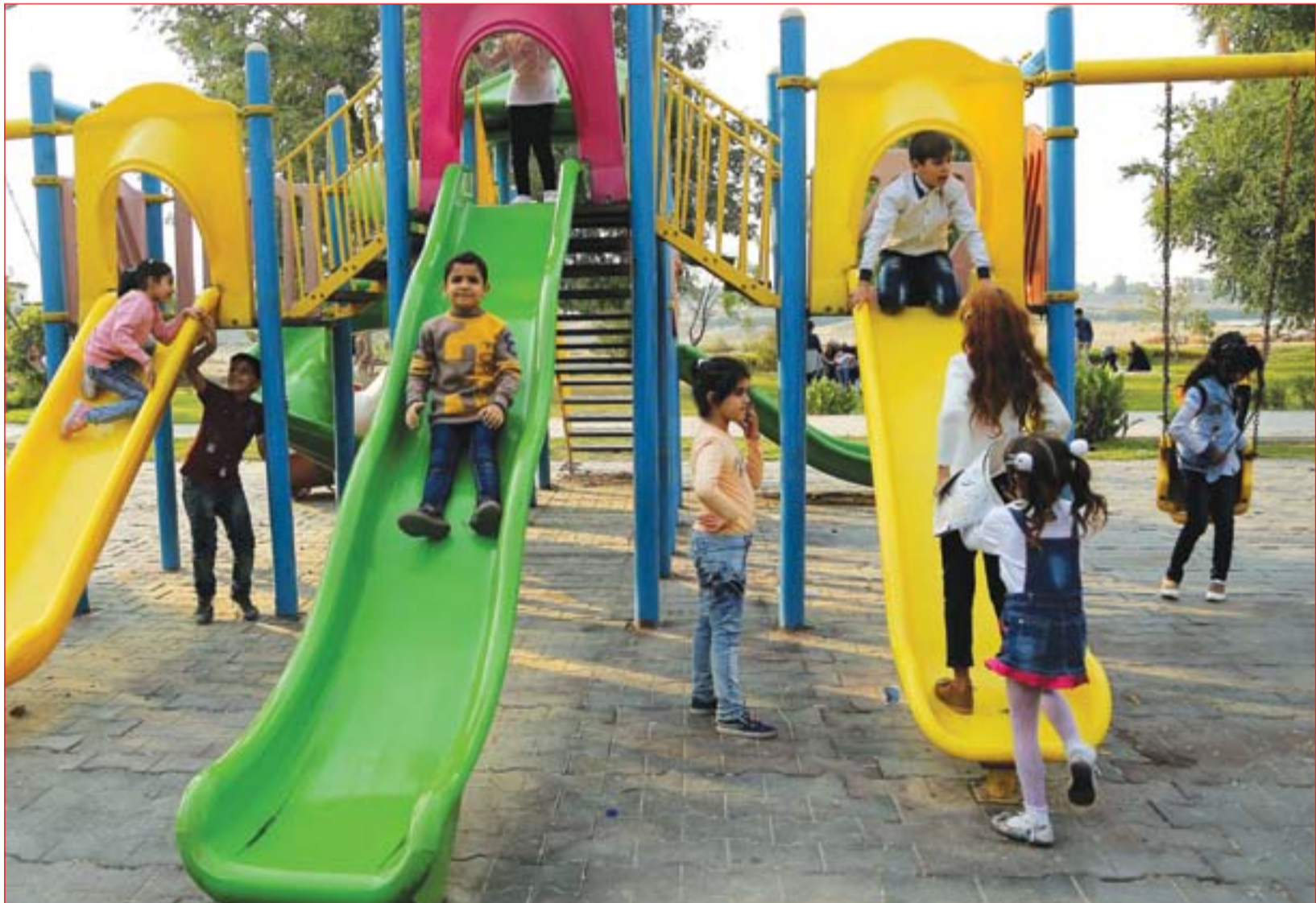
أطفال يلعبون في إحدى حدائق بغداد..... عدسة: محمود رؤوف

5 باريس تحسم نظام قرعة تصفيات مونديال 2022