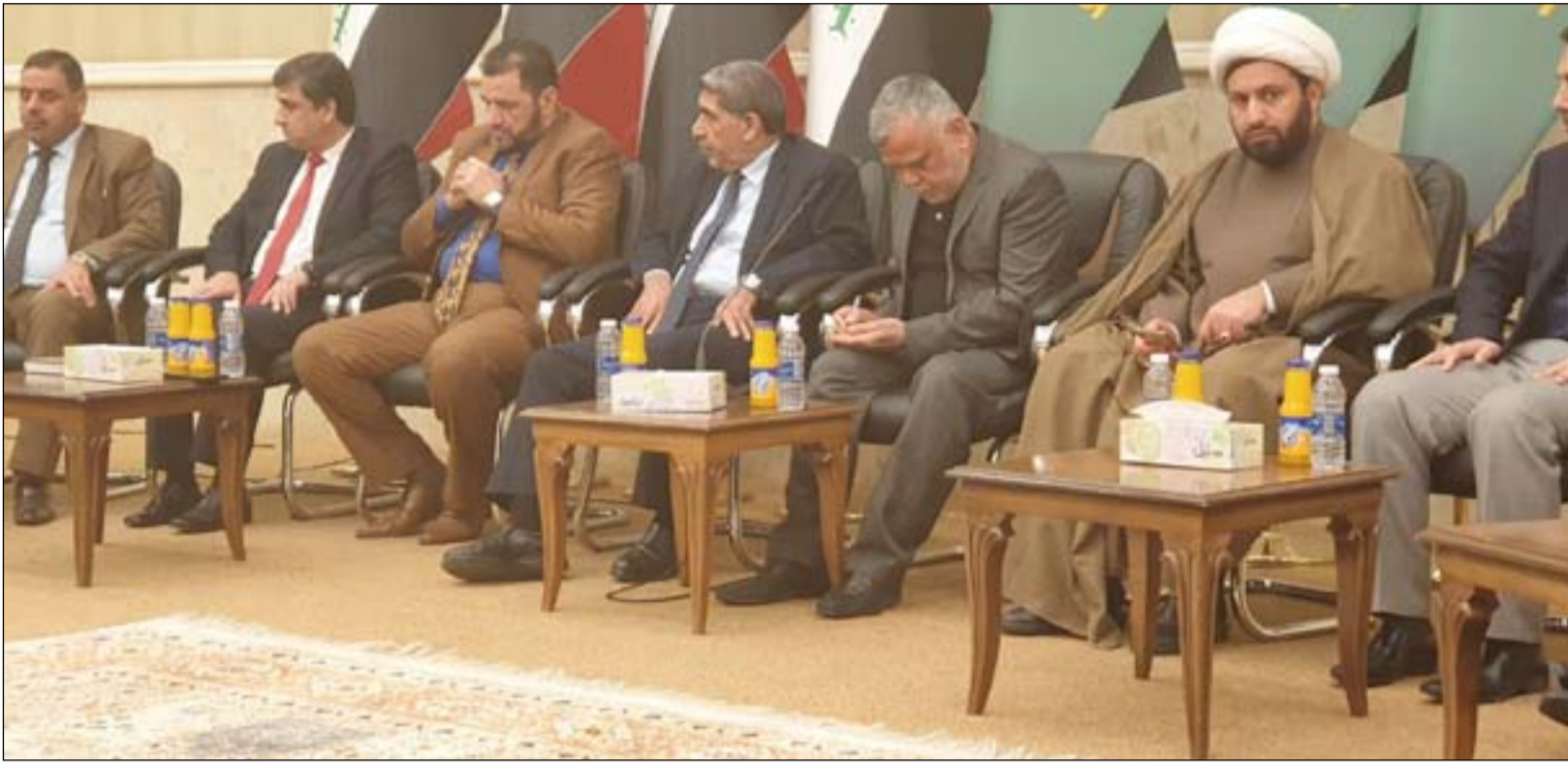
اجتماع سابق بين الحشد وسائرون

حسمت اللقاءات الثنائية بين تحالفي سائرون والفتح أسماء رؤساء اللجان البرلمانية ونوابها والمقررين في اجتماع عقد قبل يومين حيث اتفقا مع باقي المكونات على منح القوى الشيعية رئاسة ثلاث عشرة لجنة برلمانية دائمة و ١٢ لجنة للقوى السنة والكردية مناصفة. وسيقوم تحالفا سائرون والفتح بعملية توزيع رئاسات هذه اللجان على الكتل والأحزاب الشيعية.