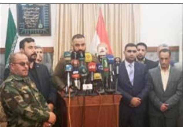
□ بغداد / روبرت ز

قالت مجموعة من فصائل الحشد، مساء السبت، إنها ترفض بشدة قرار الولايات المتحدة بتصنيف الحرس الثوري الإيراني منظمة إرهابية. وأصدرت الجماعات، التي تحظى بدعم وتدريب من طهران، بياناً بهذا الشأن من منزل القنصل العام الإيراني في مدينة النجف. وأعلنت الفصائل تضامنها مع الشعب الإيراني والحرس الثوري الذي قالت إنه ساعد في إنقاذ أربع أو خمس دول من السقوط في أيدي تنظيم داعش. وكان الرئيس الأمريكي دونالد ترامب قد أعلن في الأسبوع الماضي تصنيف الحرس الثوري منظمة إرهابية.