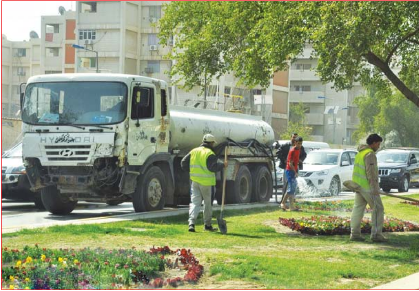
الأمانة تنفذ حملة تأهيل للحدائق بالتزامن مع الربيع ..... عدسة: محمود رؤوف