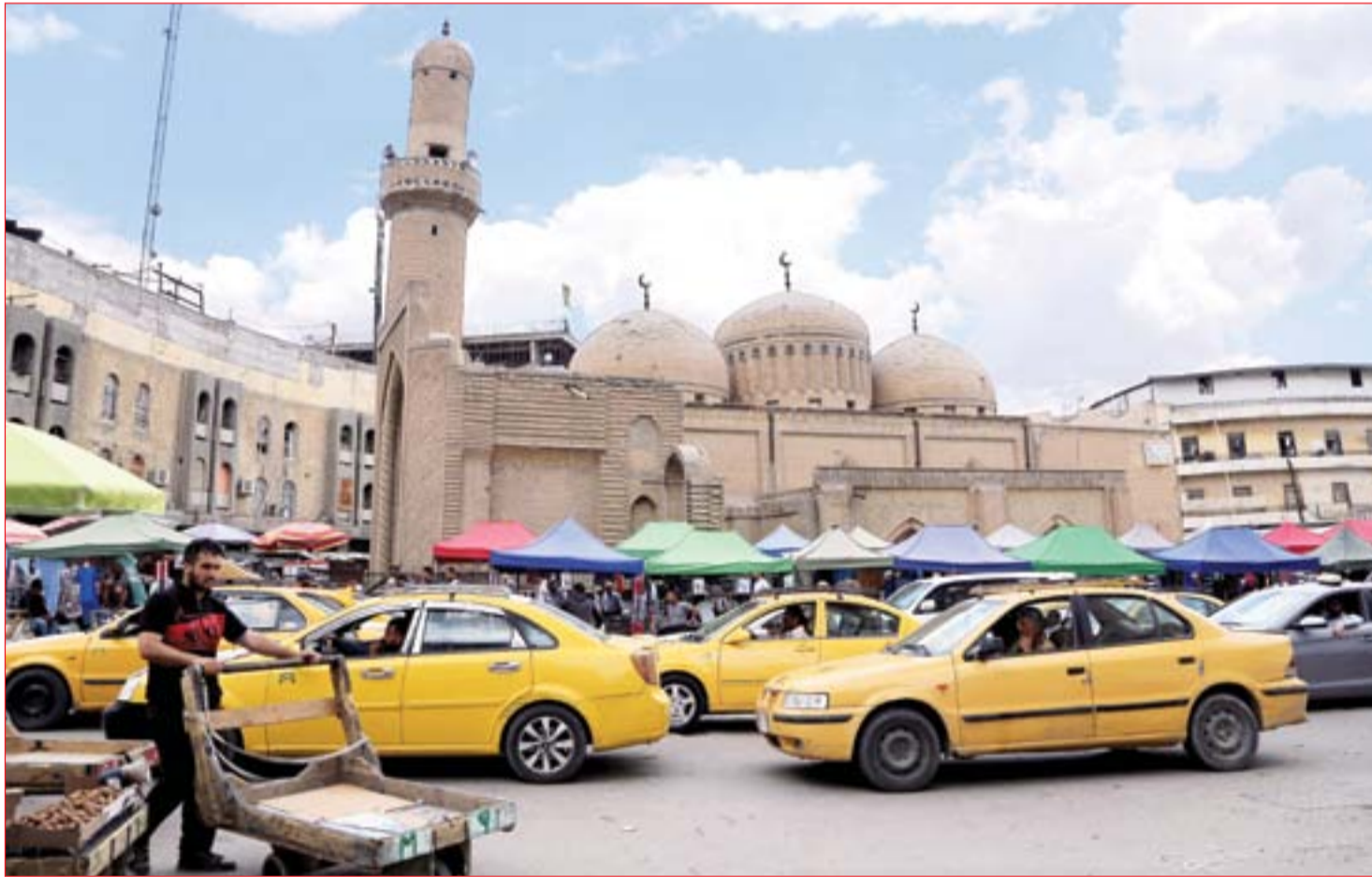
جامع مرجان.. من أشهر مساجد العراق الأثرية القديمة يعاني من الإهمال.....