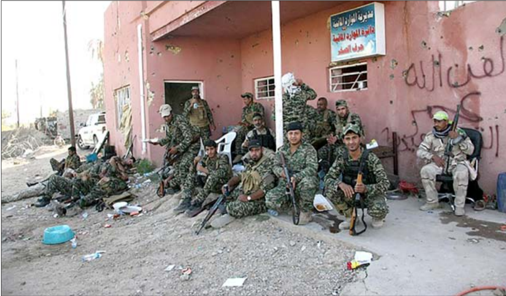
قوة من الحشد في جرف النصر.. أرشيف

ويقول رشيد العزاوي ضمن قائمة النصر التي يرأسها حيدر العبادي، إن هناك مقترحات لإعادة السكان، لكنها مازالت تحت الدراسة. وبلغت العزاوي، التي إن هناك تغييراً في تقبل القوى السياسية للنقاش حول إعادة السكان، وهو أمر كان مرفوضاً قبل 4 سنوات.