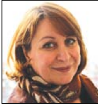
إنعام كجه جي

وكانت الروائية العراقية إنعام كجه جي، قد قالت إنها امتنعت عن حضور حفل توزيع جوائز الجائزة العالمية للرواية العربية البوكر، بسبب التسريبات التي تمت حول اسم الفائز بالدورة الحالية للجائزة لعام 2019. وقالت "كجه جي" في تدوينة لها على موقع التواصل الاجتماعي "فيس بوك" الآن يبدأ في أبو ظبي حفل الإعلان عن الفائز بجائزة البوكر للرواية العربية. وجدت أن من المناسبات الامتناع عن حضور الحفل بسبب التسريبات التي سبقته وتضرر بهذه الجائزة". وتابعت: "لا يمكنني المشاركة في ما نسميه باللهجة العراقية (عرس واوية)، مبارك للعزيزة هدى بركات فوزها بالبوكر، وهي تستحق ما هو أفضل من هذه الجائزة التي كانت على حق يوم دعتني لمقاطعها".