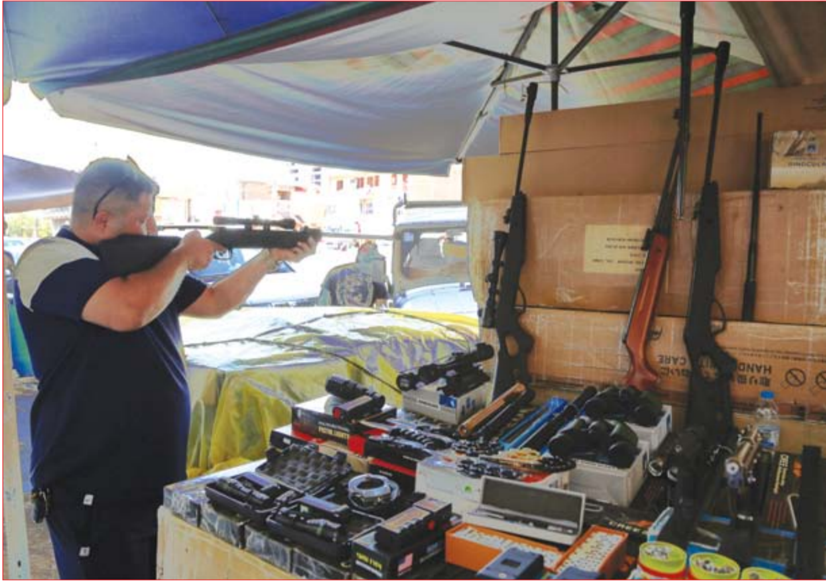
بسطات بيع بنادق الصيد تجتاح سوق الباب الشرقي ..... عسدة: محمود رؤوف

واختصر مجلس المحافظة - على وفق قرار جديد اتخذته بداية نيسان الحالي يعدد الأكثر جدية منذ ٥ سنوات - نصف المشوار لتحويل البصرة إلى إقليم، والذهاب مباشرة إلى الاستفتاء الشعبي. وقال كريم الشوك، عضو مجلس محافظة البصرة لـ(المدى) إنه يفتنى أن "ترفض حكومة بغداد طلب تحويل المحافظة إلى