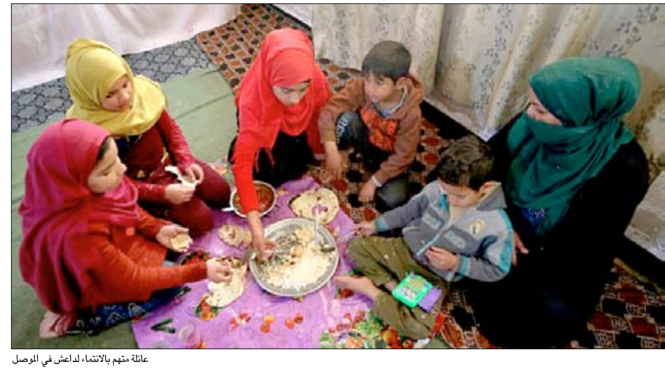
عائلة متهمة بالانتماء لداعش في الموصل

وأضاف جليبي بقوله "داعش سيطر على مدينة الموصل على مدى سنوات، ليس من الطبيعي أن تحصل هناك زوجات وطلاقات وولادات بين الأهالي خلال تلك الفترة" نحتاج إلى حل تشريعي". رئيس البرلمان العراقي محمد الحلبوسي يقول إنه لا يوجد هناك ميل لتغيير قوانين الأحوال المدنية والميراث، رغم أن هناك مقترحاً لفتح سجلات مدنية لفترة محدودة لتسجيل أطفال غير مسجلين. وقال الحلبوسي "هذه العوائل تحتاج إلى أن تتم رعايتها، لا يمكن أن يتروكو للضياع هكذا في المجتمع". خارج جامع في الموصل حيث تجلس أم يوسف، مع أطفالها تتبع الخبز تقول بأنها فقدت القوة التي تمكنها من رعاية أولادها. وأضافت بقولها "لقد حرمتنا من كل شيء، العائلة بأكملها محطمة". عن: أسوشيتيدجرس