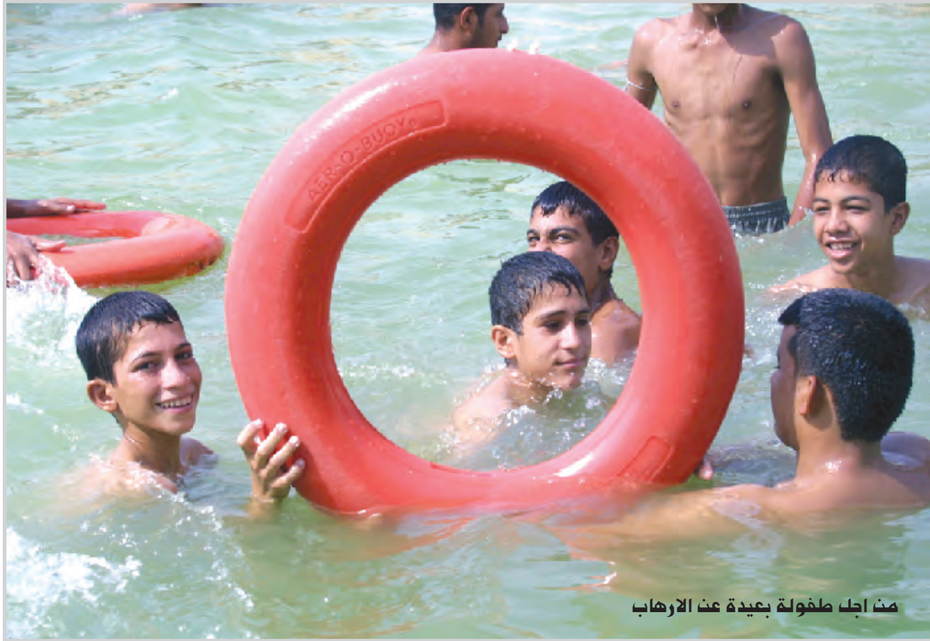
من اجل طفولة بعيدة عن الارهاب

وجهت محكمة أمن الدولة الأردنية للمعلم الفكري السابق لرقيم تنظيم القاعدة في العراق أبو مصعب الزرقاوي تهمة التآمر بقصد القيام بأعمال إرهابية. وقالت صحيفة الرأي اليومية، في عددها الصادر أمس، إن مدعي عام محكمة أمن الدولة أصدر قراراً بتوقيف عصام البرقاوي (٤٣ عاماً) الملقب بالشيخ أبو محمد المقدسي، لمدة ١٥ يوماً على ذمة التحقيق، بعد أن أسندت له تهمة "المؤامرة القيام بأعمال إرهابية". وكانت قوات الأمن الأردنية اعتقلت البرقاوي مطلع هذا الشهر، قائلة إن له صلات مع "جماعات إرهابية". بعد أسبوع واحد من إطلاق سراحه. وتم اعتقال المقدسي أثناء مشاهدته لمقابلة أجرتها معه قناة الجزيرة الفضائية القطرية. وقالت مصادر قريبة من المقدسي إن السلطات الأردنية كانت مزعجة من الشيخ الذي لم يتصل من الزرقاوي في مقابلاته مع الجزيرة، مع أنه انتقد بعض أساليب الزرقاوي في العراق. يذكر أن أحد أبناء المقدسي، يبلغ من العمر ١٩ عاماً، قتل في العراق أثناء قتاله مع جماعة الزرقاوي.