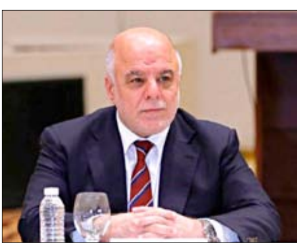
بغداد / سبوتنيك

قال رئيس الوزراء السابق حيدر العبادي إن التحالفات السياسية هشة وقلقة وإن المحاصصة دمّرت مؤسسات الدولة.