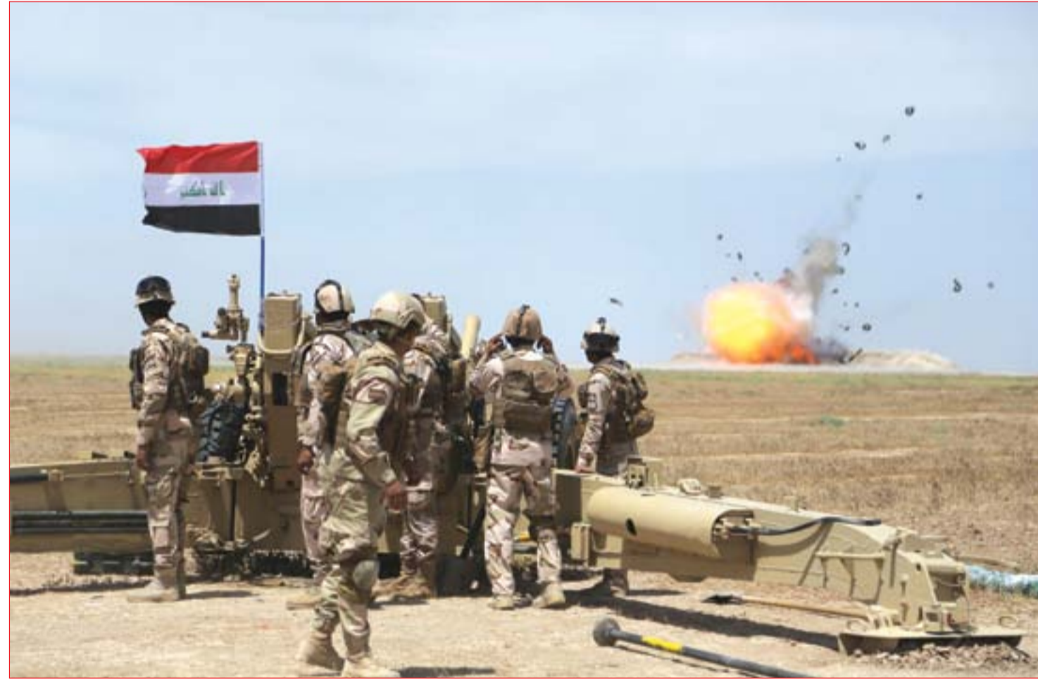
قوة عسكرية تنفذ عملية بالمدفعية جنوب بغداد..... عسدة: محمود رؤوف