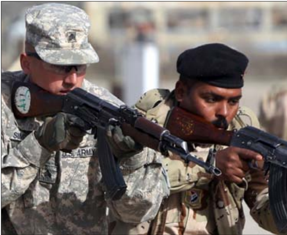
مستشار اميركي يدرب جندياً عراقياً.. اشراف

أشياء كثيرة تغيرت في العراق منذ أن تعرضت ضابطة الجيش الأميركي الكولونيل تامي دو كوروث، لحادث سقوط طائرتها السمتية بلاك هوك فوق بغداد عام 2004، ولكن ما تزال هناك مشاكل كبيرة لم تحل، الإرهابيون ما يزالون يهددون استقرار البلاد، الحكومة تواجه تحديات ضخمة والولايات المتحدة تحاول جهد إمكانها مساعدة العراقيين على تجاوز هذه المشاكل.