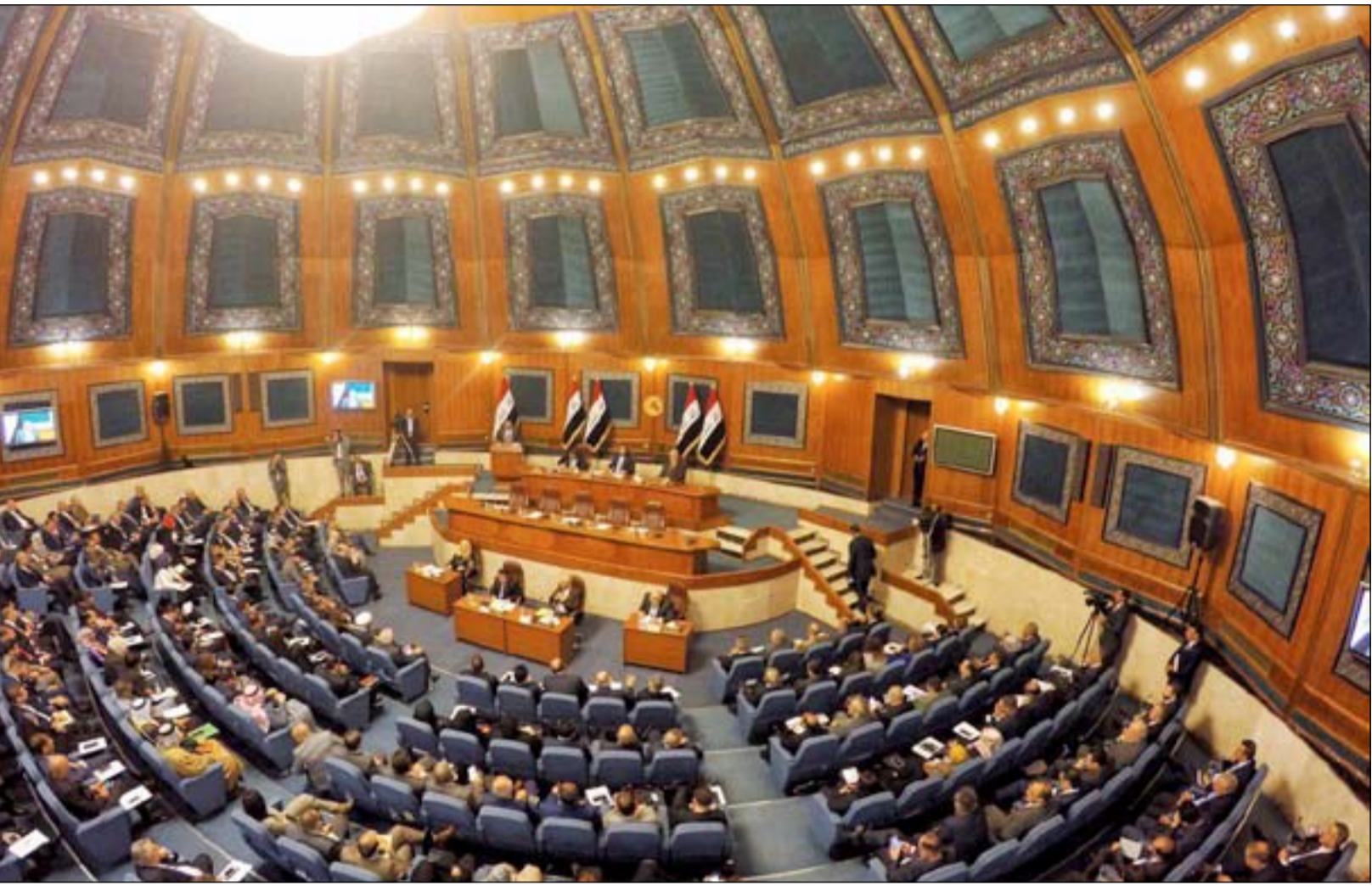
بغداد / المدى

كشف تحالف الفتح عن مفاوضات مكثفة مع تحالف سائرون من أجل إعادة التصويت على انتخاب رئيس لجنة الأمن والدفاع البرلمانية.