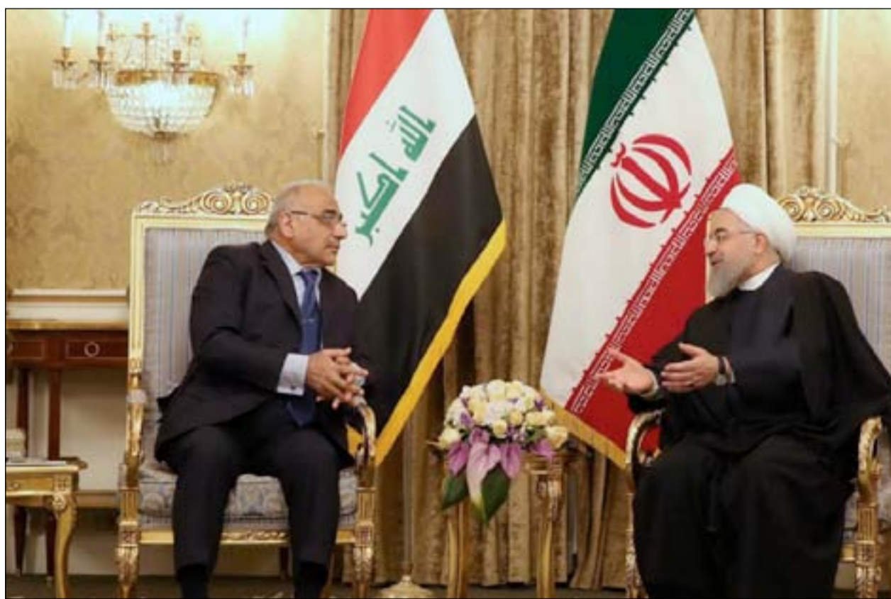
عبد المهدي خلال زيارته طهران

وأعدت الولايات المتحدة فرض عقوبات في تشرين الثاني 2018 على صادرات النفط الإيرانية، بعد أن انسحب الرئيس الأميركي دونالد ترامب من الاتفاق النووي المبرم عام 2015 بين طهران وست قوى عالمية.