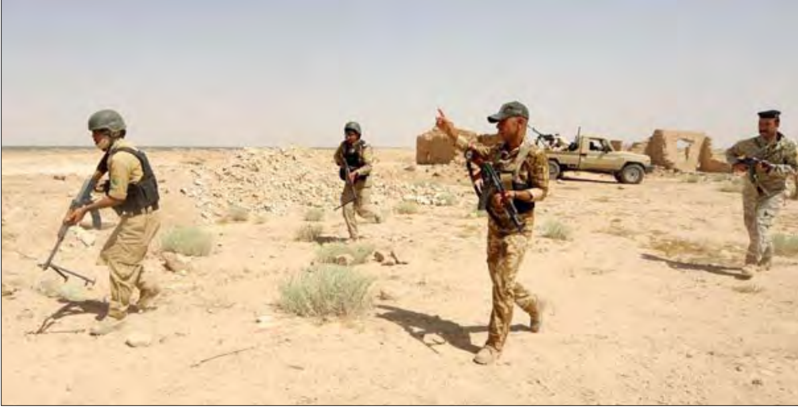
قوة عسكرية خلال ممارسة أمنية جنوب بغداد... أرشيف

شنّ تنظيم داعش، الأسبوع الماضي، الموجة الثانية من سلسلة هجماته في رمضان، طالت المناطق التي كانت يسيطر عليها قبل ٤ سنوات. في الأشهر الثلاثة الماضية، بدأ التنظيم المهزوم يغير في أسلوب الهجمات، إذ بدأ ينال من المدنيين ويتجنب استهداف القوات الأمنية.