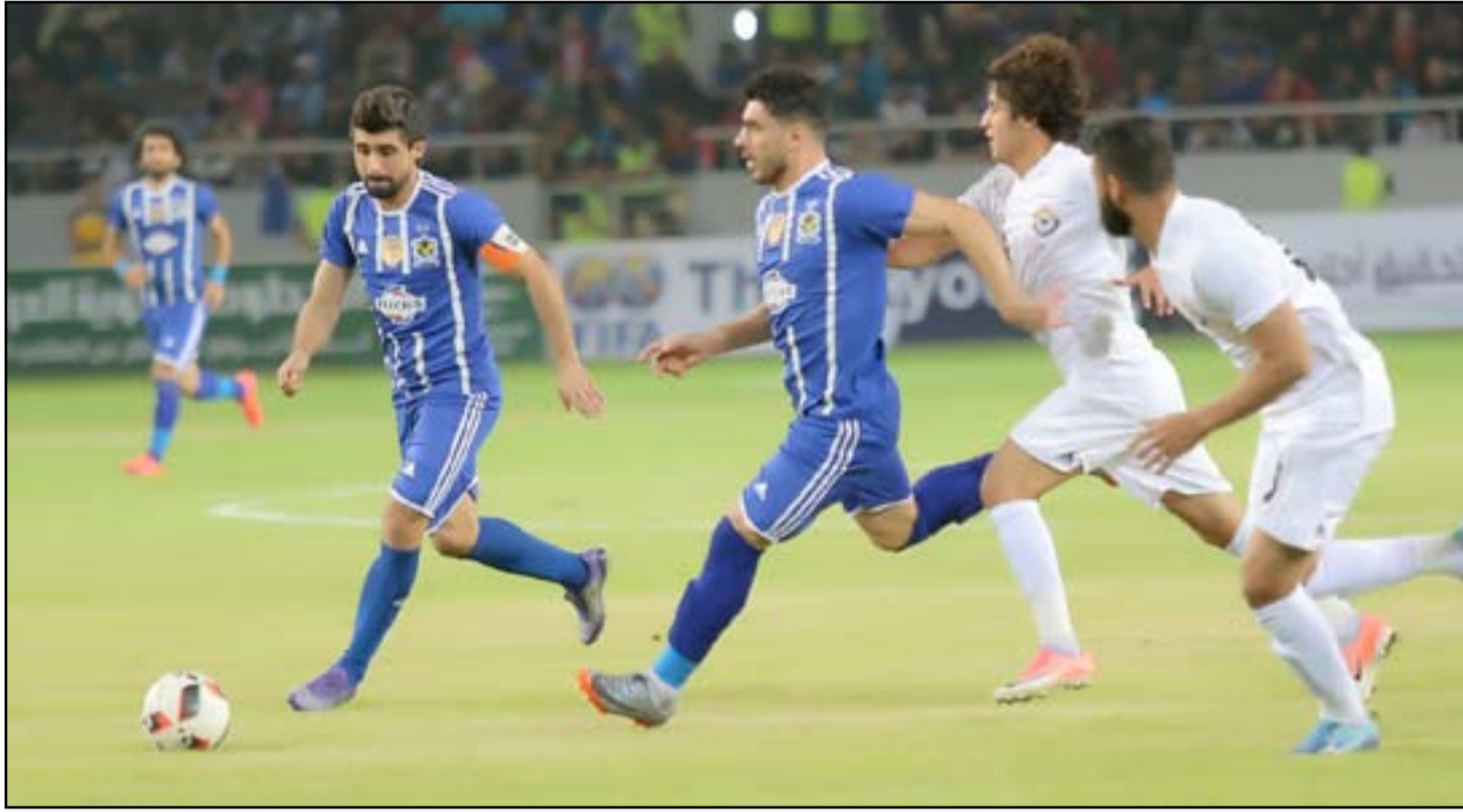
بغداد / حيدر مدلول

تدخل اليوم الثلاثاء منافسات مسابقة كأس العراق للموسم الكروي الحالي مرحلة الصمم بإقامة مواجهتين مثيرتين على ملاعب العاصمة بغداد ضمن الدور نصف النهائي لتحديد الفريقين المتأهلين إلى المباراة النهائية لمعرفة هوية البطل الذي سيشارك في الملحق التأهيلي ضمن منطقة غرب القارة بالنسخة المقبلة من دوري أبطال آسيا وكذلك وصيفة.