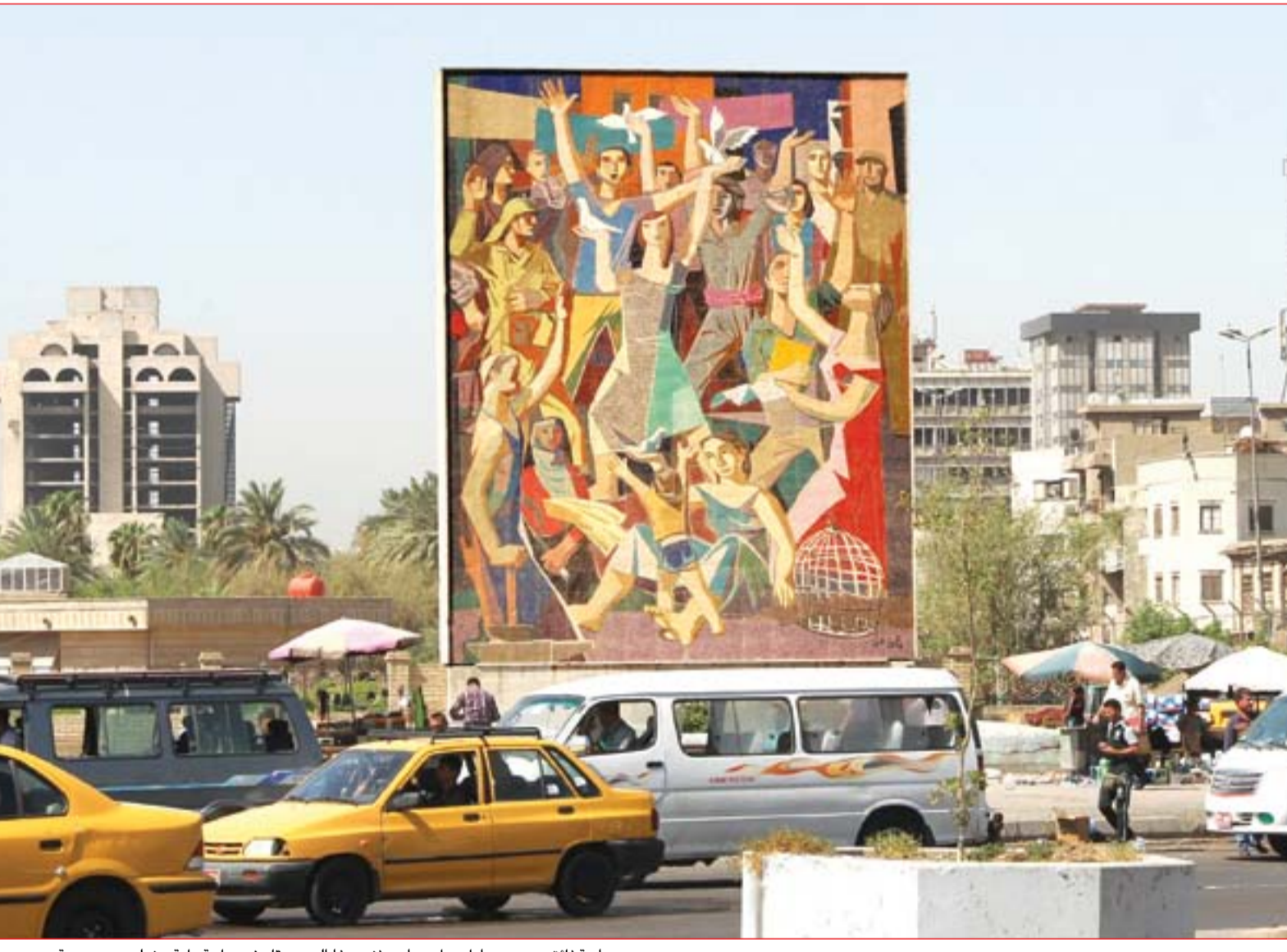
جدارية فائق حسن هي اول عمل جداري فني بهذا الحجم يقام في ساحة عامة ببغداد..... عسدة: محمود رؤوف