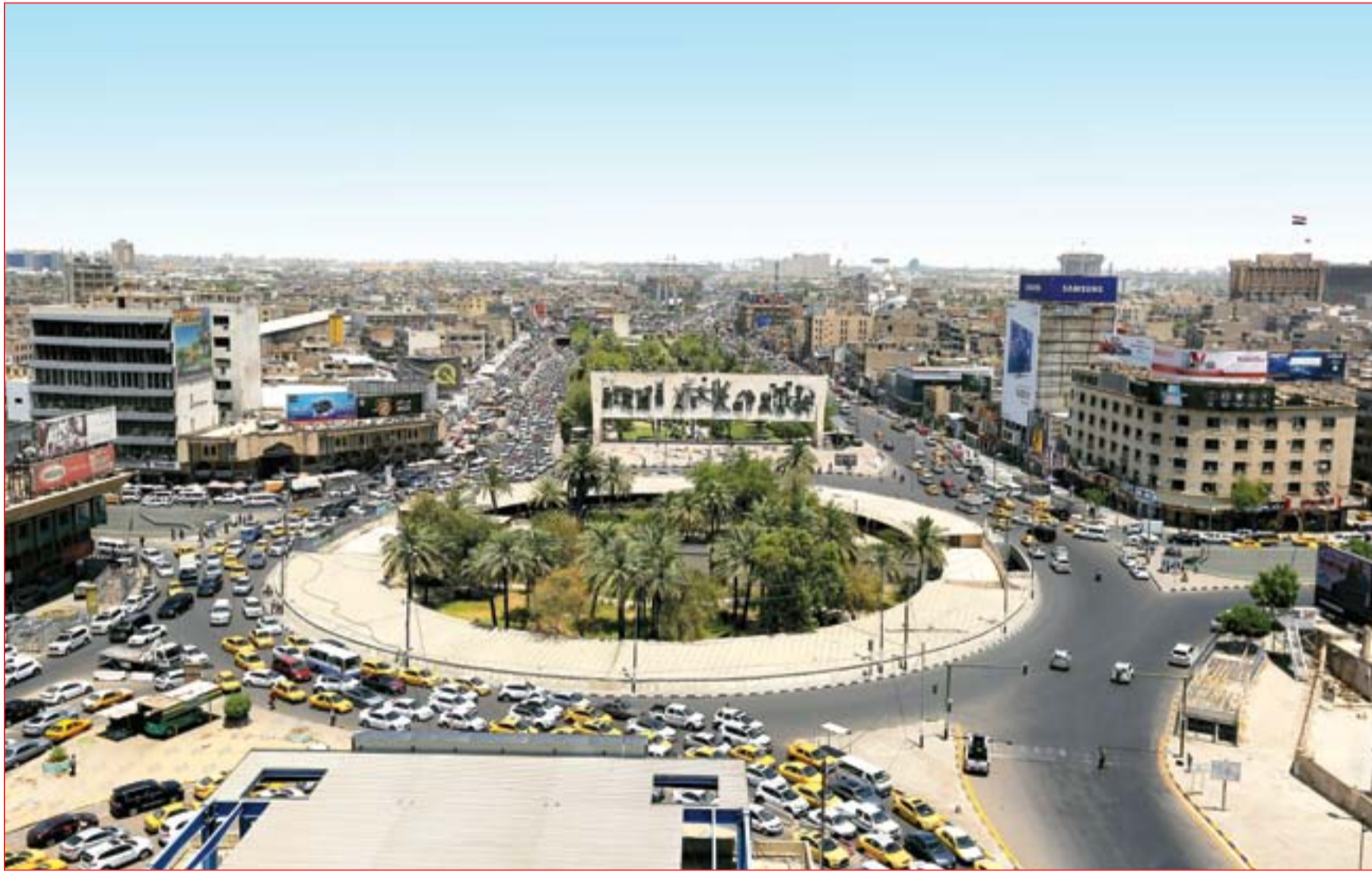
إنحزامات بغداد معاناة مستمرة .....