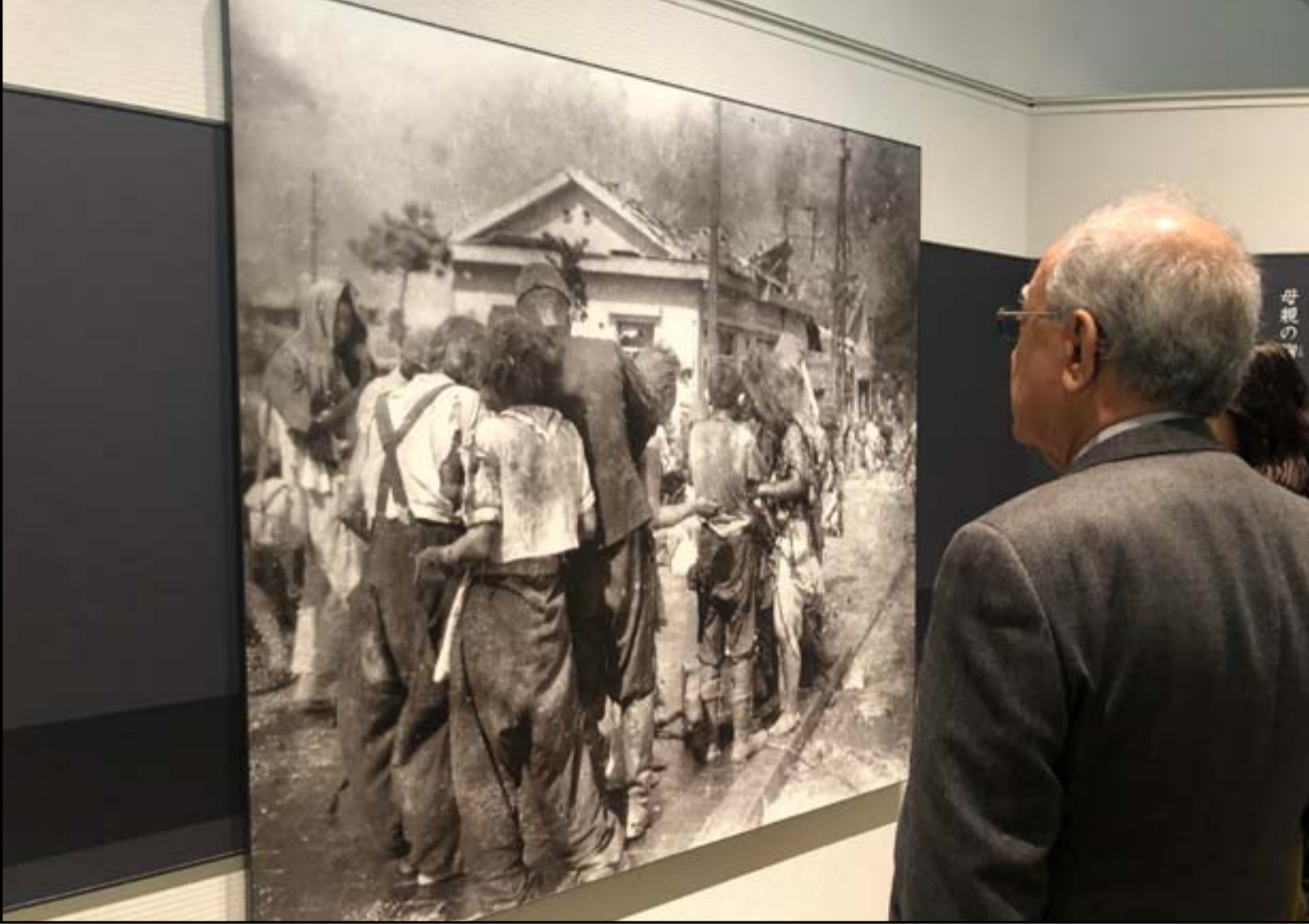
فخري كريم اثناء زيارته متحف هيروشيما

بغداد/ متابعة المدى للإعلام والثقافة والفنون في لقاء سابق مع سفير اليابان السابق