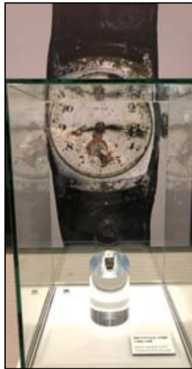
من مقتنيات متحف هيروشيما الساعة التي حددت وقت القاء القنبلة الذرية

أولاً : مشروع تطوير مصفى البصرة - خدمات هندسية فقط . - ثانياً : مشروع إعادة إعمار المنشأة التصديرية للنفط الخام في الفاو . ثالثاً : مشروع بناء محطة توليد الكهرباء الغازية في حقل عكاز في محافظة الأنبار . رابعاً : مشروع تطوير مصفى البصرة . ولتعب اليابان دوراً كبيراً في دعم المناطق التي تضررت بالحرب وخصوصاً الموصل والأبواب، حيث قدمت تمويلًا كبيراً لدعم المنظمة الدولية للهجرة في العراق ، مناطق العودة، واستهدف المشروع المساهمة بتأمين الإيواء، وذلك بتعزيز الخدمات الصحية، وتحسين المرافق الطبية ودعم جهود التماسك الاجتماعي في مجتمعات العائدين الأكثر تضرراً .