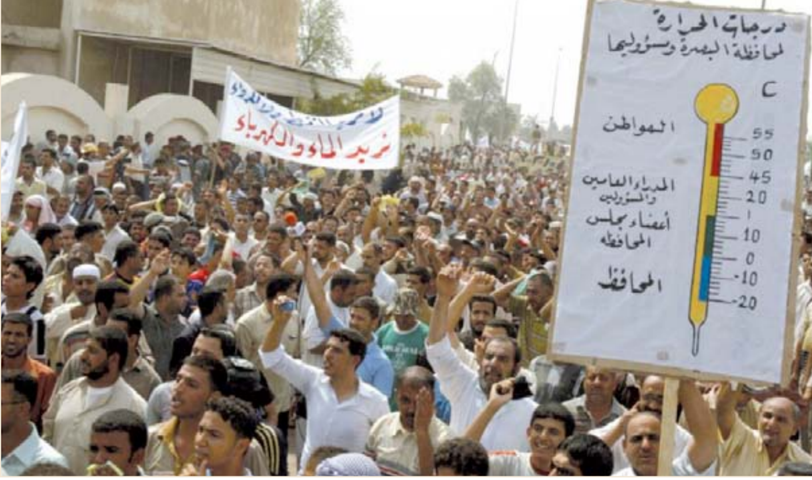
تظاهرة تطالب بالكهرباء في البصرة.. ارضيف