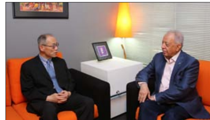
رئيس مؤسسة المدى للإعلام والثقافة والفنون في لقاء سابق مع سفير اليابان السابق