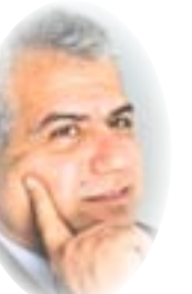
د. حسين الهنادوي

خالها الى التعذيب القاسي من قبل جلاوزة النظام الناصري من جهة، والى المرض العضال من جهة أخرى. النصوص المعنية هنا لا تقتصر على كتاب (في ظلال القرآن) وحده من بين العديد من مؤلفات سيد قطب، بل فقط على مقتطفات منه، وهي تلك التي نشرت في كتيب أطلق عليه (معالم على الطريق)، الذي عدته اجهزة المخابرات المصرية (لدليلا قاطعا) على تخطيطه لمؤامرة تستهدف حياة عبد الناصر نفسه وكبار مساعديه، ولتذهب بعدئذ الى إصدار حكم الإعدام على سيد قطب قبل أن تعدم الى إعدامه فعلاً في أواسط عام ١٩٦٦. وتلك المقتطفات (المؤامرة) التي حملته في (منصة الشهادة) في نظري أنصاره هي في رأيهم ايضا مجرد مقتطفات من تفسيره للقرآن. والحال إن (في ظلال القرآن) هو تفسير بلا شك، ولكنه تفسير غير ديني للقرآن. وهذا ما يفسر برأينا الحماسة الخاصة التي