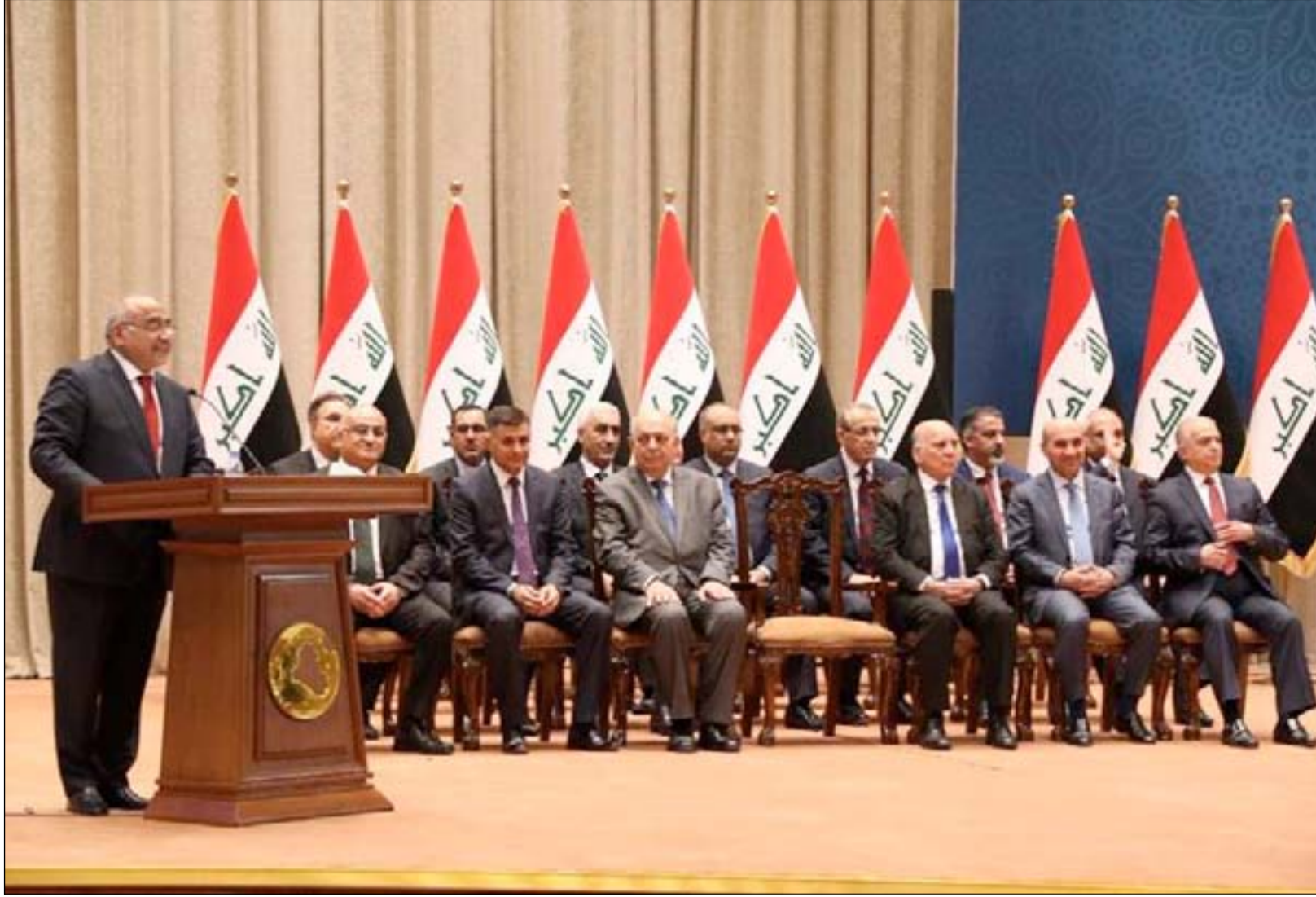
عبد المهدي خلال جلسة منقعة للحكومة.

من جانبه، اعتبر رئيس مجلس الوزراء السابق بهاء الأعرجي أن تأجيل جلسة مجلس النواب من دون التصويت على الكابينة الوزارية، يعكس مدى الخلاف بين الأطراف السياسية وصرعاتها من أجل الاستحواذ على المناصب التي أصبحت مصدر تمويل مالي لبعضها. وأضاف الأعرجي، في بيان صدر من مكتبه الإعلامي، أن "البعض يدفع للتأجيل من أجل إخراج الحكومة أمام الشارع العراقي، خاصة مع الهادي بالظهور خلال الأيام المقبلة في حال لم يتم التصويت على إكمال الحكومة"، العراق الذي يمر بـ(ظروف حرجة)".