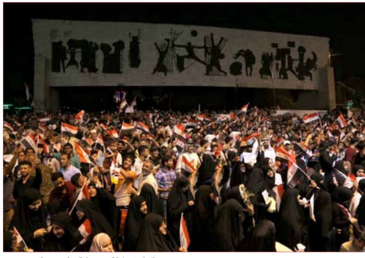
تظاهرات في ساحة التحرير مساء الجمعة...