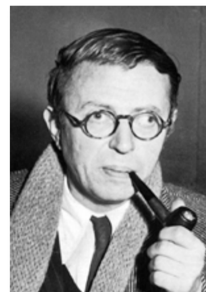
جان بول ساروت

أعطى اندلاع الحرب العالمية الأولى في العام ١٩١٤ فيتغنشتاين منفذاً لرغبته في الموت ، لقد تطوّع بسرعة في الجيش ، على الرغم من وضعه الصحي ، وتراه يكتب بعد سنوات : " ذهبت إلى