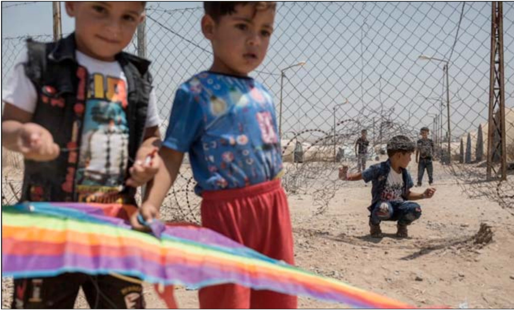
أطفال لسلمي داعش في مخيم حمام العليل.. أرشيف

ويضيف العراقي البالغ ٢٦ عاماً أن تلك الإجراءات يجب أن تستهدف عوائل الدواعش وحل مشكلتهم، سواء بإعادة عيشناهم بالمجتمع، أو بإزالة القصاص بالمتورط منهم أو غير ذلك. ولفت إلى أن بعض العائلات لا ذنب لها في ما حصل وكانت تقف ضد إرادة أبنائها الذين انضموا للتنظيم. لكن إلى جانب دور الدولة والمحاكم، فإن للعشائر