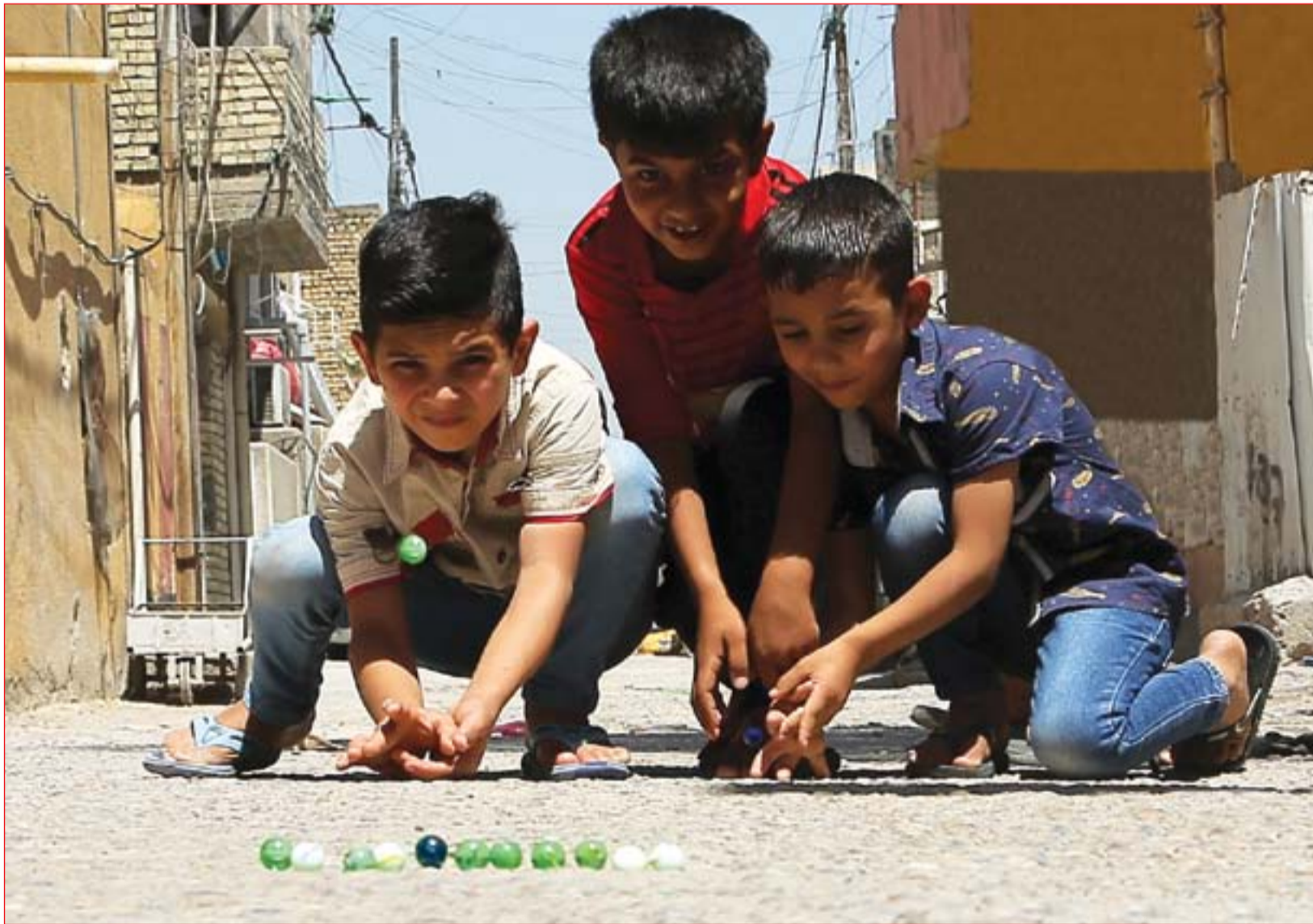
الاعباب الإلكترونية لم تلغ ألعاباً توارثها الأطفال عبر الأجيال.....