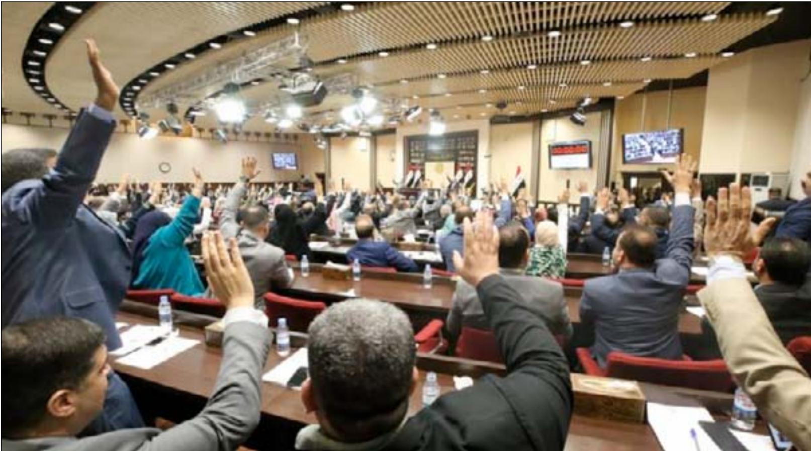
جلسة مجلس النواب... ارشيف

أياد علاوي ووزير العدل رشح باتفاق بين الاتحاد الوطني والديمقراطي الكردستانيين، منوهاً بأن أسباب رفض مرشحة وزارة التربية تعود إلى مواقف وخلافات شخصية.