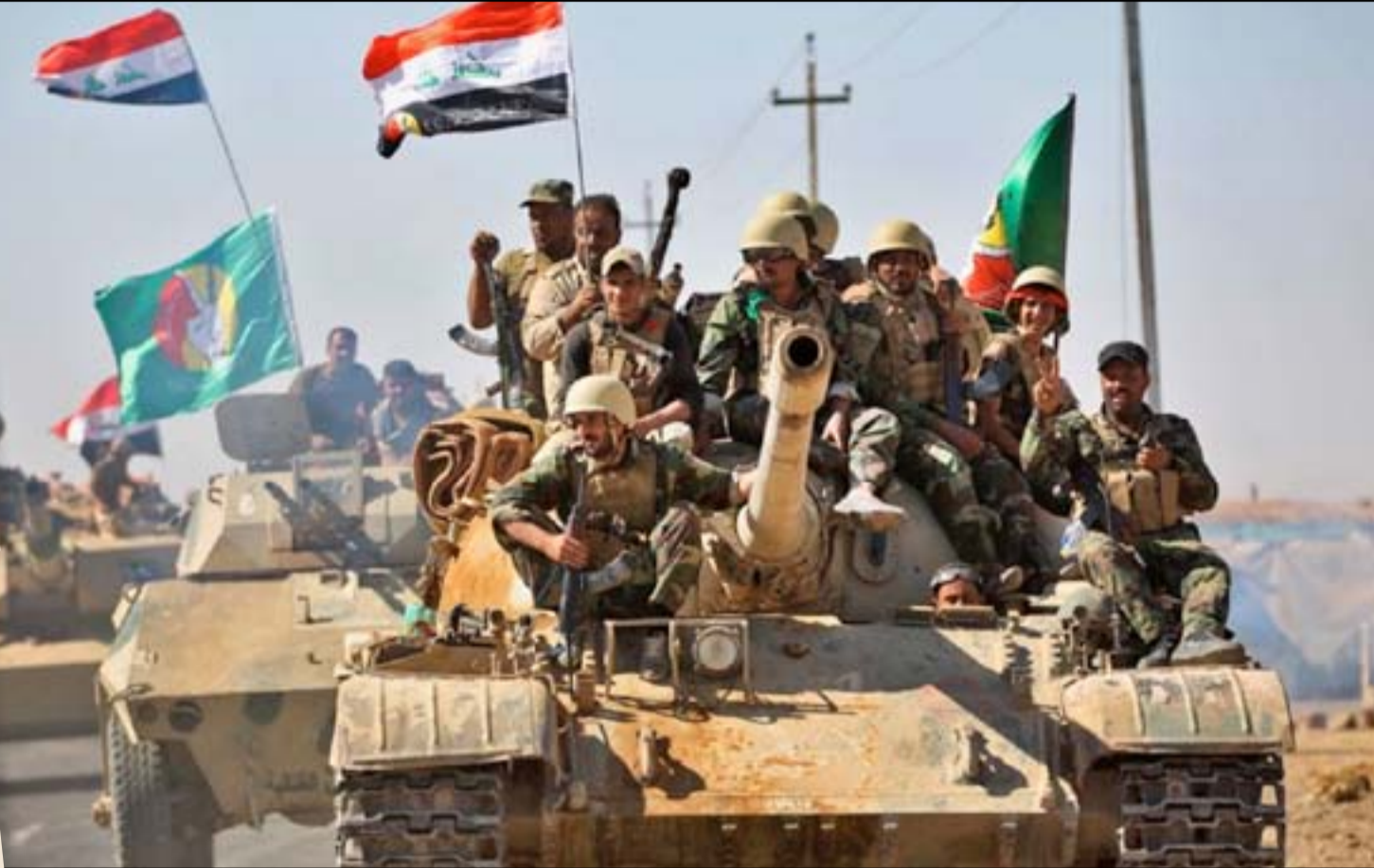
قوة من الحشد خلال معارك التحرير...

وقرر عادل عبد المهدي، بصفتة القائد العام للقوات المسلحة في الامر الديواني الاخير، ضم تشكيلات الحشد الشعبي