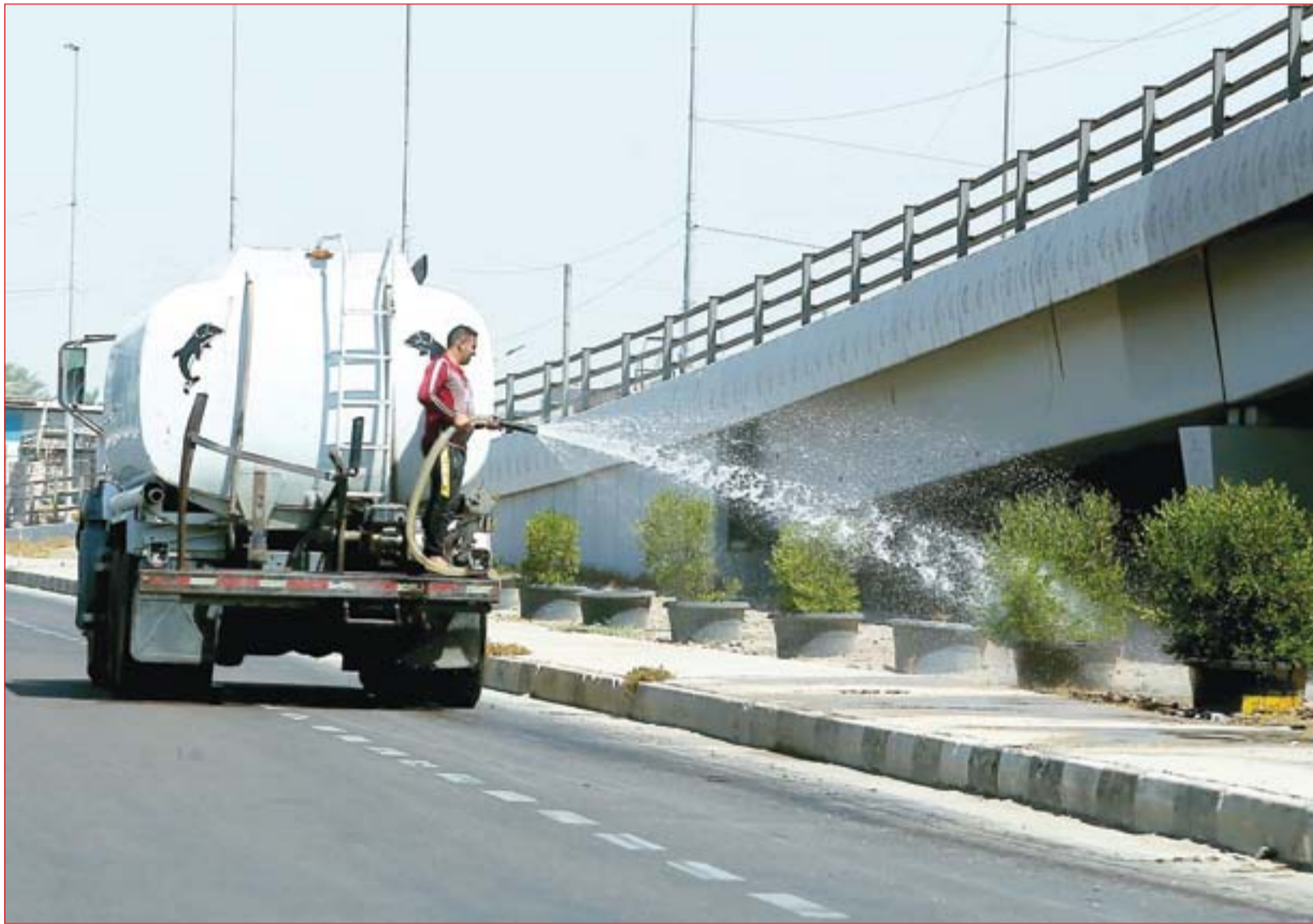
عمال الأمانة يحاولون حماية الأشجار من الحرارة العالية ..... عدسة: محمود رؤوف

على مجريات الدقائق المتبقية من المباراة لتسجيل الهدف الثاني الذي تحقق بواسطة أمجد عطوان في الدقيقة الثانية والثمانين ليشعل فرحة كبيرة لدى الملاك التدريبي واللاعبين الجالسين على دكة الاحتياط وكذلك جماهير النادي واستمرت النتيجة على حالها حتى الدقيقة الخامسة من الوقت بدل الضائع ليطلق الحكم الدولي مهني قاسم صفارته بنهاية المباراة لصالح الشرطة بنتيجة (2-1) محافظاً على الصدارة برصيد 85 نقطة فيما تجرد رصيد فريق أمانة بغداد عند النقطة السابعة والأربعين في المركز السابع.