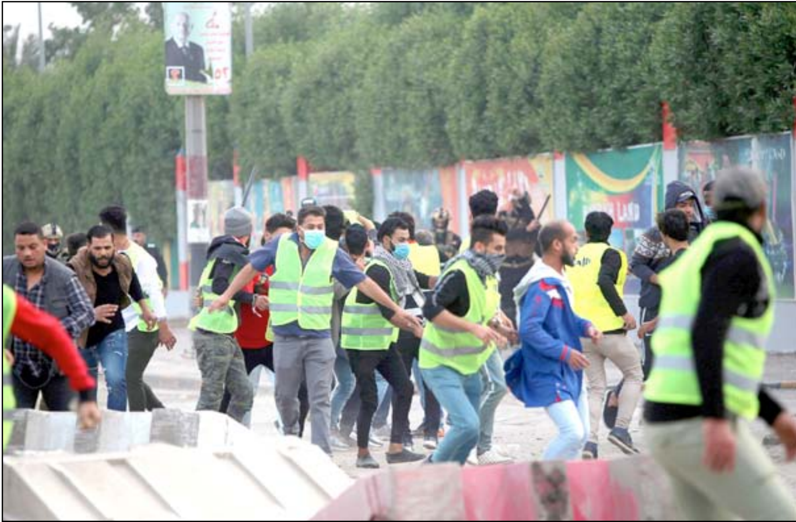
تظاهرات في البصرة

تنتهي اليوم المهلة التي ألزم بها محافظ البصرة اسعد العيداني نفسه لتنفيذ مطالب المتظاهرين المتعلقة بسوء الخدمات وملف البطالة. ويتوقع مسؤولون وناشطون تصاعد حدة الاحتجاجات في المدينة الجالسة على صفيح ساخن، خصوصا وأنه لا توجد مؤشرات على تحقيق تلك المطالب.