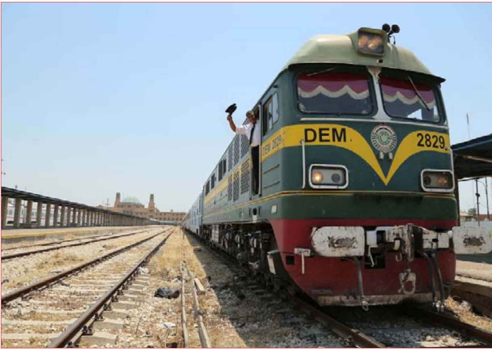
سائق القطار يلوح بقبعته قبل انطلاق رحلة من بغداد إلى الفلوجة

بغداد / وائل نعمة تنتهي اليوم المهلة التي أُلغيت فيها محاكمات البصرة لسعد العبداني نفسه لتنفيذ مطالب المتظاهرين المتعلقة بسوء الخدمات وملف البطالة. ويتوقع مسؤولون وناشطون تصاعد حدة الاحتجاجات في المدينة الجاسية على صفيح ساخن، خصوصاً وأنه لا توجد مؤشرات على تحقيق تلك المطالب. وقام العبداني نهاية حزيران الماضي، في خطوة لامتناع غضب مئات المتظاهرين الذين تجمعوا أمام مبنى المحافظة، بإعطائهم وعداً بتحقيق مطالبهم خلال ١٠ أيام.