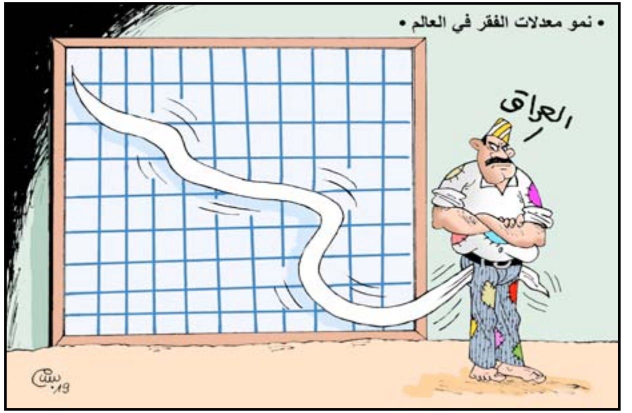
• نمو معدلات الفقر في العالم •