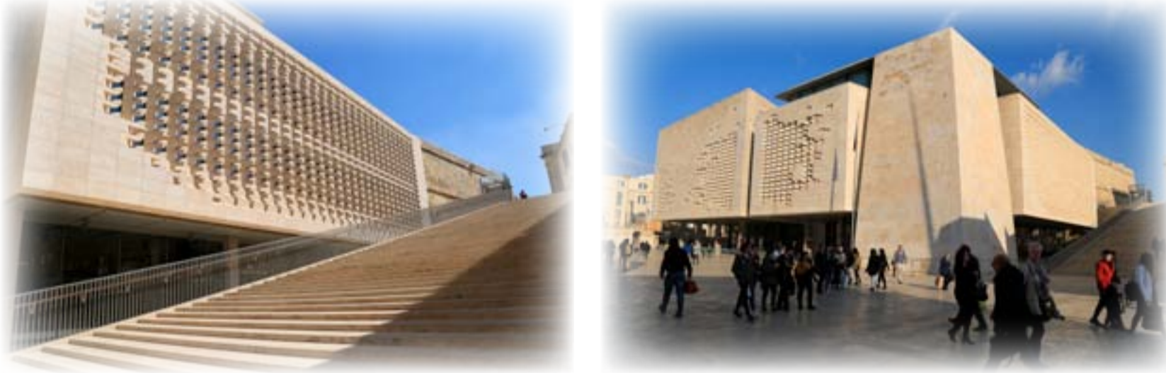
مبنى "برلمان مالطا" (2009 - 2015)، فاليتا، المعمار: رينزو بيانو، منظر عام.