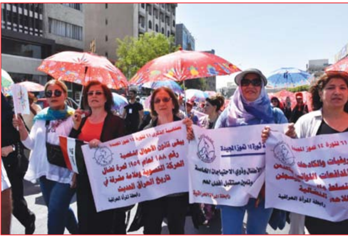
مسيرة لأعضاء في الحزب الشيوعي بمناسبة ثورة ١٤ تموز..... عدسة: محمود رؤوف