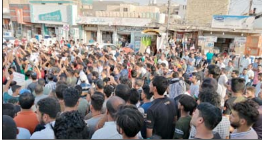
تظاهرة مطلبة في قضاء الرفاعي