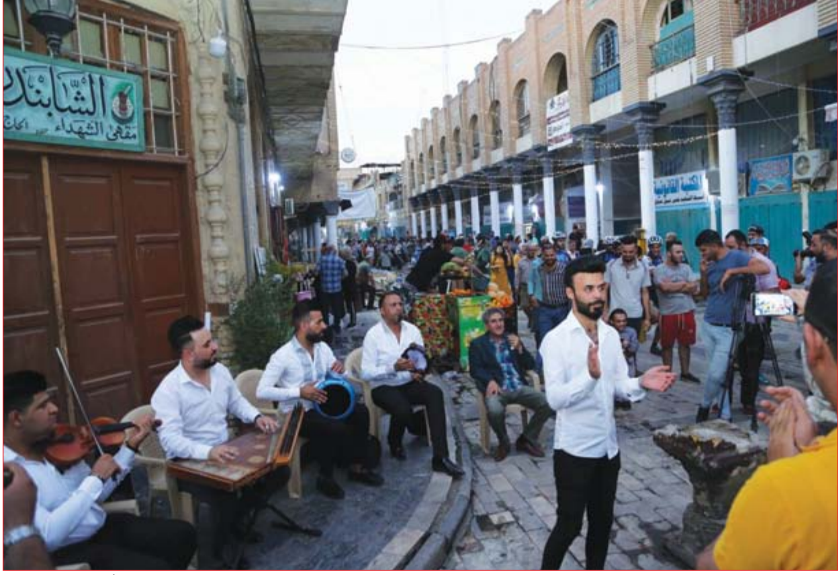
اصحاب المكتبات يرفعون مبادرة لحياء شارع المتنبي مساءً ..... عدسة: محمود رؤوف

مقترح عراقي بشأن الأزمة بين طهران وواشنطن يلاقي ترحيباً أوروبياً