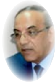
هادي عزيز علي

اضطرت أخيراً لبيع لوحة من مقتنياتي من أعمال الفنان ضياء العزاوي في مزاد «بونهامس» العالمي في لندن، وفوجئت بالسعر الذي يعادل دخلي السنوي من الكتابة. عنوان اللوحة «أشكال سومرية» وهي زيتية وقياساتها 82×93 سنتمتر، رسمها العزاوي مطلع السبعينيات، ومن أول أعماله التي تستلهم التراث العراقي القديم، وتختلف اللوحة عن أعماله الأخرى، فهي زرقاء بالكامل، مثل ليلة بغدادية في العراق دامية الظلام غير مقمرة، والأشكال السومرية الخرافية فيها مرسومة بخطوط كثيفة زرقاء سوداء، وتتناثر حولها إضاءات خفيفة الزرقاء. ومع أن الأشكال السومرية تتكرر في أعمال العزاوي الذي درس علم الآثار في جامعة بغداد، فهذه اللوحة تختلف عن أعماله التي تتميز بخطوط سوداء فاحمة وقرمزية باهرة، وملونة مشرقة، وهي سمة أعمال العزاوي، تعرفها من الواهنا.