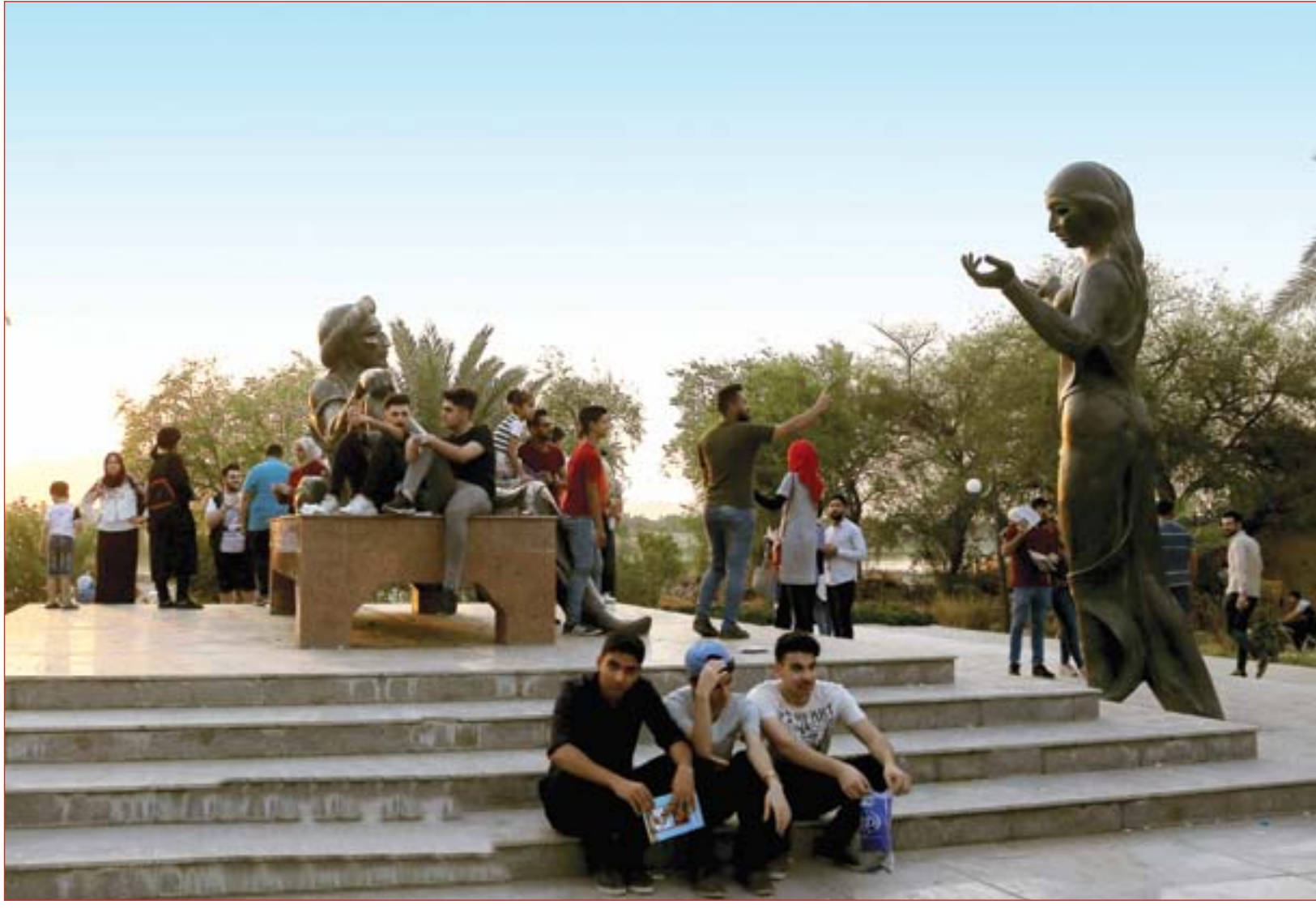
عائل بغدادية تنتزه قرب تمثال شهريار وشهرزاد..... عسة: محمود رؤوف

هادي عزيز علي يكتب: نزاعات دواوين الأوقاف وأيلولة المال الموقوف