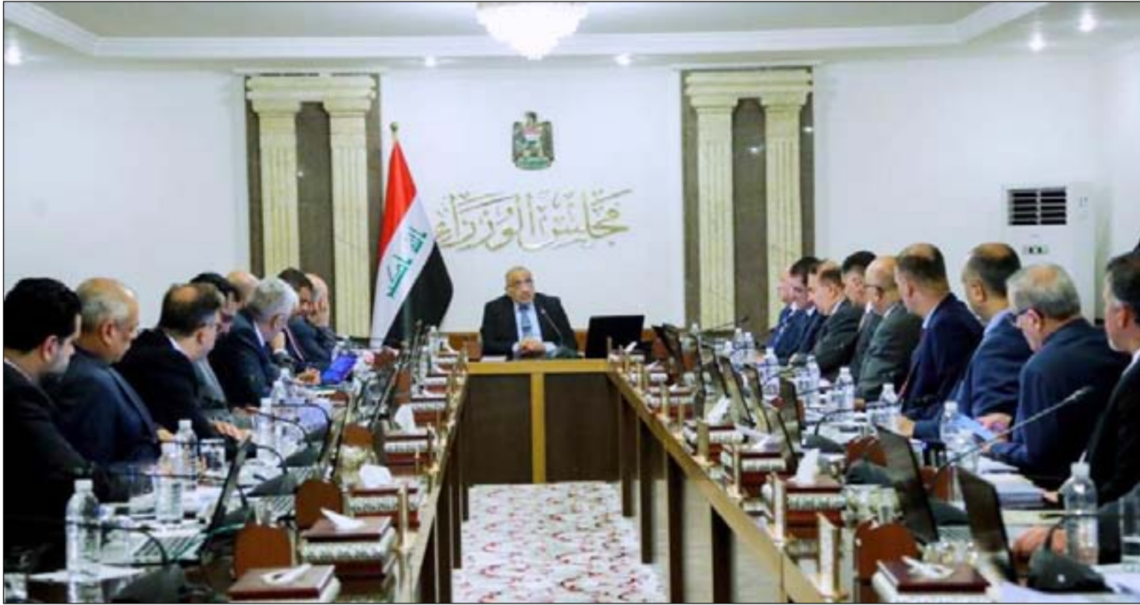
جلسة مجلس الوزراء... ارشفيف

فريق حكومي يقترح إعادة التقشف وبيع عقارات الدولة وزيادة الضرائب