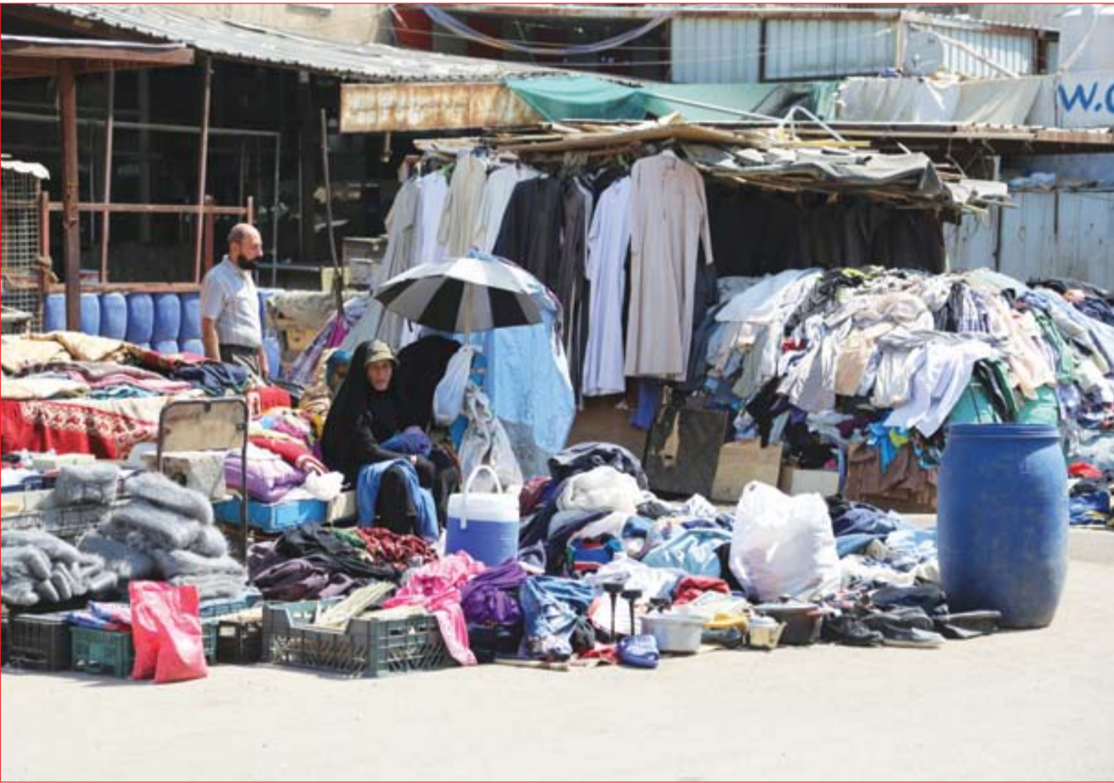
بسطات البالات تغلق شوارع رئيسة في بغداد الجديدة ..... عدسة: محمود رؤوف