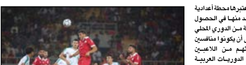
Action shot of a football match.