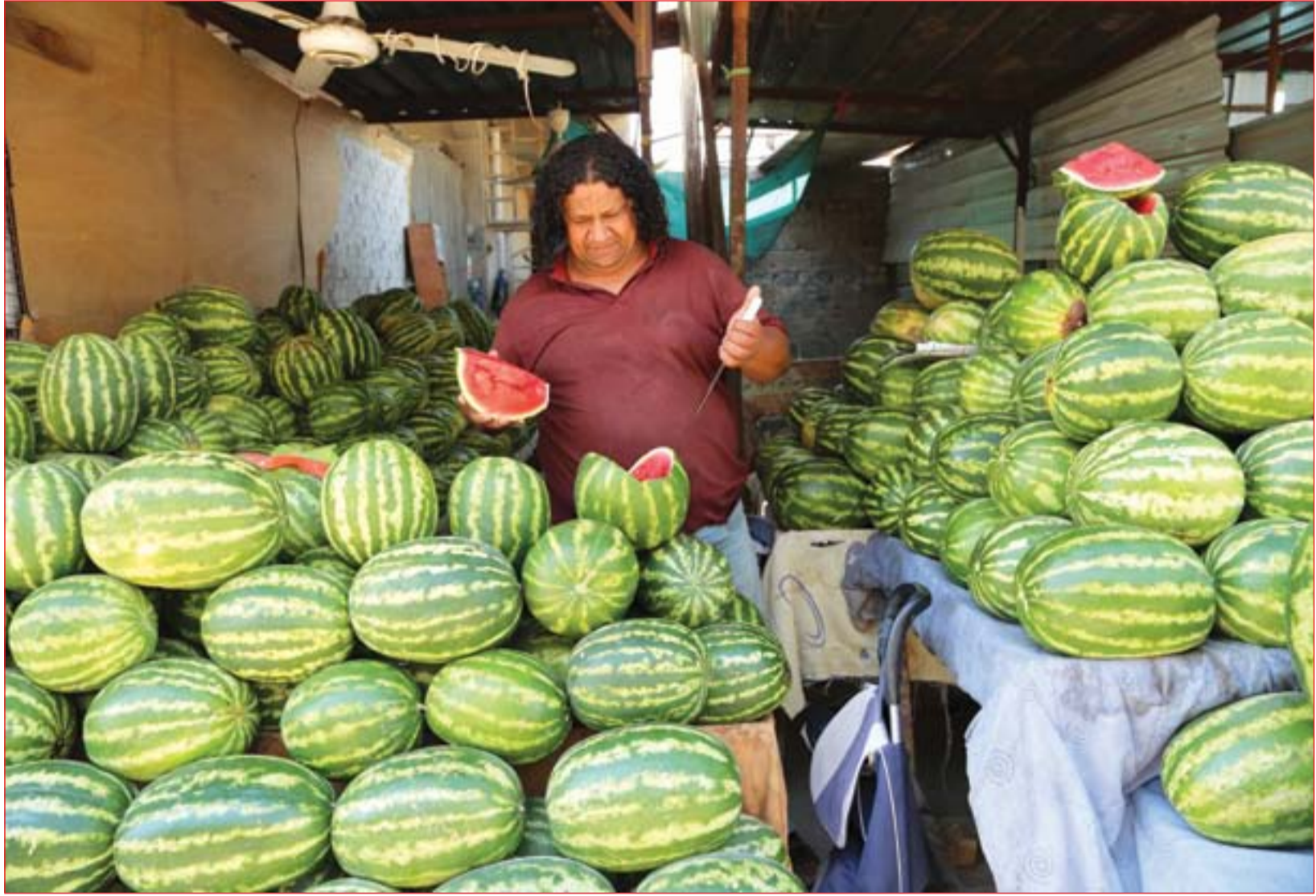
المنتج المحلي يسد حاجة السوق من المواد الغذائية ..... عدا: محمود رؤوف