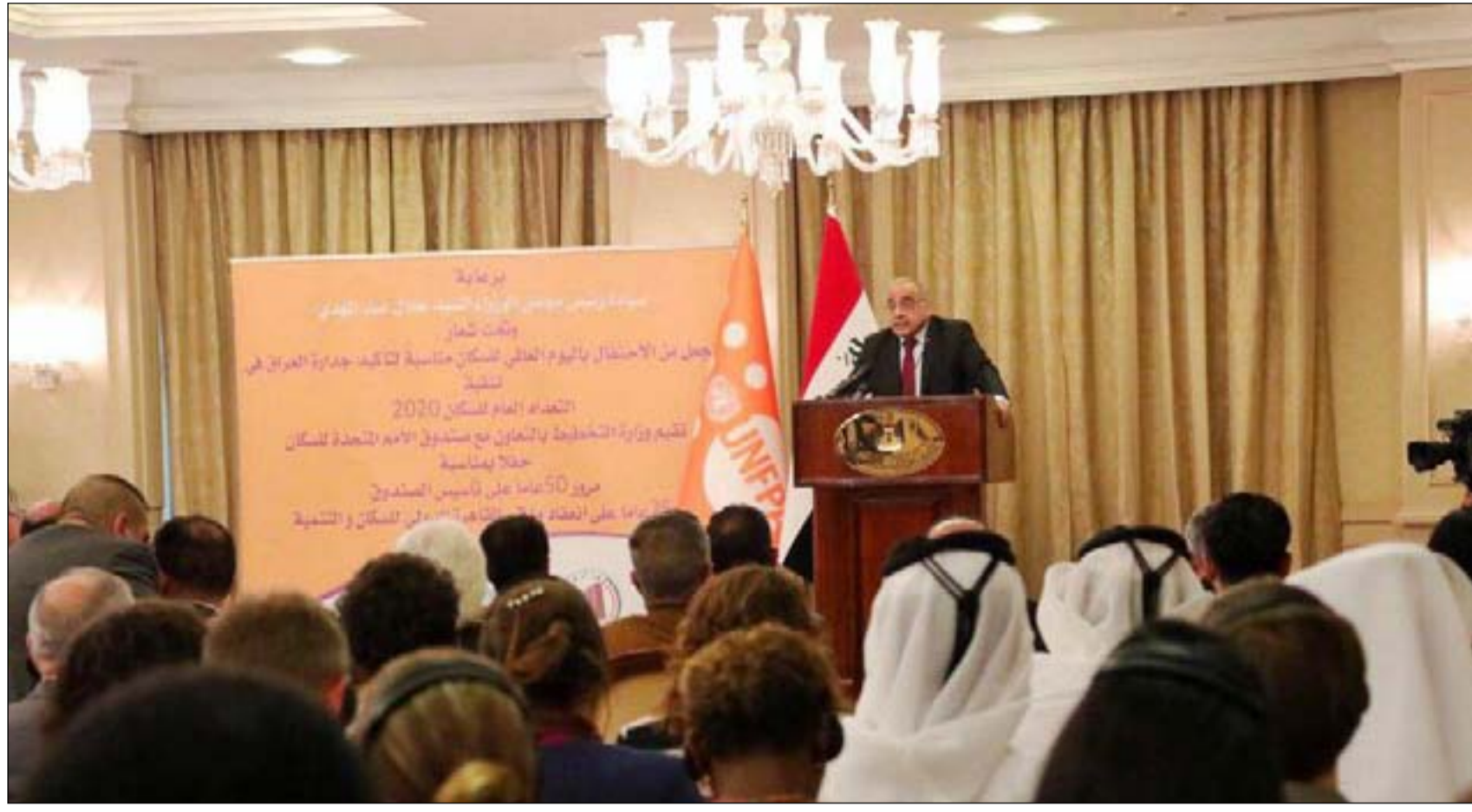
عادل عبد المهدي خلال احتفالية اليوم العالمي للسكان