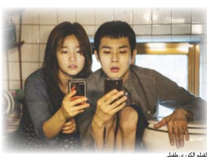
الفيلم الكوري طفيلي