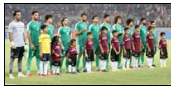
العودة من محافظة كربلاء المقدسة باللعب إلى العاصمة دمشق بعد الإعداد المثالي لهم للبطولة من خلال المشاركة في دورة نهر الدولية التي أقيمت في الهند خلال شهر تموز الماضي أملاً في استعادة الثقة والتصال مع الجماهير.

والأردن والسعودية. واستفاد أسود الرافدين من مواصلة الترتيب على صدارة ترتيب المجموعة الأولى برصيد ست نقاط بعد السقوط الدوي لغريمه التقليدي نسور قاسيون في فخ التعادل الإيجابي أمام المنتخب اليمني لكرة القدم في المباراة التي جرت بينهما ضمن الجولة الثالثة من الدور الأول من البطولة محتلاً المركز الرابع برصيد نقطة واحدة فقط لينتهي أماله في إمكانية بلوغ نهائي بطولة غرب آسيا لكرة