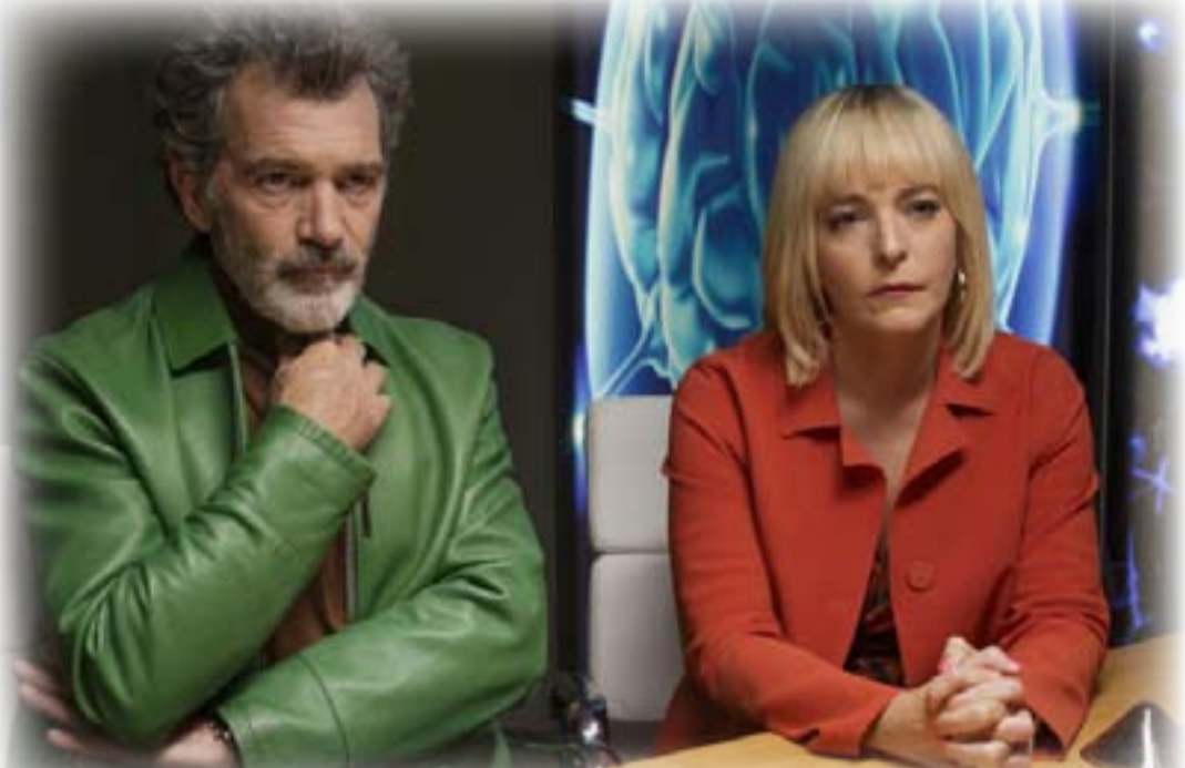
فيلم المودوفار... ألم ومجد

صراع ريكي وأسرته، خلال الأزمة الاقتصادية عام 2008، حيث تلوح له فرصة للنجاح، عندما يشتري شاحنة جديدة، ليدخل بها مجر تجميع الطلبات.