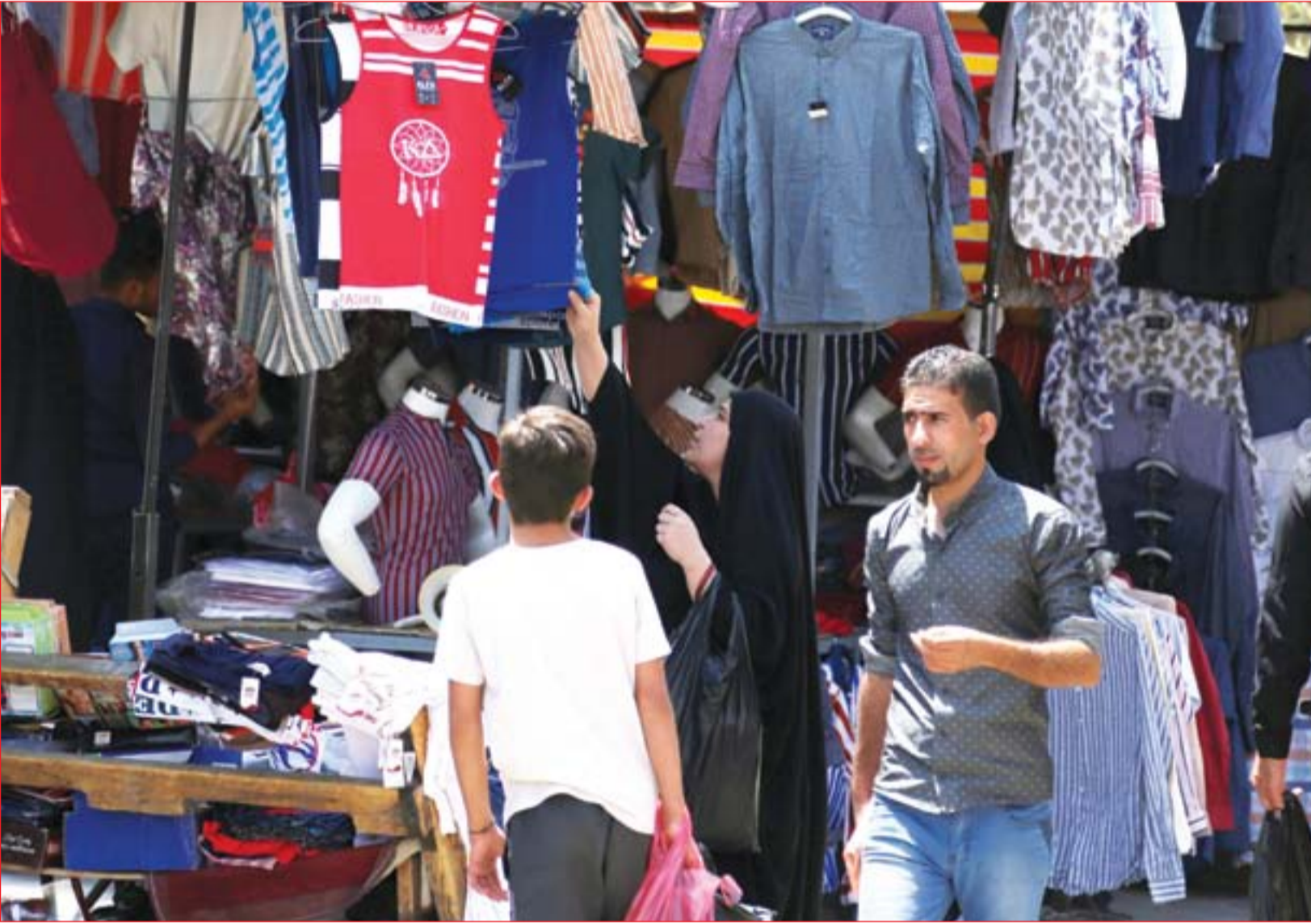
محل الملابس تشهد اقبالاً مع قرب عيد الاضحى المبارك ..... عسدة: محمود رؤوف

البتاغون يحذر من تزايد نشاط داعش في العراق وسوريا