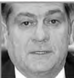
بغرض هذا المنتدى ضفوطاً مماثلة على الدورة القادمة للمنظمة.

اعتقلت الشرطة الإيطالية رئيس مصرف في مدينة بارما حيث يوجد مقر شركة بارامالات العملاقة للأغذية التي تواجه مشاكل مالية. وكان فرانسيسكو جويري، وهو صديق شخصي لمؤسس شركة بارامالات، كاليستو تازي، قد تنحى عن منصبه كرئيس لمصرف مونتيفارماتو قبل أسبوع. وبلغت نسبة التدهور في الشركة التي تديرها بارامالات إلى 78 في المائة مما دفعها إلى الإفلاس. وقال جويري في بيان صحفي إن الشركة تواجه مشاكل مالية خطيرة، وذلك بعد أن انهارت الشركة في سوق الأوراق المالية في إيطاليا. وأضاف جويري أن الشركة تواجه مشاكل مالية خطيرة، وذلك بعد أن انهارت الشركة في سوق الأوراق المالية في إيطاليا.