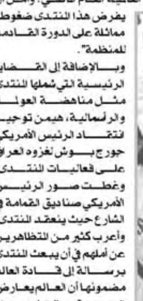
بغرض هذا المنتدى ضفوطاً مماثلة على الدورة القادمة للمنظمة.

بدأ في الأسبوع الماضي بمدينة بومباي الهندية منتدى مناخضة العولمة الذي ينظمه نشطاء مناهضون للعولمة في أنحاء العالم ويستمر ستة أيام. واحشد الآلاف في شوارع المدينة الأسبوع الماضي حيث ندد بالتظاهرون ومغزو الفوكور والرقصون بالتجارة غير للتكافئة والحرب على العراق. وكان من بين الحاضرين في المنتدى الناشط والزراع الفرنسي جوزيه بوف وقادة اعمال في كوريا الجنوبية فضلاً عن ناشطات في مجال حقوق المرأة بافغانستان. وقد تمت إقامة المنتدى كنظير لمنظمة التجارة العالمية. وكان بوف في احد من أول المتحدثين في المنتدى الذي بدأ أعماله يوم الجمعة السادس عشر من الشهر الجاري في مجمع صناعي بضاحية في بومباي. وقال بوف للحاضرين الذين اكتظ بهم المنتدى إن الشركات العالمية تنتج أطنمة معبلة ومشروبات بنسبي مقاطعتها. ودعا منظمة التجارة العالمية، التي تجتمع الأسبوع الحالي في سويسرا، إلى عدم فرض قيود على الزراعة. ونقلت وكالة رويترز أن بوف قول: "تهدد سياسات منظمة التجارة العالمية مستقبلنا، حيث تحتكر الصناعات الكبرى البذور، وهو ما يعني أن الزارعين لا يمكنهم استخدام بذورهم ومن ثم يتوقفون عن العمل. فالبلاد ان يتوقف احتكار البذور". أما قائد اسبوع منظمة لحملة