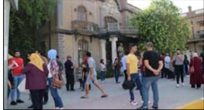
بين الحين والآخر لتعريف المجتمع بأهمية التراث الذي يمتلكه هذا البلد خلال هذه الجولات نشاهد اقبال العريق وهويته الحضارية لذا من خلال هذه الجولات نشاهد اقبال

الجمهور بشكل كبير للتعرف والاطلاع على تراثنا وهذا دليل الوعي والاهتمام الجاد بالتعريف عن هوية الوطن ان كانت آثارية او تراثية لان وطننا الغالي يستحق كل الجهود ان تتكاتف من اجل التعريف عن تاريخه الكبير وحضارته العريقة".