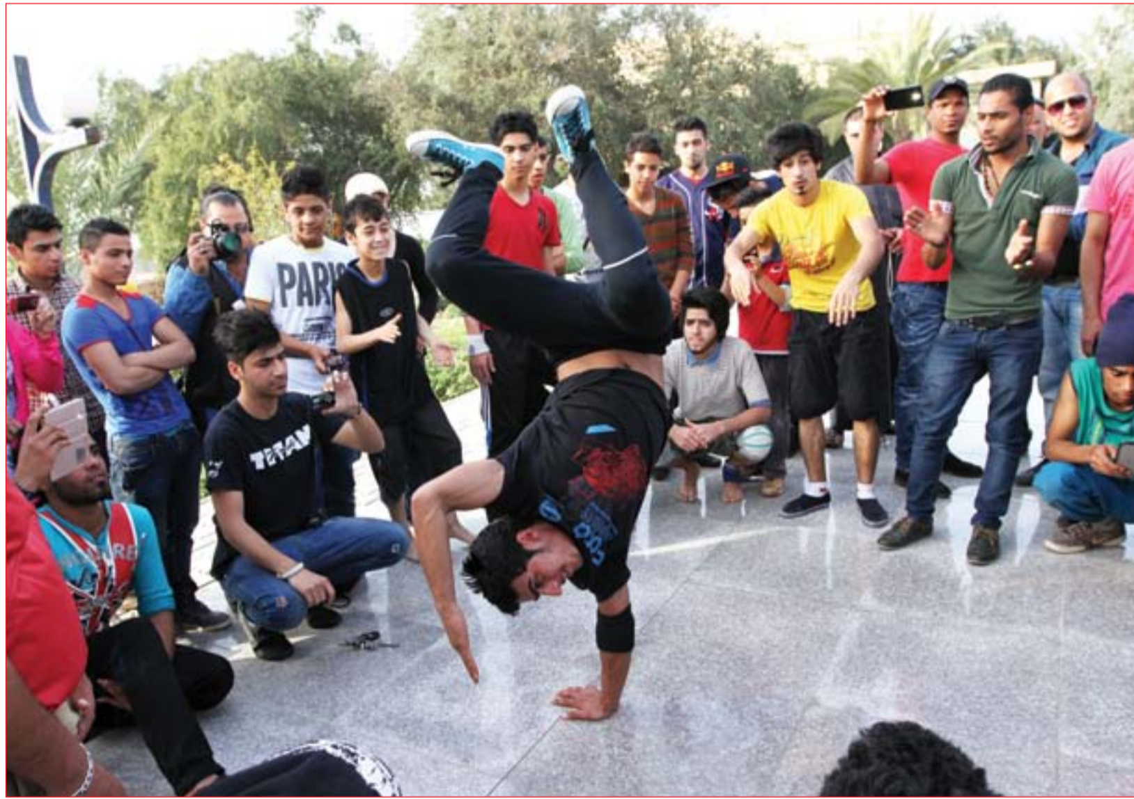
شباب يرقصون على موسيقى غربية قرب نصب شهريار وشهرزاد ..... عدسة: محمود رؤوف

ترجمة / عدوية الهلالي يبدو أن اللغز المحيط بالهجوم على قوات الحشد على وشك أن يزال عنه الغموض، ففي 19 تموز الفائت، قصفت طائرة بدون طيار مجهولة الهوية قاعدة الحشد الشعبي في وسط العراق والتي تضم قوات الحشد الشعبي، ما أسفر عن مقتل مقاتل عراقي وإصابة مهندسين عسكريين إيرانيين آخرين - وفقاً للقيادة العسكرية ومسؤول في الحشد الشعبي. على الفور، قالت الولايات المتحدة التي ما زال لديها 5200 جندي في العراق كجزء من التحالف ضد داعش، إنها ليست على صلة بالهجوم. ووفقاً لمصادر دبلوماسية غربية، فإن منفذ هذه الضربة لن يكون سوى سلاح الجو الإسرائيلي. وكالعادة، فإن إسرائيل التي نادراً ما تعلق على عملياتها خارج حدودها، لم تؤكد أو تنفي هذه غارة لها في العراق حدثت منذ 28 عاماً لتدمير مفاعل تموز النووي في حزيران عام 1981، ولكن وفي مقابلة أجريت مع عاموس يادلين، اللواء السابق في سلاح الجو الإسرائيلي قال إن إسرائيل ربما كانت وراء الهجومين الأخيرين في العراق. كما قال: "يبدو أن إسرائيل تعمل فعلاً في العراق". وأضاف قائلاً: "من المهم بالنسبة لإسرائيل ألا تعلن مسؤوليتها عن مثل هذا الهجوم، لأن هذا قد يعقد الأمور بالنسبة للولايات المتحدة، ودون الإشارة إلى هذه الحالة بالذات، يمكن القول بأن الطائرة المثالية لتنفيذ هذا الهجوم هي F-35". ■ التفاصيل ص 2