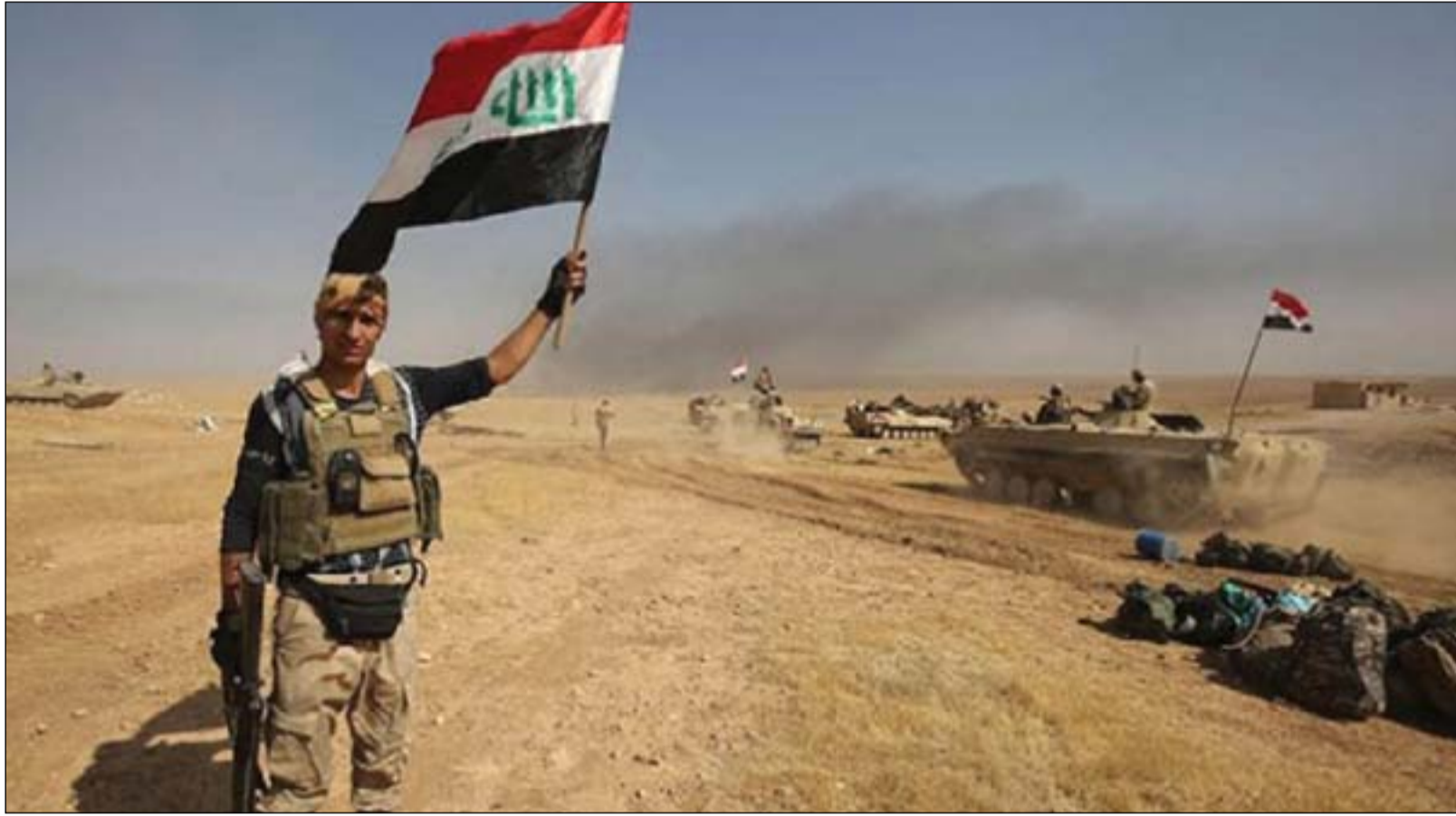
قوة من الجيش غرب الانبار