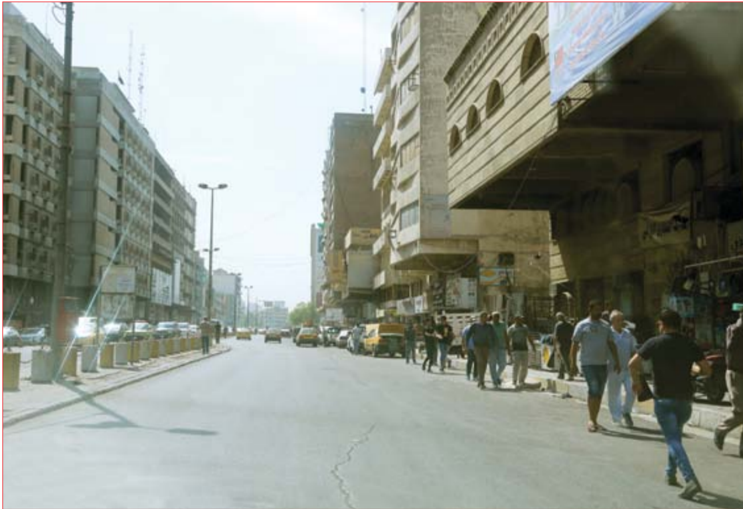
الشوارع المؤدية إلى منطقة السنك خالية من "الجنابر" بعد حملة لأمانة العاصمة..... عسة: محمود رؤوف

القوات لم تنه تواجد المسلحين واقترح بمراقبة الصحراء إلكترونياً