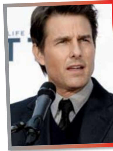
كروز في Mission Impossible ، والذي اظهر الممثل المزيّف والذي يقدم برنامجه الرئاسي المزيّف.

هل توم كروز هو الرئيس المستقبلي للولايات المتحدة الأمريكية؟ تساؤل انتشر بكثافة خلال الساعات القليلة الماضية، وهو ما أثار موجة من الجدل، حيث انتشر مقطع فيديو قصير يبدأ بعلم الولايات المتحدة الأمريكية وهو يرفرف، وظهر كروز وهو يجري وكأنه في طريقه للحاق بالانتخابات بطريقة أفلام الأكتشن التي يقدمها كروز.