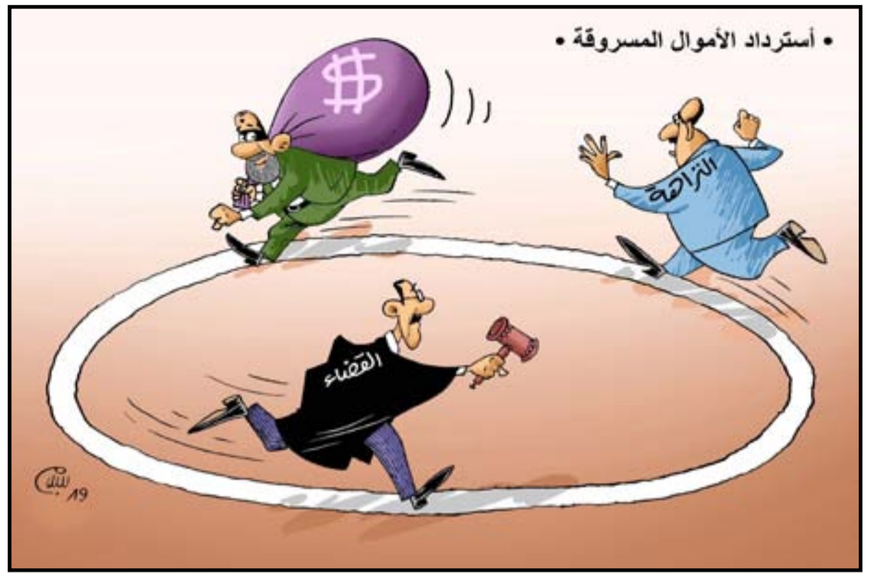
• أستراداد الأموال المسروقة •