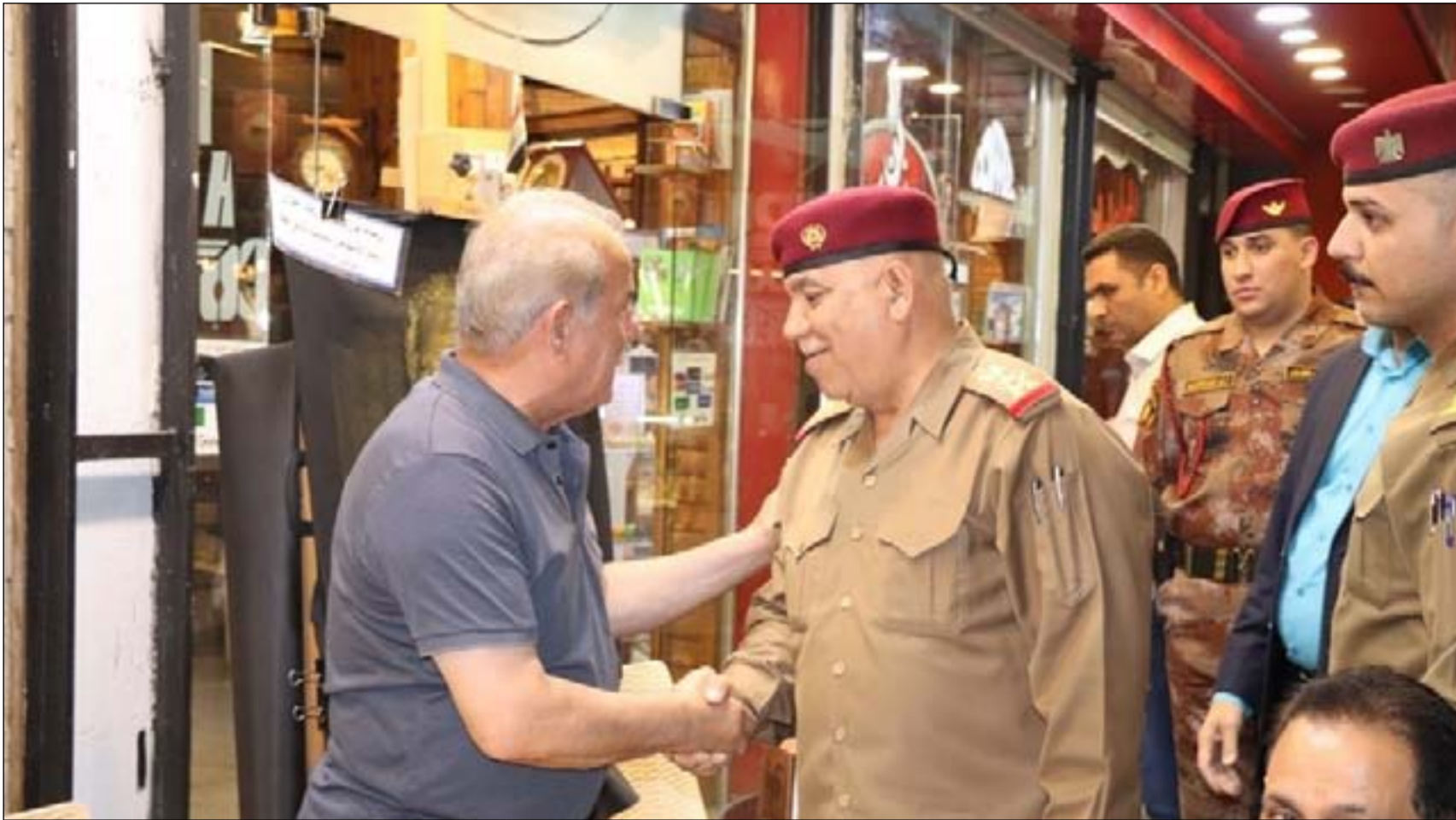
قائد عمليات بغداد يتجول في العاصمة.. اشراف

خلال الأشهر الماضية عمليات سرقة متكررة ومنظمة للمحال التجارية بالإضافة إلى السطو المسلح والاختطاف. واستناداً إلى الربيعي فإن أسباب وجود السرقات في العاصمة بغداد