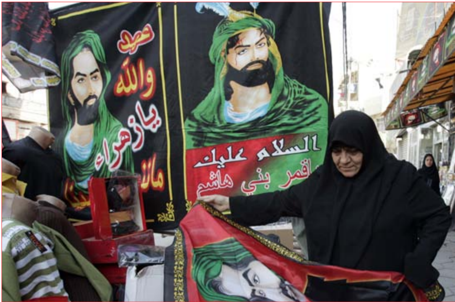
مناسبة استشهاد الامام الحسين عليه السلام تتقدم المدى بأحر التعازي للمسلمين كافة.....