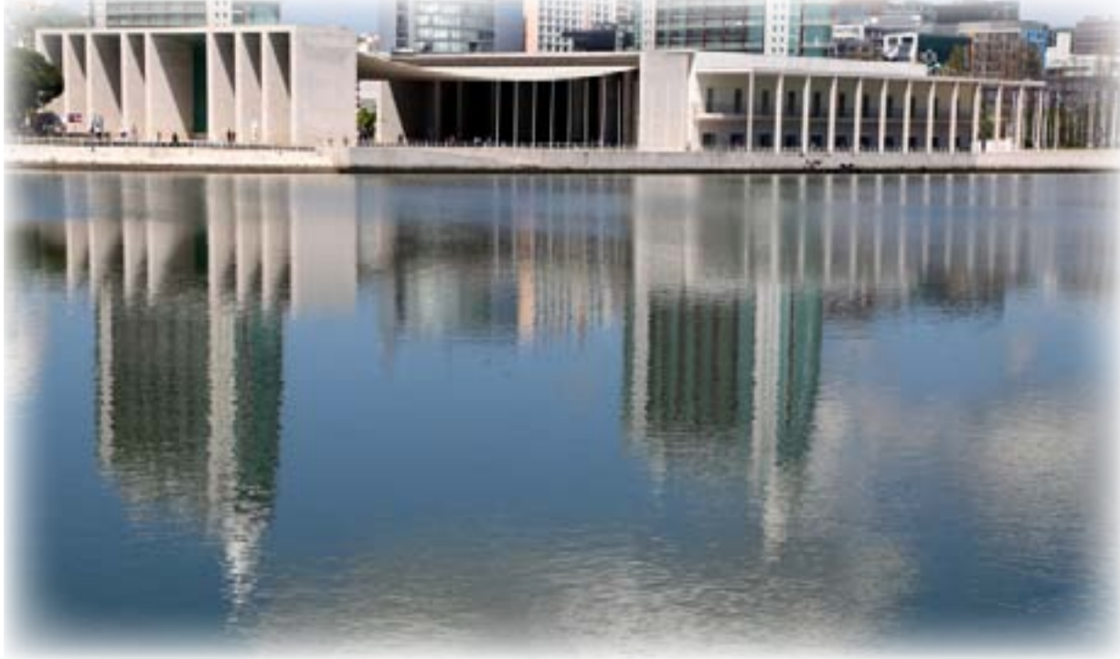
(الجناح الوطني البرتغالي) في معرض اكسبو ٩٨، لشبونة/ البرتغال، المعمار: "الغارو سيزا"، منظر عام.

تتميز بكونها عمارة حصرية، تسعى نحو رصانة مهنية عالية؛ وهي عمارة مشغولة بترو وتفكر عميقين، وهي إضافة الى ذلك تقراً يكونها ملائمة جدا الى نوعية البيئة المحيطة بها والتي "تنبت" فيها، و"سيزا" معمار حدائثي، من دون أنسى ريب. لكنه يصبو دوماً لقراءة (أو بالأحرى لإعادة قراءة) المنجز الحدائثي الأوروبي، وفقاً لطريقته الخاصة، وتبعاً لذائقة جمالية معينة ترسي عليها ملامحاً. إنه في هذا الجانب، يبرز لتكون عمارته إضافة واضحة ومميزة في المنتج الحدائثي المعماري الأوروبي.