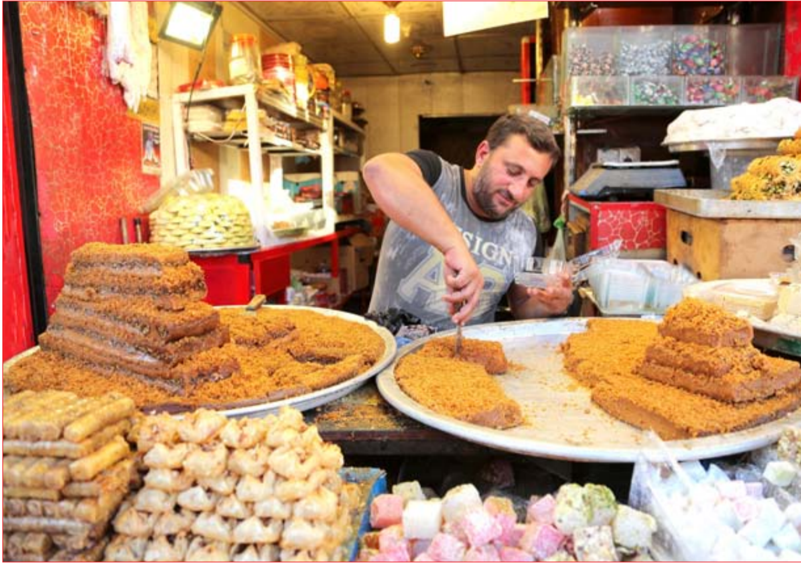
محال الدهين في الكاظمية ما تزال زاخرة.....