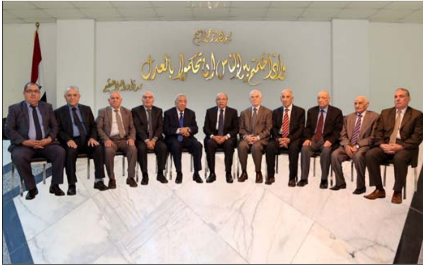
رئيس و أعضاء اللجنة الاتحادية

منح فقهاء الشريعة حق التصويت والفيديو يقلق الأقلية