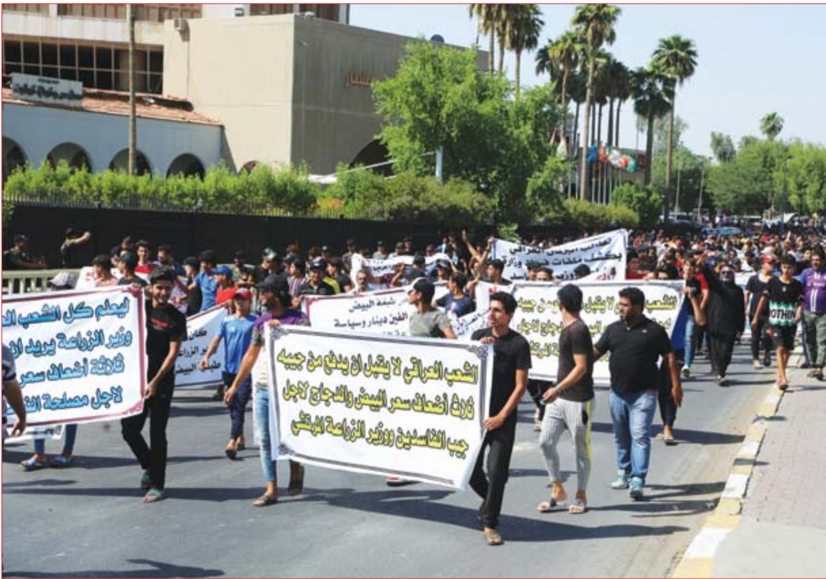
تظاهرة منددة بارتفاع اسعار المنتجات الحيوانية أمام وزارة الزراعة ..... عسة: محمود رؤوف

السابع حسب الضوابط والتعليمات الصادرة من قبل الاتحاد الدولي لكرة القدم. وأضاف أن الاتحاد الآسيوي لكرة القدم حدد الساعة السابعة مساء يوم العاشر من شهر تشرين الأول المقبل موعدا لمباراة منتخبنا الوطني ونظيره هونغ كونغ التي سيضفيها ملعب جندع النخلة بالمدينة الرياضية في محافظة البصرة في مهمة يسعى فيها العراق إلى الفوز بوافر من الأهداف من أجل العودة مجددا للمنافسة على المركز الأول الذي يتصدره المنتخب البحريني برصيد ٤ نقاط في ختام الجولة الثانية من مرحلة الذهاب في التصفيات المشتركة. وكشف أن وفد منتخبنا الوطني لكرة القدم سيغادر بعد انتهاء مباراة هونغ كونغ إلى العاصمة الكمبودية فوم بنه استعدادا للقاء نظيره الكمبودي في الساعة الثانية والنصف ظهر يوم الخامس عشر من شهر تشرين الأول المقبل على ملعب أولمبيك ستاديوم في تطلع جديد للأسود لانتزاع ثلاث نقاط ثمينة تعزز التطلعات نحو تأكيد المنافسة على بطاقة التأهل إلى الدور الثالث الحاسم لتصفيات المونديال وخطف بطاقة التأهل إلى كأس الأمم الآسيوية المقبلة.