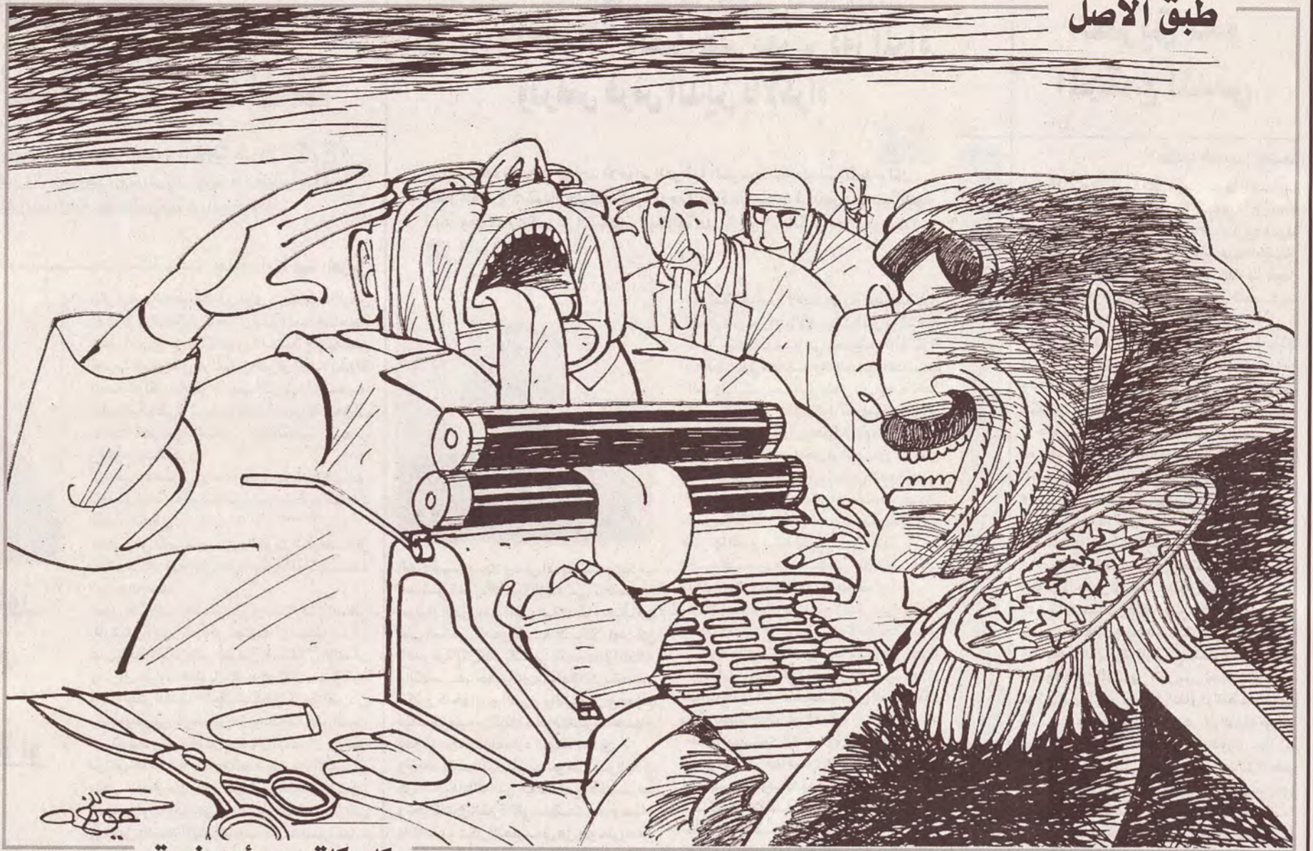
كاريكاتير: مؤيد نعمة