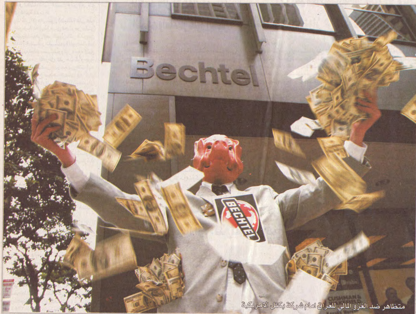
متظاهر ضد الغزو المالي للعراق امام شركة بكتال الأمريكية

الاحتلال قادراً على إدارة الوضع، في عراق يتمتع بالسيادة؟". ولدى بدء الاجتماع حول الوضع في العراق، طرحت فرنسا والمانيا، اللتان عارضتا الحرب على العراق، إمكانية صدور قرار جديد يحدد الدور الذي يمكن أن تضطلع به الأمم المتحدة في العراق في إطار نقل السلطة وتنظيم الانتخابات.