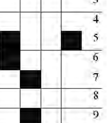
طه العدد السابق